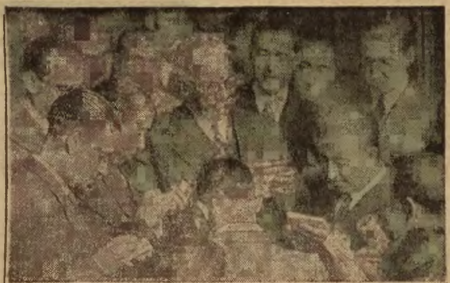
Premjer Lerroux udziela wywiadu dziennikarzom.

PARYŻ. (PAT). — Z Madrytu donoszą, że sytuacja w Hiszpanji jest w d. c. bardzo naprężona. Wczoraj krążyły pogłoski, że z powodu zamknięcia narodowej konfederacji pracy oraz kilku organizacji robotniczych będzie proklamowany strajk generalny. W noc tym wiadomościom zaprzeczono, jednak mimo tego zaprzeczenia strajk ogarnął dziś wszystkie zakłady drukarskie. W Madrycie nie wyszło ani jedno piśmo. Została zaprowadzona cenzura, zarówno wewnętrzna jak i wiadomości wysyłanych zagranicę. Premier Lerroux oświadczył dziennikarzom, że rząd przygotowany jest na wszelkiego rodzaju ewentualność i za wszelką cenę będzie bronił konstytucji oraz że zapewni krajowi spokój.