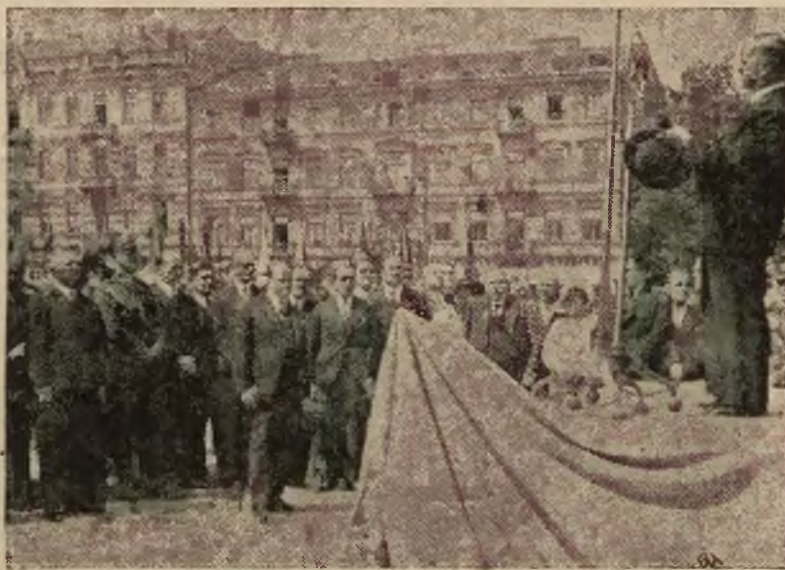
Przy udziale niezliczonych tłumów odbyła się na Placu Józefa Piłsudskiego wielka manifestacja żałobna ku czci tragicznie zmarłego ś. p. ministra Bronisława Pierackiego. Na zdjęciu — gen. Roman Górecki wygłasza przemówienie podczas manifestacji. Na pierwszym planie — prezydent miasta st. Warszawy Zydran Kościelkowski.

ciu — gen. Roman Górecki wygłasza przemówienie podczas manifestacji. Na pierwszym planie — prezydent miasta st. Warszawy Zydran Kościelkowski.