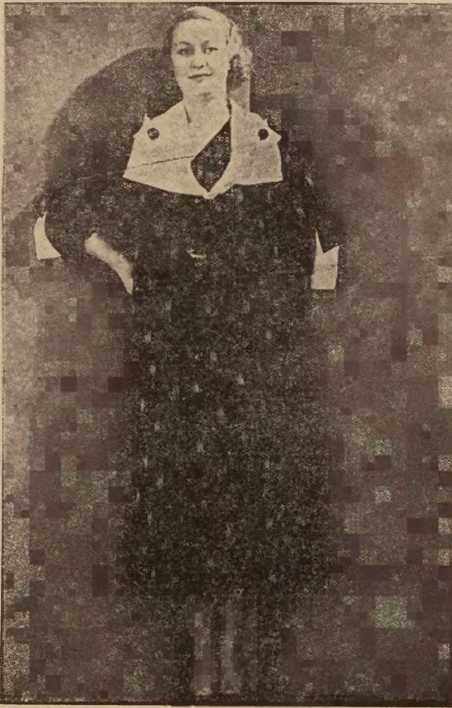
Suknia biała z fantazyjnymi wstawkami z białej piki