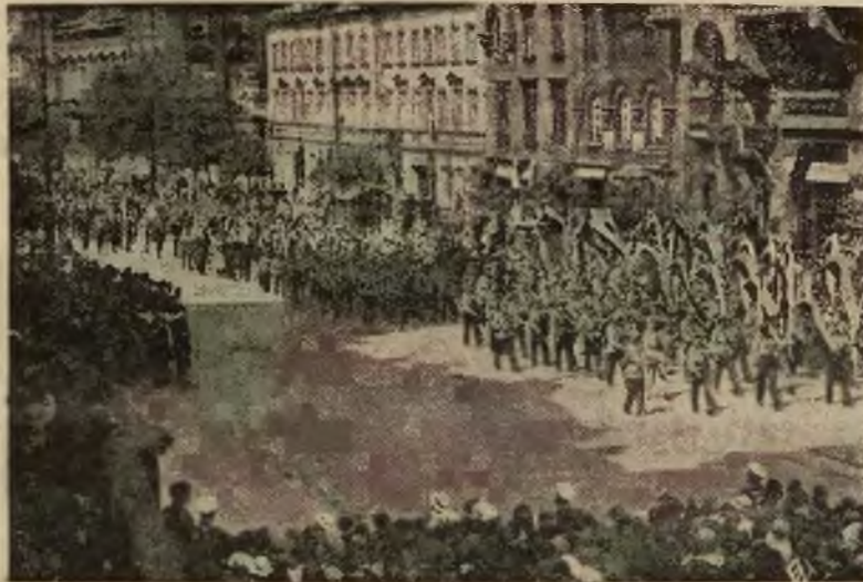
W ramach manifestacji żałobnych ku czci tragicznie zmarłego ś. p. ministra Bronisława Pierackiego odbyła się przed kościołem Św.