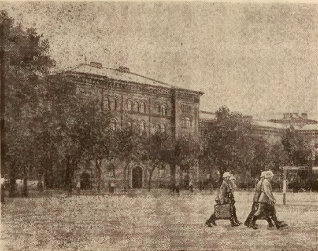
Na ilustracji koszary w Lichtenfelde, gdzie rozstrzeliwano przywódców szturmówek S. A.