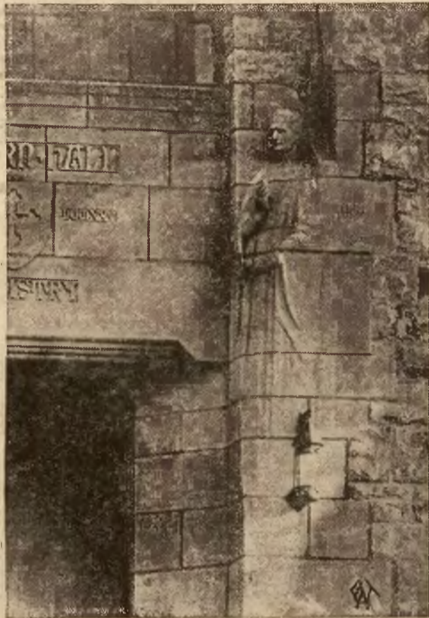
Statua Marji Skłodowskiej - Curie, wyrzyta w kamiennym murze u wejścia do Instytutu Radowego w Canton w Stanach Zjednoczonych.