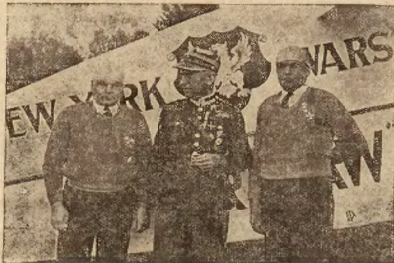
Bracia Adamowiczowie w towarzystwie zdobywcy Atlantyku południowego mjr. Skarżyńskiego na tle samolotu „City of Warsaw“