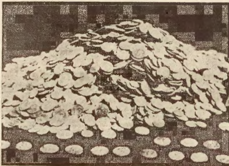
Pewien mieszkaniec S-1 Christoly w południ. Francji pod pnem drzewa znalazł skarb w po-