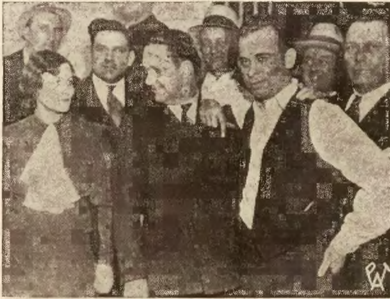
Na zdjęciu — Dillinger (drugi z prawej) po opuszczeniu więzienia w Arizonie, w towarzystwie szeryfa — kobiety i prokuratora.

Tożsamość zastrzelonego gangstera to nowa zagadka dla policji amerykańskiej. (m).