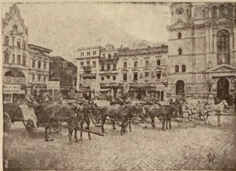
Miejski Komitet Pomocy dla Powodźian w Bydgoszczy zorganizował uliczną zbiórkę datków dla powodźian. Na zdjęciu wozy przeznaczone dla zbierania datków na St. Rynku, im. Marszałka Piłsudskiego, chwilę przed wyruszeniem na ulicę.