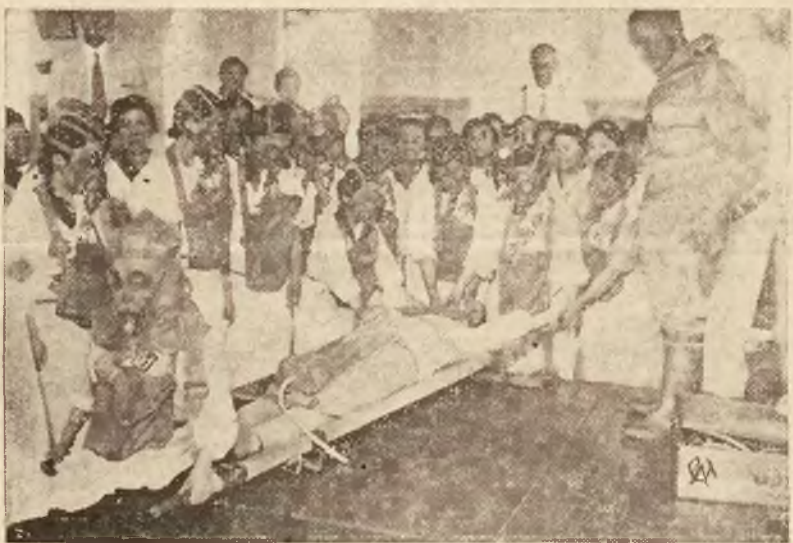
Członkinie japońskiego stowarzyszenia patriotycznego odbywają w szpitalu wojskowym w