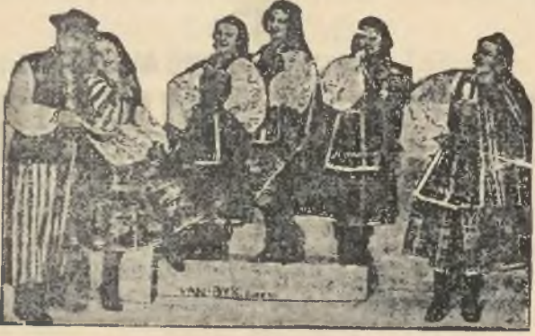
Zespół baletowy „Tanagra“ występujący w bieżącym programie w „Qui pro Quo“.