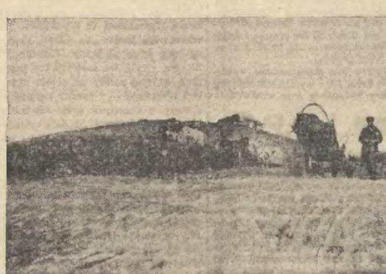
Dziesiątki furmanek wożą żwir.

Góra żwiru idzie na łopaty, do wozów i na szosę. Znowy widać konsekwentnie: jeżeli bowiem mamy uzyskać z Kownem komunikację lądową, — to tak trzeba.