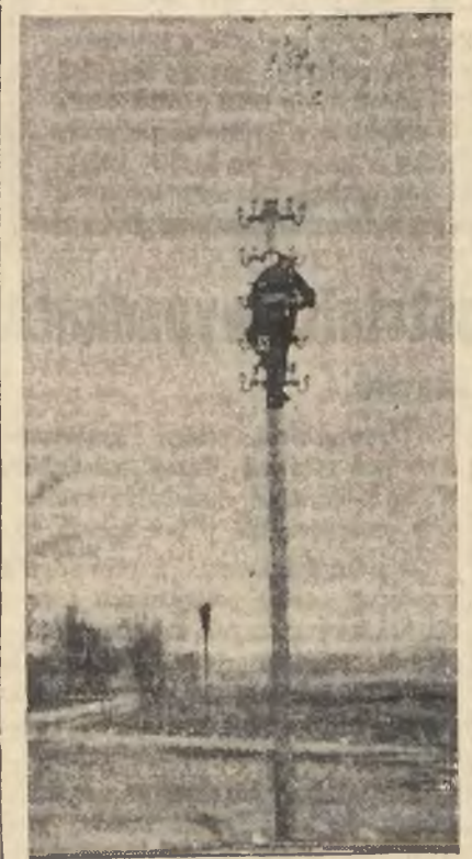
Zakładanie przewodów telegraficznych do Kowna.

Stary trakt do Kowna ożył nagle. Już teraz, dnia 23 marca 1938 roku.