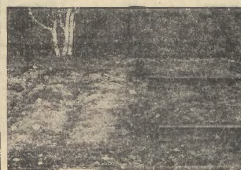
Obiecane szyny b. kolei Libawo - Romeńskiej w Zawiasach

w jego nudny, bo ślepy rodzaj. Ktoś nam powtarza ciągle: „cierpliwości!“