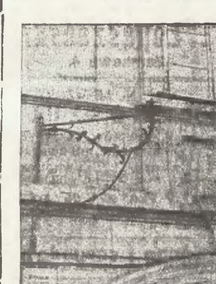
Usunięte kute kroksztyny z 18 wieku w domu przy ul. Gaona Nr. 16 w czasie ostatniego remontu.

Na ulicy Gaona Nr. 16 znajduje się bardzo stara kamienica. W podwórzu jej zachowały się jeszcze drewniane krużganki tak typowe dla Wilna. W jednym z jej mieszkań na parterze przed kilku laty znaleziono zamurowaną płytę nagrobka z hebrajskim napisem o