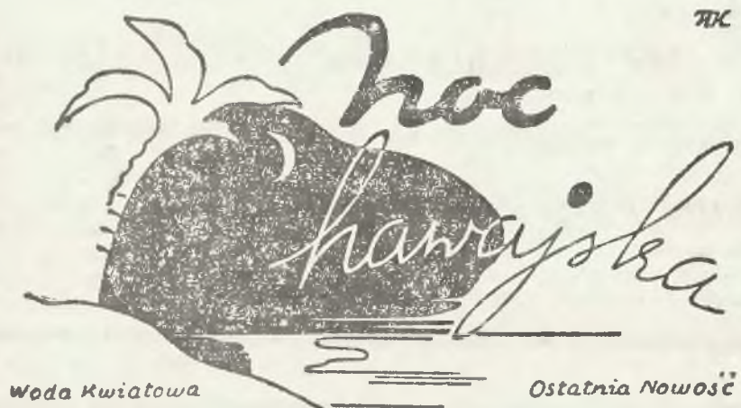
Woda Kwiatowa Ostatnia Nowość