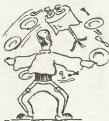
Wszystko się kręci...

Wielu lat pracy trzeba, ażeby w końcu, jak pisze Teodor Bujnicki: