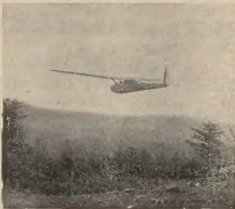
Szybowisko w Porąbce

Według danych na r. 1935 szybownictwo w Polsce przedstawia się następująco: Pilotów kat. „A“ i „B“ przeszło 3.000, pilo-