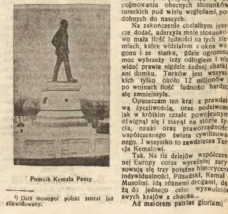
Pomnik Kemala Paszy.