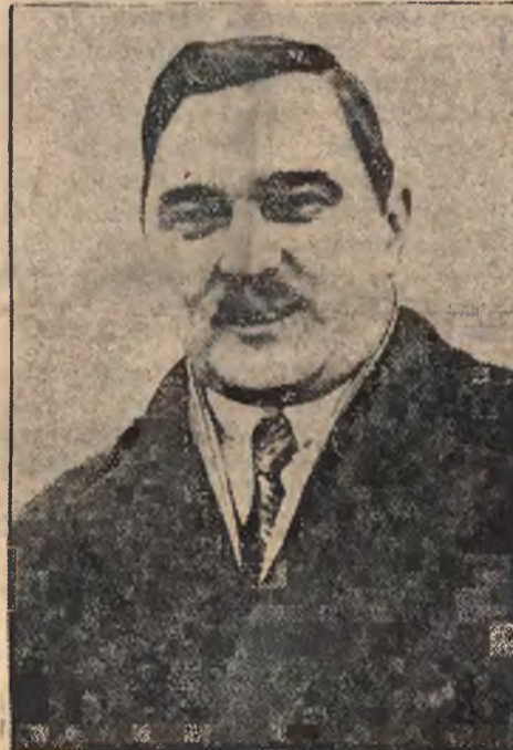
Nowy premier rządu jugosłowiańskiego Stojadinović