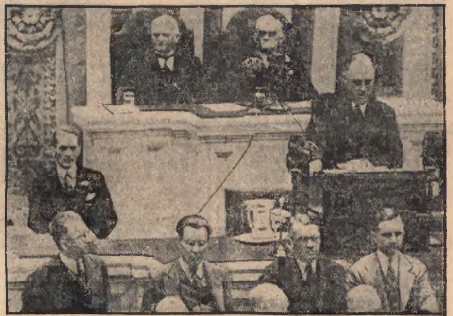
Amerykański prezydent Roosevelt zakłada sprzeciw w Kongresie.