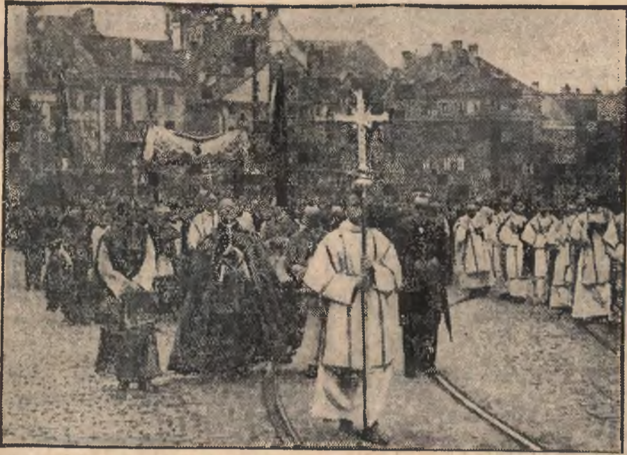
Procesja Bożego Ciała w Warszawie Na przodzie nuncjusz papieski ks. arcybiskup Marmaggi.