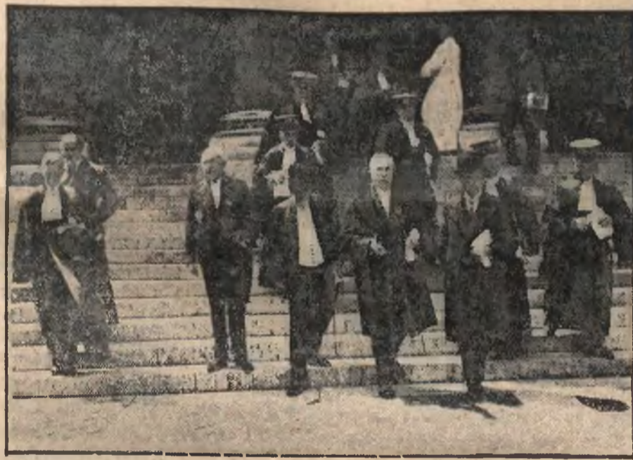
300-lecie Akademii Francuskiej „Akademyści” wychodzą z kaplicy w Sorbonie.