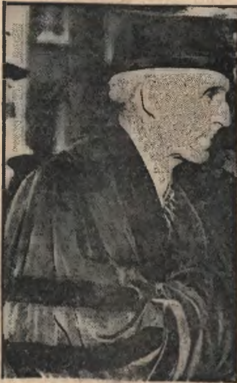
Znany amerykański fabrykant samochodów, Ford, otrzymał honorowy doktorat uniwersytetu w Colgate.