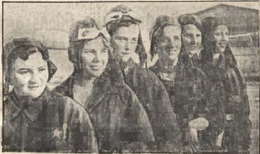
Lotniczki sowieckie, które dooknały skoku ze spadochronem z wysokości 7 tys. metrów.