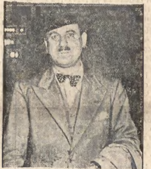
Nowy poseł bułgarski w Warszawie.