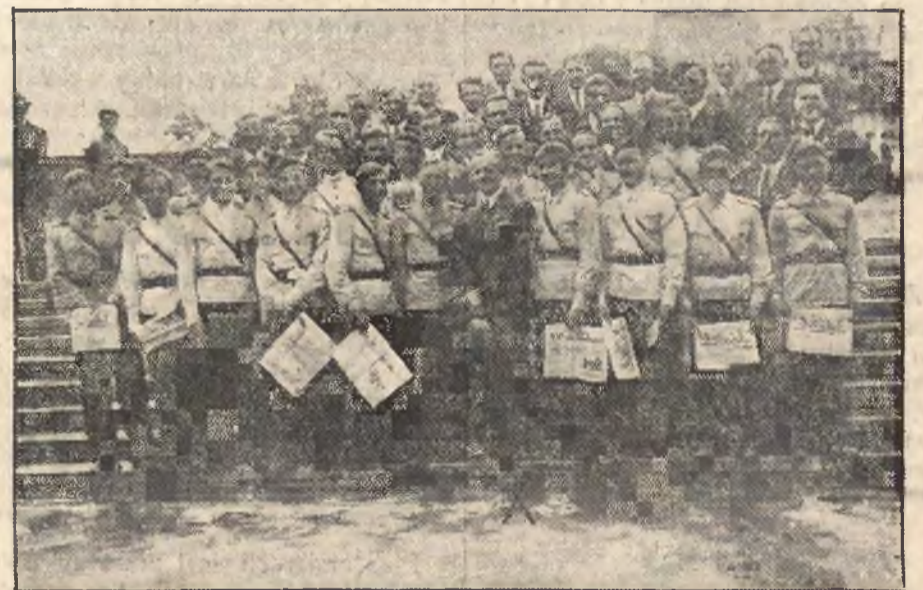
Narodowcy w Częstochowie sprzedają na ulicach nasze pismo