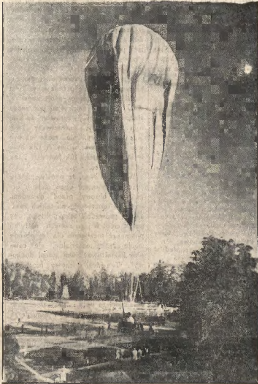
Sowiecki stratostat, wznosił się na 16 tys. metrów i uległ katastrofie.