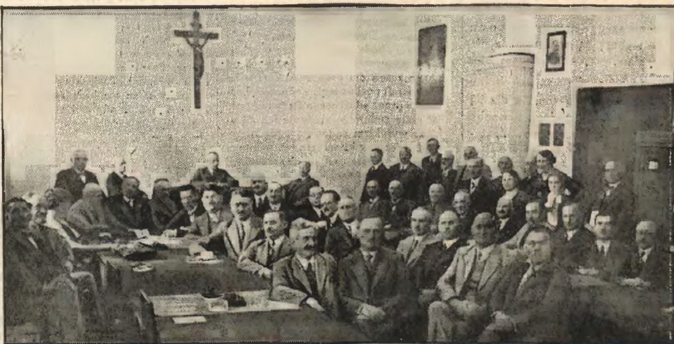
Ostatnie posiedzenie Klubu Narodowego w obecnym Sejmie