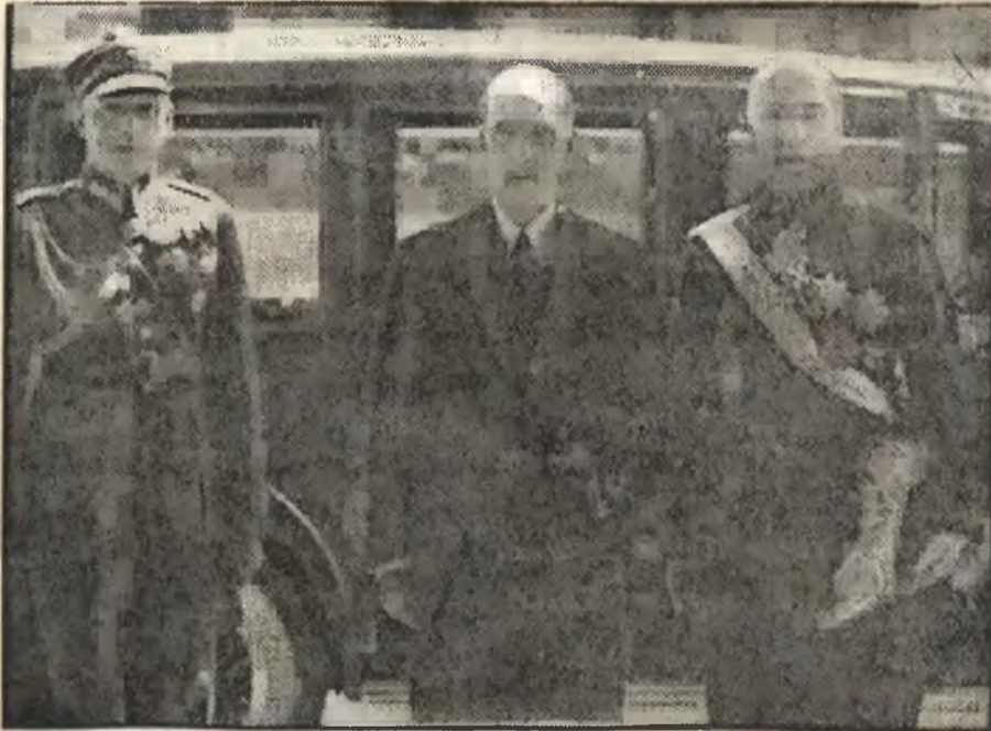
Poseł republiki Kolumbji w Warszawie.