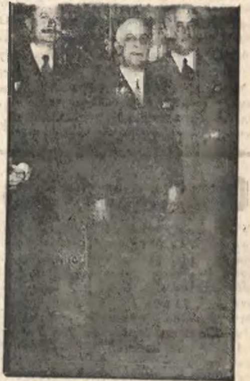
Nowy prezes rady miejskiej m. Paryża, Francuz-narodowiec, p. Chiappe.