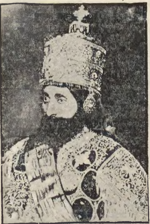
Cesarz, czyli Negus Abisynji, Haile Selassie.

Jeśli chodzi o Hiszpanję, to potężny tam obecnie szef katolickiej partji ludowej, Gil Robles, minister wojny w gabinecie Lerroux'a, robi eksperyment z republiką konserwatywną. Monarchję ma w rezerwie. Alfons XIII, także rozchodzący się z żoną (jak Jerzy II i arcyksy. Albrecht), ma narazie nikłe szanse powrotu. W Portugalji, po śmierci króla Manuela, brak pretendenta. Hohenzollernów usunął z serc niemieckich Hitler. Wrogami monarchów są bowiem dzisiaj nie tylko republiki, ale i dyktatury.