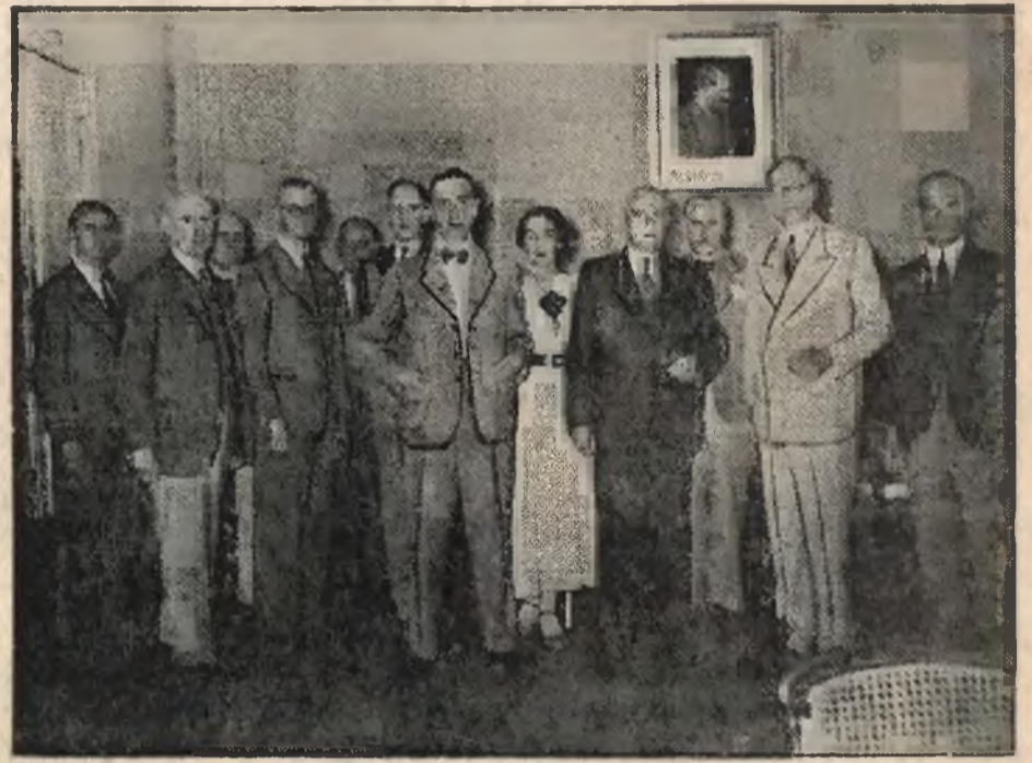
Rokowania handlowe polsko — niemieckie w Berlinie. Delegaci polscy i niemieccy.