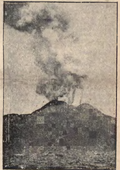
Nowy krater Wezuwiusza. W ostatnich dniach utworzył się w Wezuwiuszu nowy krater, z którego wypływa lava.