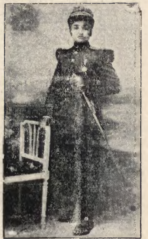
Oficerowie artylerji abisyńskiej otrzymali nowe mundury. Ale palce wylażą im z łapci.

Naszem zadaniem będzie jednak iść własną drogą i zmierzać do własnych celów.