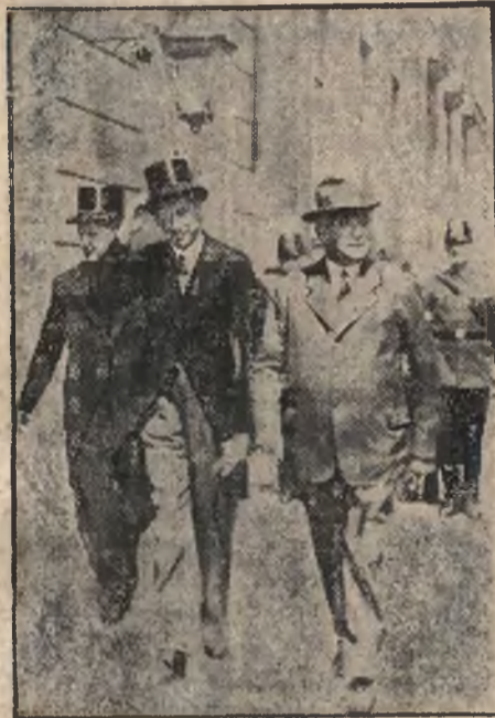
Minister Beck w Berlinie.