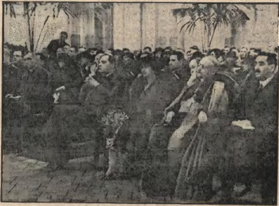
W dniu święta narodowego Francji odbyła się uroczysta akademja na ratuszu warszawskim.