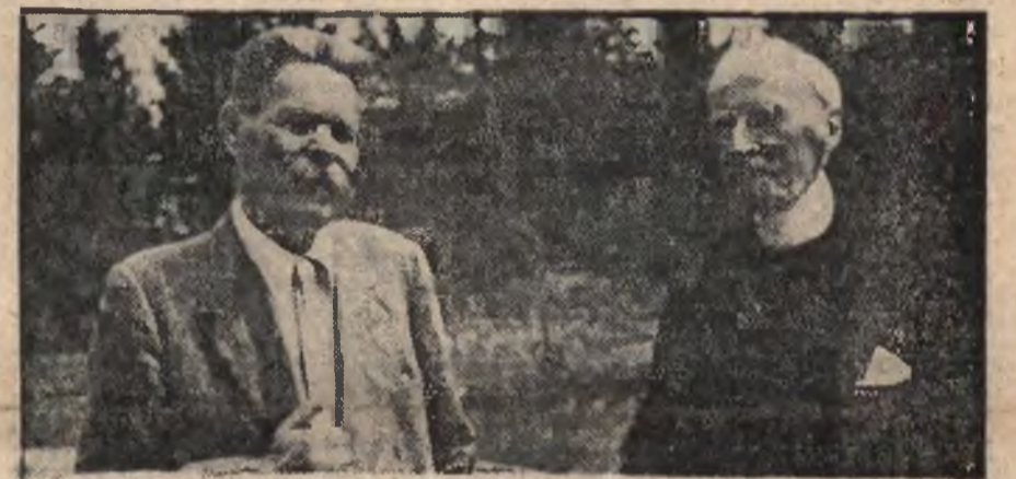
Pisarz francuski Romain Rolland u pisarza rosyjskiego Maksyma Gorkiego w Moskwie.