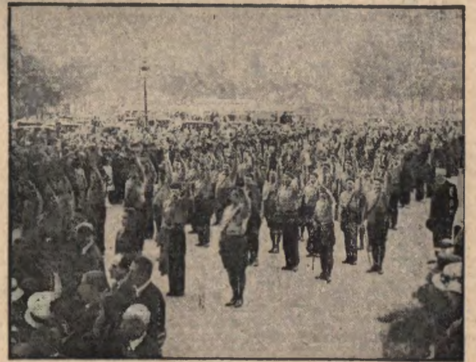
Dzień 14 lipca w Paryżu. Manifestacje organizacji „La Solidarite Francaise”.