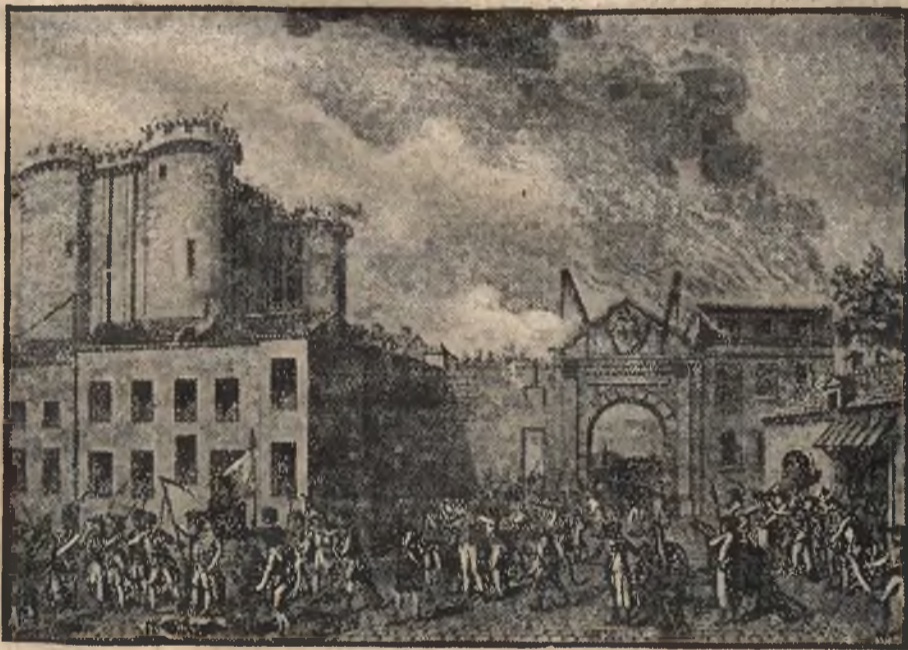
Wspomnienie rewolucji francuskiej. Zdobyte Bastylji 14 lipca 1789 r. (według ówczesnej ryciny).