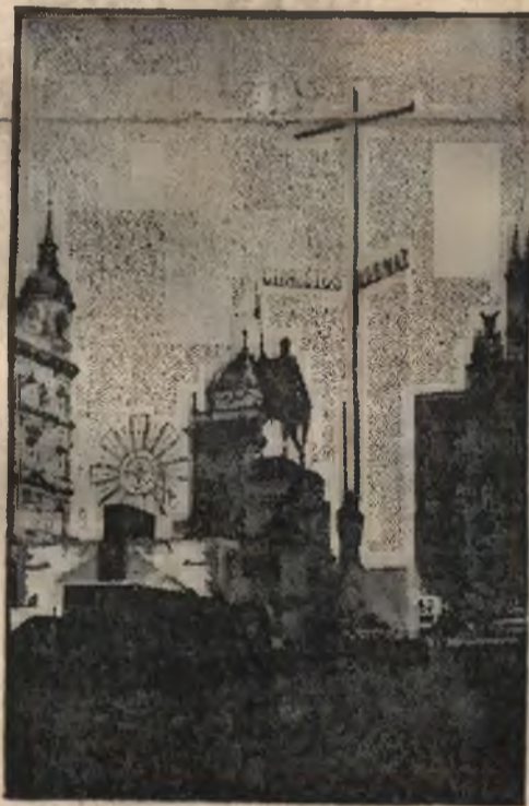
Kongres eucharystyczny w Pradze Czeskiej. Na Pracu Króla Wacława wzniesiono ołtarz Chrystusa - Króla.