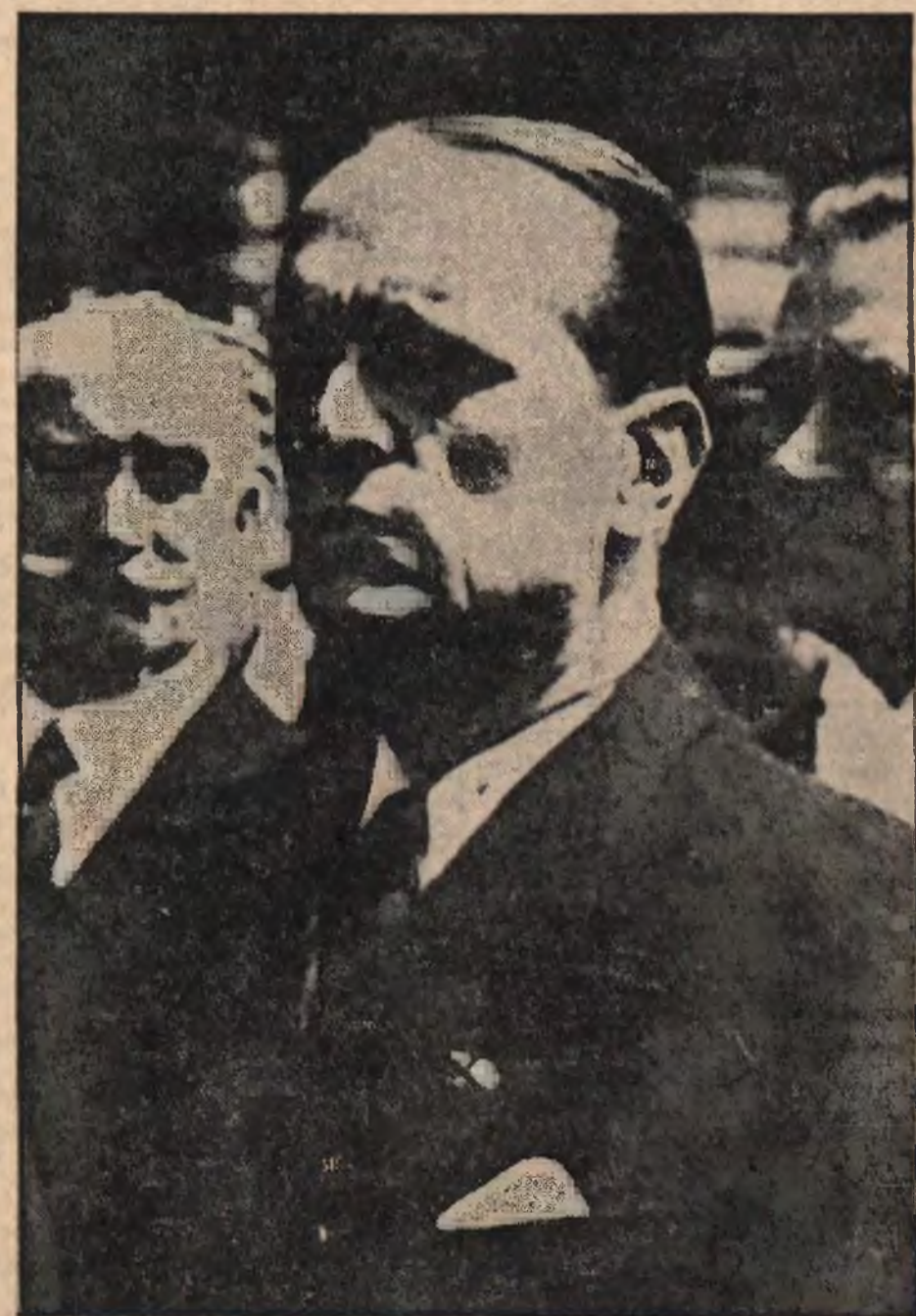
Pułkownik de la Rocque, przywódca francuskiej organizacji byłych żołnierzy frontowych „Kryzi Ognisty”.

Warto również zanotować w życiu polskim w Niemczech nowy fakt, który napawa nas radością: w najbliższym czasie rozpoczyna się prace nad budową dawno już upragnionego przez lud polski w Niemczech polskiego Liceum żeńskiego w Raciborzu. Ludność polska w Niemczech posiada dotąd jeden jedyny średni zakład szkolny — gimnazjum w Bytomiu, które tylko w drobnej części odpowiada istotnym potrzebom kulturalnym i narodowym społeczeństwa polskiego w Niemczech. Nowe więc Liceum żeńskie w Raciborzu wypełni częściowo obrzydliwą lukę w szkolnictwie polskim w Niemczech.