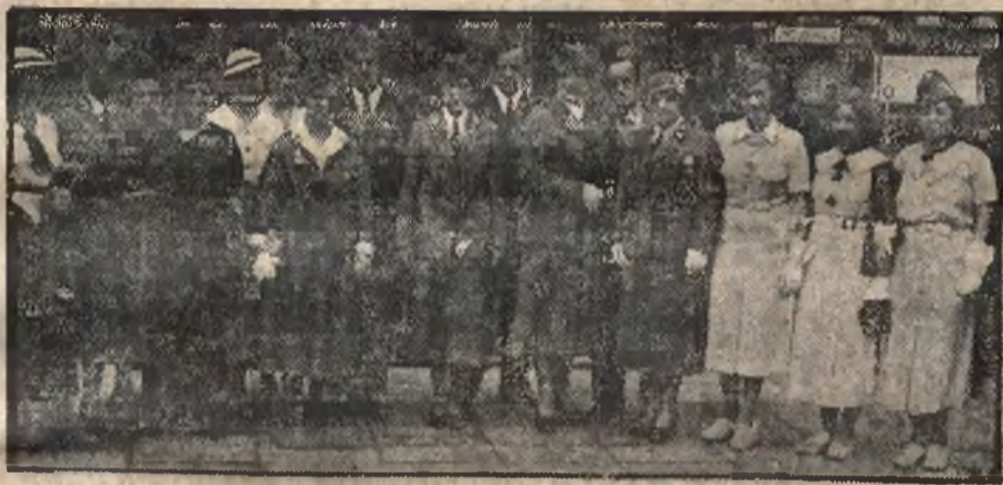
Delegacja polskich sokolic z Ameryki przybyła do Warszawy.