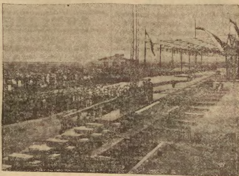
Ogólny widok stoczni podczas uroczystości poświęcenia jej. Nowa pochylnia przeznaczona jest dla budowy dużych statków.