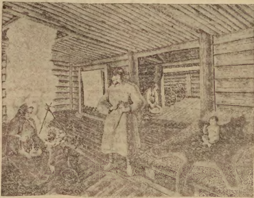
Rekonstrukcja wnętrza izby prasłowiańskiej sprzed 2500 lat na podstawie wykopalisk w Biskupinie. Rekonstrukcję wykonał artysta malarz Antoni Ziemitrud - Bryndza.

Większe potrzeby pieniężne zgłaszało również rolnictwo w związku z żniwami. Zbory zbóż odbyły się w pomyślnych na ogół warunkach atmosferycznych i przedstawiają się korzystniej niż w poprzednim roku. Ceny ziemiopłodów po ukazaniu się nowych zbóż na rynku doznały silnej zniżki, co skłoniło rząd do zorganizowania szerszej akcji interwencyjnej, mającej na celu zahamowanie spadku cen. W dziedzinie produkcji hodowlanej natomiast zarówno ceny jak i rozmiary zbytu nie wykazują zmian.