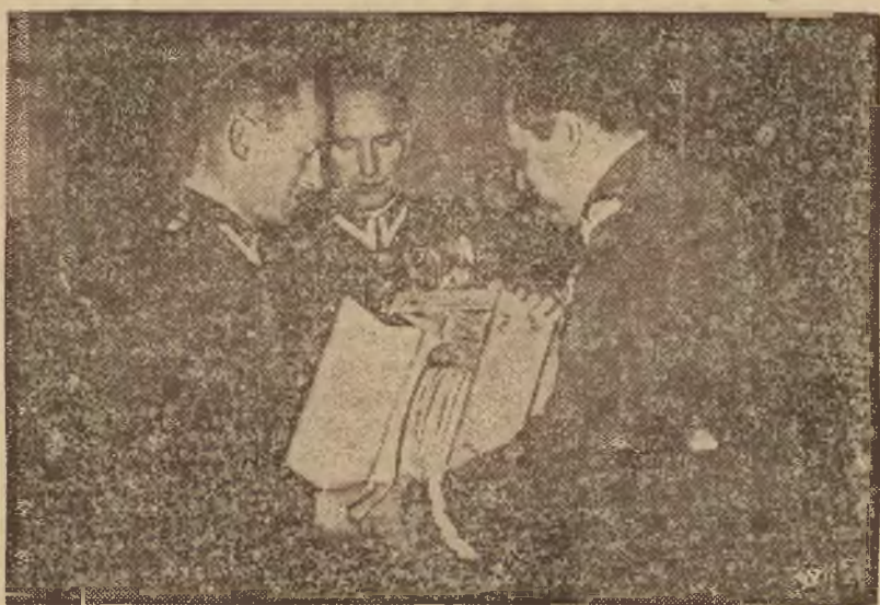
Wręczenie przez gen. Burhardt-Bukackiego zwycięzcom drugiego miejsca w tym raidzie patrolowi W. K. S. ze Lwowa, nagrody przechodniej Marszałka Śmigłego-Rydza.