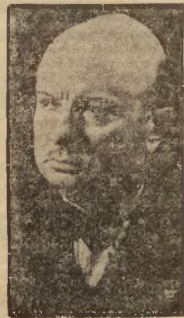
ANATOL DE MONZIE.