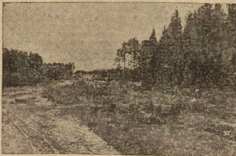
Roboty ziemne przy budowie.

Fragmenty z budowy drogi Wilno — Rynkonty — Zawiasy.