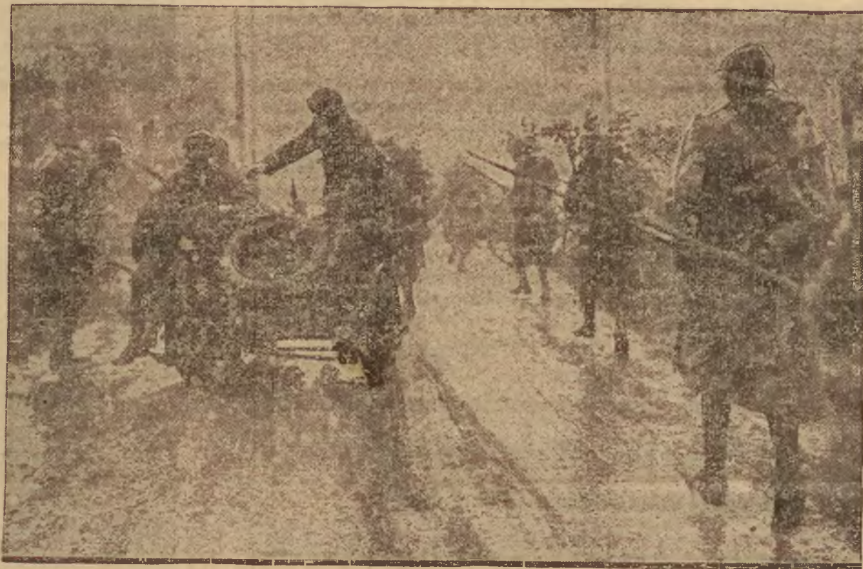
Podczas ostatnich wielkich manewrów francuskich wiele zainteresowania wzbudziły zmotywowane oczyszczenia.