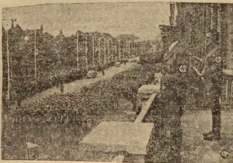
Kanceler Adolf Hitler w momencie przyjmowania z balkonu „Deutscher Hof” dążył do formacji partyjnych na ulicach Norymbergi. Obok kancelerza stoi minister Rudolf Hess.