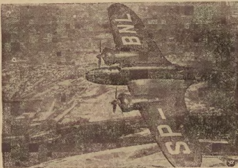
Samolot dalekiego bombardowania „Łoś”

Samoloty te stanowią naszą chlubę i dumę, zaś ich zalety zostały w pełni ocenione nie tylko przez nas, ale i przez obce lotnictwo. Reprodukujemy trzy samoloty wojskowe polskie, które zostaną wystawione w Paryżu.