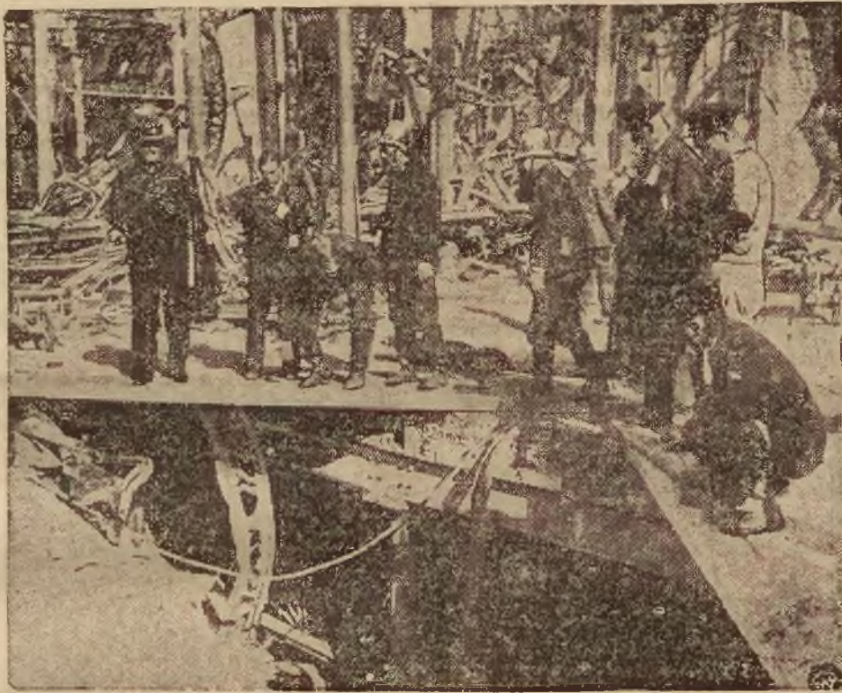
Moment gaszenia flejących jeszcze zgliszcz olbrzymich magazynów w Marsylii, które spłonęły podczas ostatniego pożaru