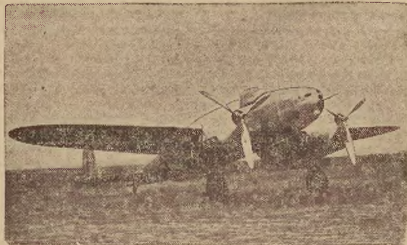
Samolot wojskowy „Wilc”.