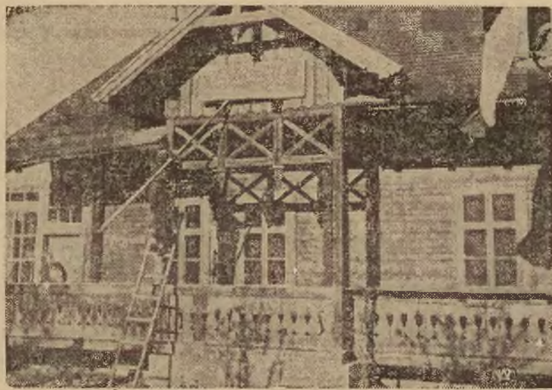
Moment zdejmowania szyldu z czeskim napisem z gospody w Jaworzynie.