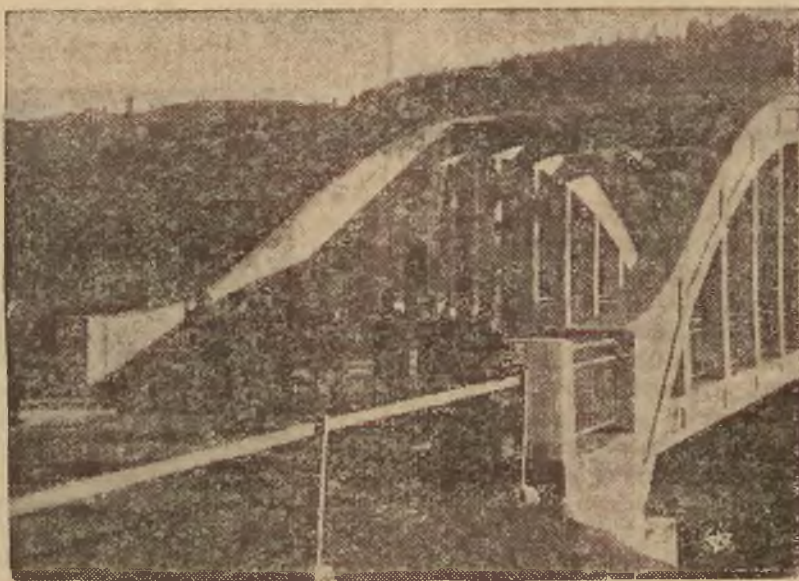
Rzut oka na most graniczny na rzece Kisucy w Świerczynowcu, na obecnej granicy polsko-słowackiej (po zajęciu rejonu Czadeckiego). Most leży na drodze prowadzącej do Czarnego i Skalistego.