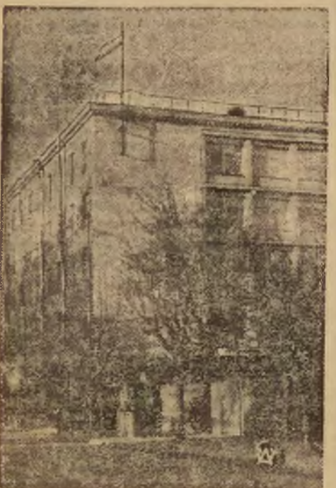
W dniu 18 grudnia odbyło się w Wilnie uroczyste poświęcenie nowego gmachu Ubezpieczalni Społecznej.

riat Związku, ul. Ad. Mickiewicza 11 m. 9, codziennie, prócz niedziel i świąt, od godz. 18—21.