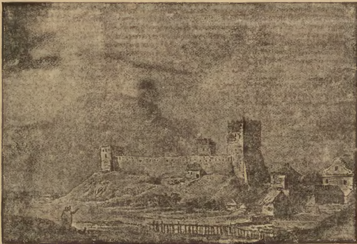
Akwarela Kazimierza Wojniakowskiego (ok. 1772—1812). Ze zbiorów Biblioteki Pawlikowskich w Ossolineum.