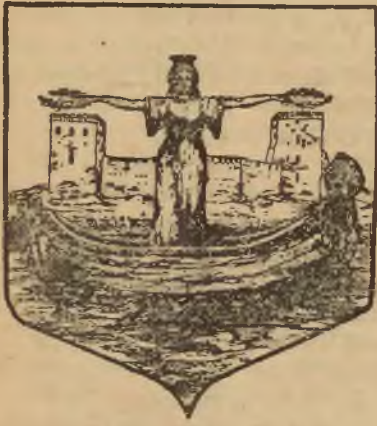
Herb miasta Łucka.

Gdy poraz pierwszy zobaczyłam nowe czesne witryny cukierni „Patria” w Łucku aż mnie zatkalo ze zdziwienia.