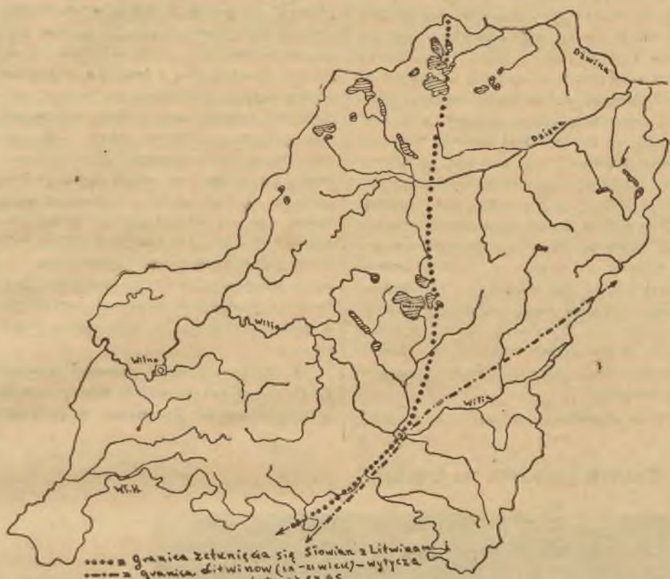
Mapa województwa wileńskiego. Granica zetknięcia się osadnictwa litewskiego i słowiańskiego (jednolite kropki) przedstawiona jest schematycznie, szczególnie między jeziorami koło Brasławia a Naroczem. Granica ta pokrywa się mniej więcej z granicą, kreśloną przez Łowmiańskiego na podstawie źródeł historycznych dla osadnictwa litewskiego w XIII wieku. Dotychczas wyznaczana w prehistorii granica osadnictwa litewskiego w okresie wczesnopaleolitycznym (kropki i kreski na przemian) podana jest za Antoniewiczem („Archeologia Polski” 1928 r.).

Słowianie i Litwini grzebali swoich zmarłych w okresie, który nas interesuje, pod kurhanami, bronili się zaś przed napadami wrogów na grodziskach („mikalnie”). Do naszych czasów zachowało się dość dużo tych niewątpliwych śladów stałego osadnictwa obu grup ludności. Czas zniszczył wiele tych zabytków, nieświado mość ludzka niszczy je i teraz zatrwa żałując. Oczywiście, jak można przypuszczać, najwięcej zniszczono szczególnie kurhanów na terenach gęściej zaludnionych, wziętych pod intensywną uprawę rolną (plug żelazny). Mimo to jednak rozmieszczenie w terenie zachowanych dotychczas grodzisk i ementarzysk kurhanów-