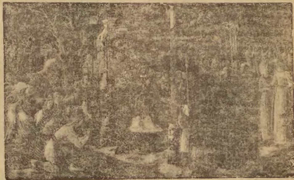
Chryst Litwy. Rok 1386.