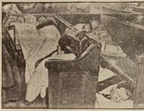
Pozbawieni podczerz ostatniej powodzi dachu nad głową mieszkańcy m. Pittsburgh w Stanach Zjednoczonych A. P. znaleźli przytułek w kościele.