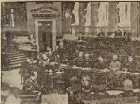
Posiedzenie austriackiego parlamentu, na którym uchwalono powszechny obowiązek wojskowy.