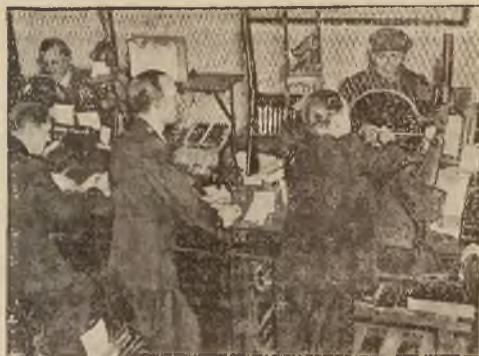
Kasjerzy bankowi w Irwington w Stanach Zjednoczonych A. P. zgrupowali się w ręce karabinów maszynowych na wypadek nępadu bandytów.

Warunki prenumeraty, ceny ogłoszeń i informacje — na ostatniej stronie