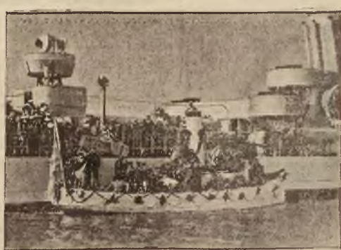
Okręt ze zwłokami Venizelosa przybył do greckiego portu Kandi.