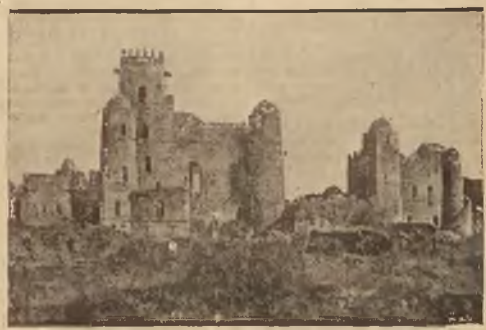
Ruiny zamku cesarzy abisyjskich w Gondarze. Zamek ten zbudowali w XVII w. arcybiskupi europejscy. Później został on opuszczony, zaniedbany i rozpadł się w gruz.