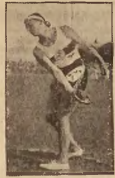
Niemiński Mauermeyer uzyskał nowy rekord świata w rzucie dyskiem (47,99 m).