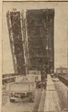
Wyspa Rugia w Niemczech (do czasów Bolesława Krzywoustego należała do Polski) została połączona mostem ze słynnym lądem. Jedną przelotem tego mostu można podnieść aby przepuścić okręty.