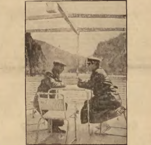
Prezydent Czechosłowacji Benez złożył wizytę królówi rumuńskiemu. Obaj mężowie stenu odbyli wycieczkę Dunajem