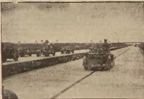
Takie drogi samochodowe pabudowane w Niemczech ze względów strategicznych (dla ułatwienia masowych transportów wojsk).

Warunki prenumeraty, ceny ogłoszeń i informacje — na ostatniej stronie