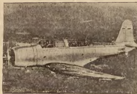
Nowy typ amerykańskiego samolotu bombowego.