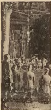
Kaplica w kopalni soli w Wieliczce, na głębokości 300 metrów pod ziemią, cała wykuta z soli.