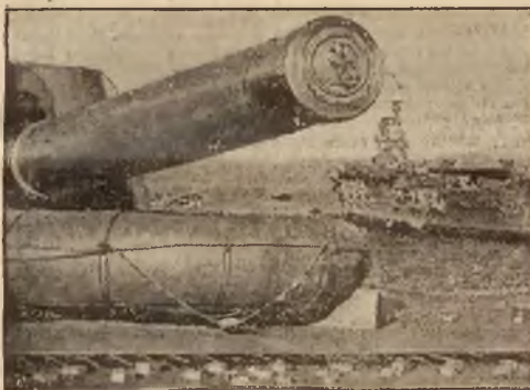
Potężne brytyjskie okręty wojenne zjawily się — w związku z wypadkami w Hiszpanii — na morze śródziemnym.