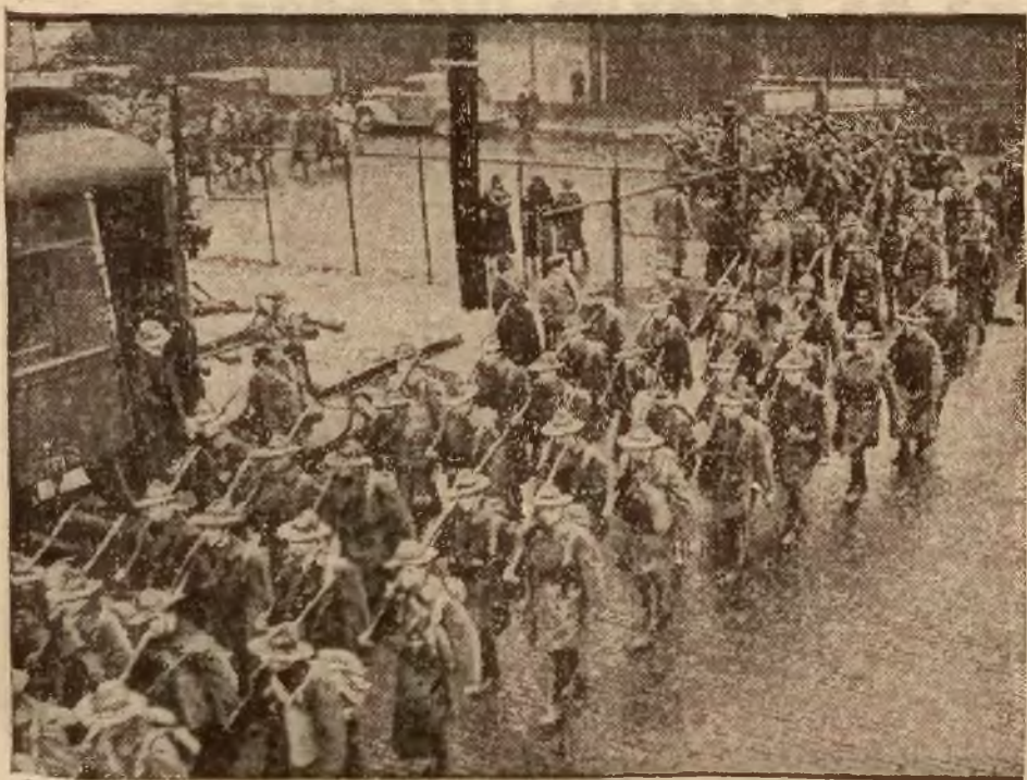
Strajk w Detroit (Ameryka) tłumiony jest przez władze amerykańskie przy pomocy wojska. — Żołnierze maszerują do fabryk, aby je zająć.

Warunki prenumeraty, ceny ogłoszeń i informacje — na ostatniej stronie