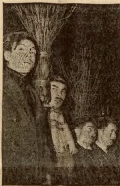
Organizacja faszystów belgijskich, której wodzem jest 30-letni Leon Degrelle, ma za odznakę — miotłę, na znak, że chce z Belgii wymieść wszelkie łajdactwa.