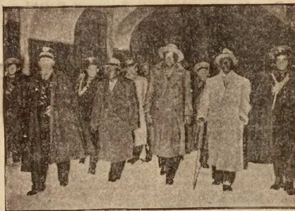
Abisyńscy wodzowie, Ras Imru i Ras Guba llate, którzy jeszcze parę tygodni temu stawiali Włochom opór w górach Abisynii, przybyli obecnie do Włoch jako jeńcy.