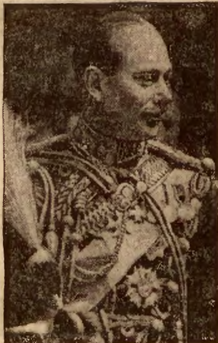
Książę Gloucester, brat króla angielskiego, Jerzego VI, ma mu pomagać w kierowaniu państwem.