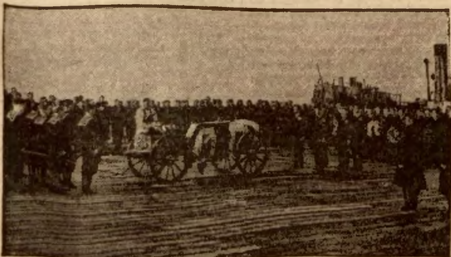
Oficer marynarki angielskiej, przyjaciel zmarłego króla Jerzego V, zmarł i każe się pochować w morzu. Zwłoki zawieszono na okręt, który zawiózł je na pełne morze i tam wrzucił na głębiny.