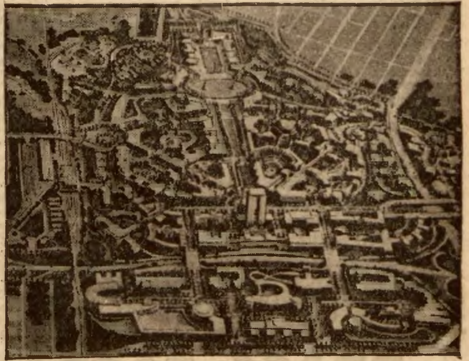
Tak będzie wyglądać wystawa światowa, urządzana w tym roku w Paryżu.