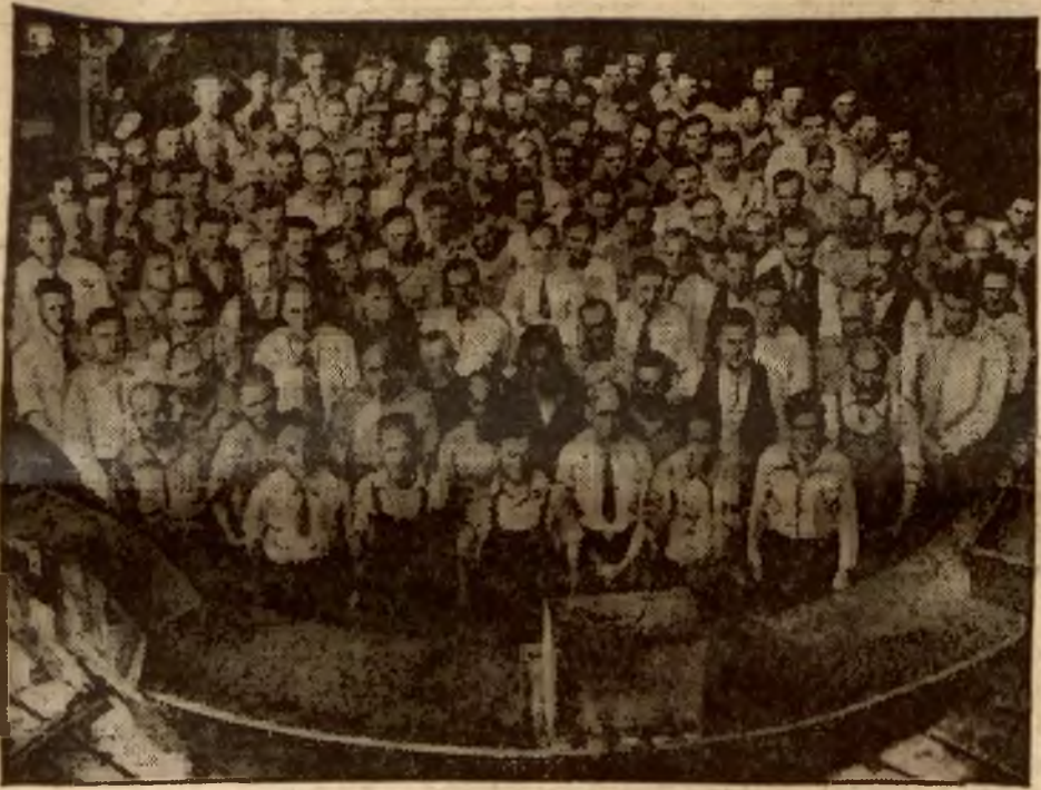
Oto jest rama zwierciadła największego na świecie teleskopu (olbrzymiej lunety do badania gwiazd), który się buduje w Mount Palomar w Kalifornii. Zwierciadło waży 20 ton i ma 5 metrów średnicy.

Ze względu na to, że artykuł, który miał być w „Tygodniku” zamieszczony jako wstępny, uległ na łamach „Warsz. Dziennika Narodowego” konfiskacie, dajemy dzisiejszy numer bez artykułu wstępnego.