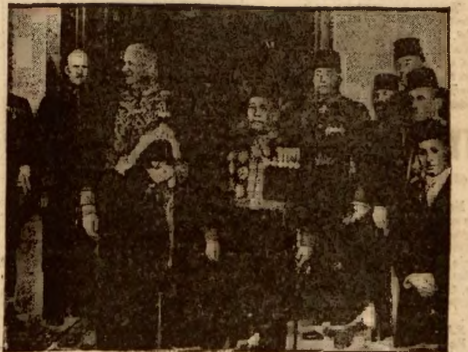
W wyniku uznania niepodległości Egiptu przez Anglię, Wysoki Komisarz angielski w Egipcie został przemianowany na ambasadora i złożył w tym charakterze wizytę królowi Egiptu, Farukowi.