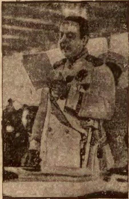
Mała republika Nikaragua w Ameryce ma nowego prezydenta. Jest nim p. Anastasio Somoza. Na fotografii widzimy go w pięknym mundurze „generała” nikaraguańskiej armii.