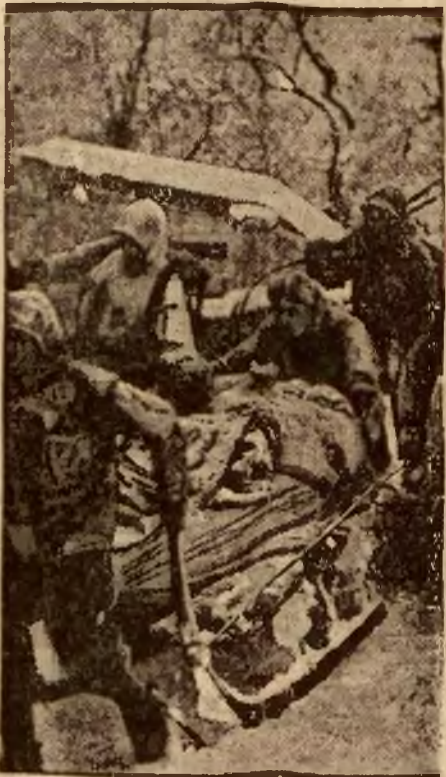
Ekspedycja ratunkowa w Alpach wiezie zmarniętych narciarzy, wykopanych z pod lawiny śnieżnej. Zdołano ich następnie przywrócić do przytomności i życia.