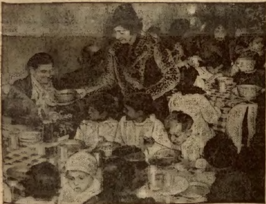
Córka króla włoskiego, księżniczka Maria Sabandzka, rozdaje żywność ubogim.