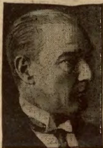
Dyktator Turcji, Kemal Pasza, który ostatnio przybrał nazwisko Kemal Atatürk.