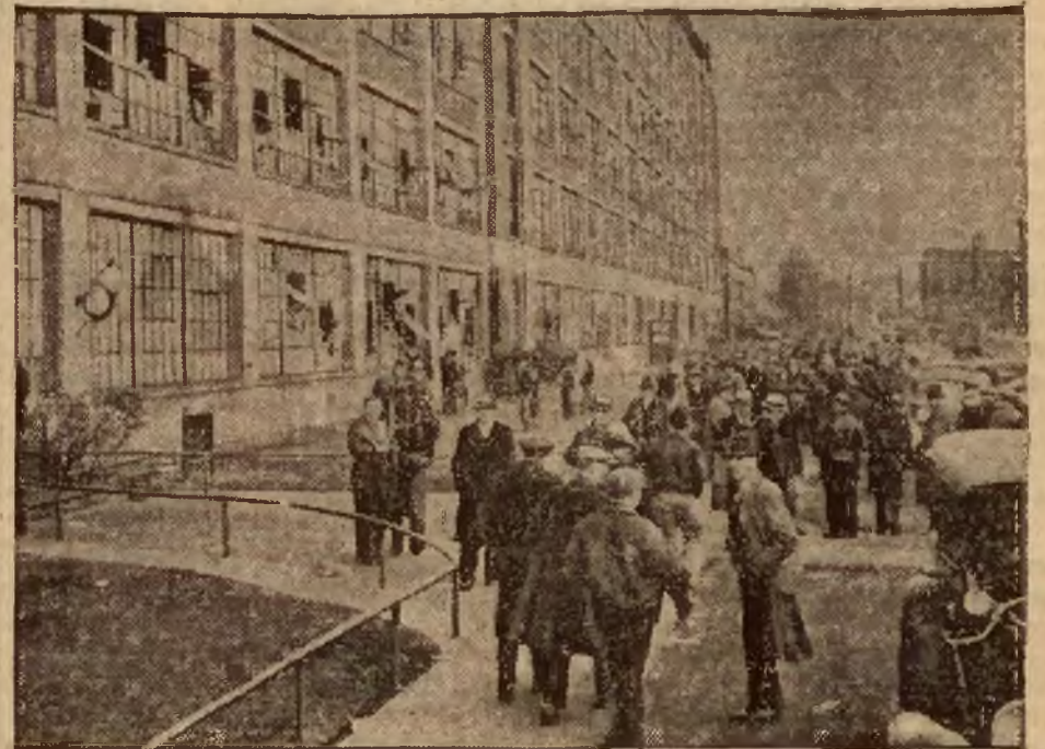
Strajk w przemyśle automobilowym w Ameryce.