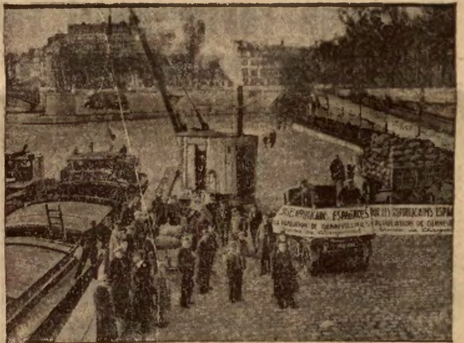
Francja Leona Bluma wciąż okazuje pomoc czerwonej Hiszpanii. Oto transport żywności dla czerwonej Hiszpanii, ładowany na berlinki pod Paryżem, celem przewiezienia kanałami na południe.