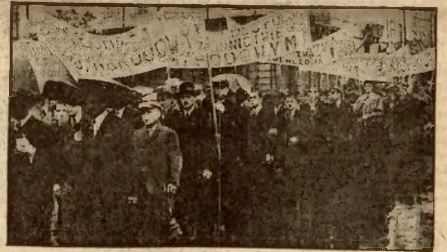
Fragment pochodu w czasie deszczu.

PRZEBIEG OBCHODU URO- CZYSTOŚCI 15 SIERPNIĄ, ZORGANI- ZOWANEGO PRZEZ STRONNIC- TWO NARODOWE, PODAJEMY NA STR. 4-ej i 6-ej.