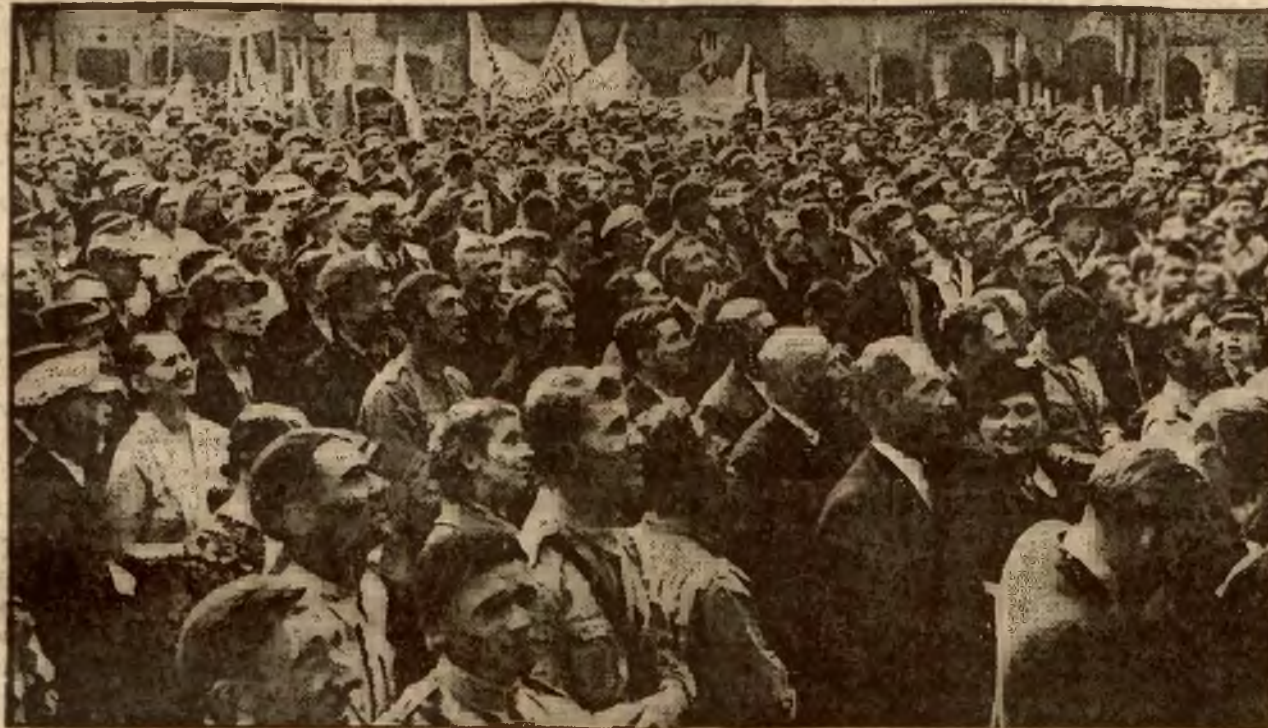
Fragment wielkiego zebrania Stronnictwa Narodowego na Rynku Starego Miasta.