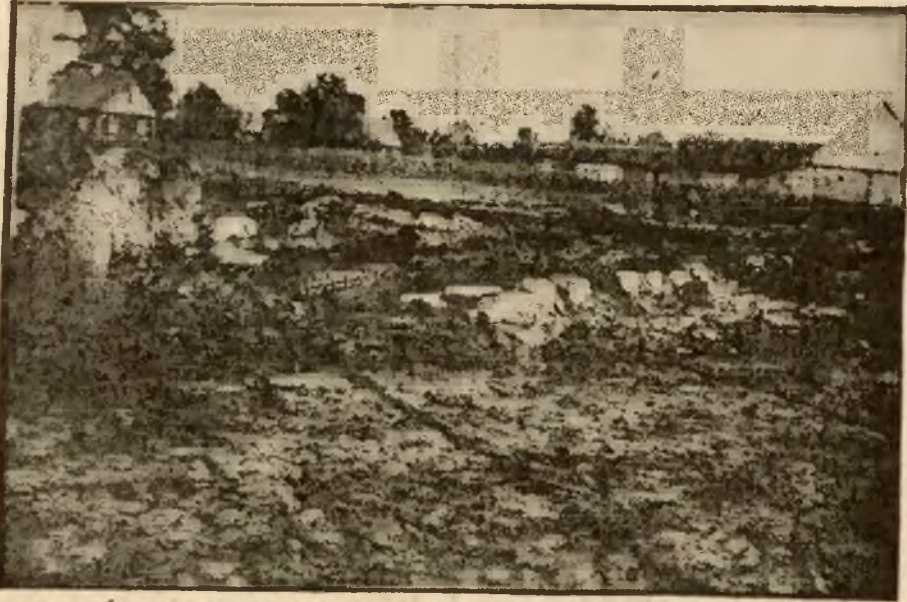
Przed kilku dniami stały tu stodoły ze świeżymi zbiorami.