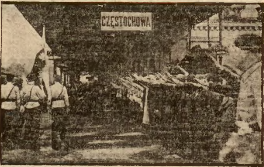
Członków Stronnictwa Narodowego z Poznania witają na dworcu w Częstochowie miejscowi narodowcy.

Na podkreślenie zasługuje udział orkiestry wojskowej p. Strzelców Kan., straży ogniowej, Sokola z Sieradza i szpitala z Warty. Szpital przysłał poza tym wóz sanitarny z pełnym ekwipunkiem.