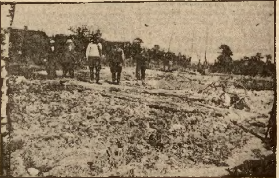
Pogorzelnicy na pogorzelsku