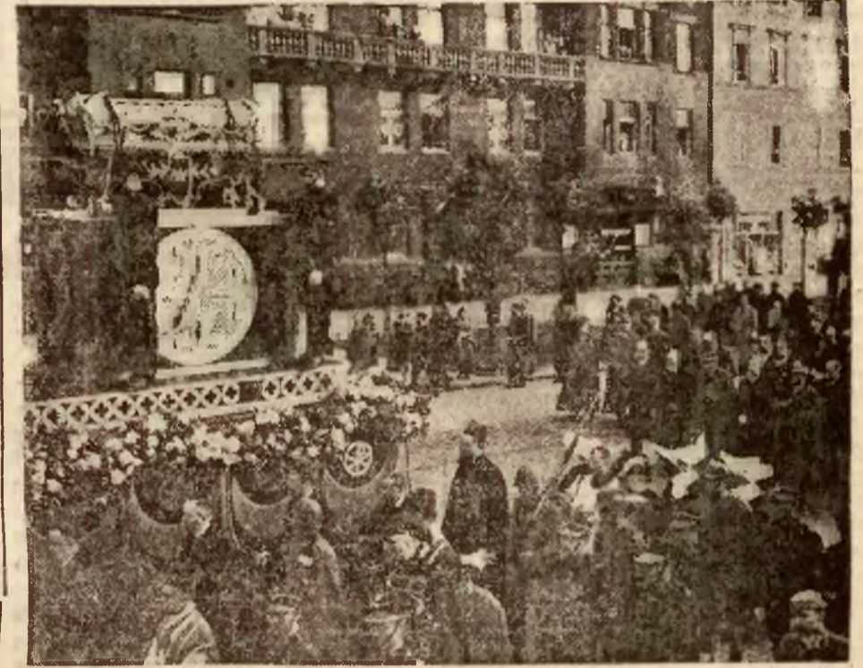
Uroczysta procesja z relikwiami św. Andrzeja Boboli w drodze z dworca Głównego do katedry św. Jana. Za trumną postępuje Marsz. Śmigły - Rydz w towarzystwie przedstawicieli rządu i parlamentu.

Przewaga żywiołu żydowskiego w zawodach wolnych, wyrażająca się chociażby w większości Izby Adwokackich i Lekarskich odsetkiem wyższym ponad 50 proc., wskazuje na to, że jesteśmy jeszcze dalecy od