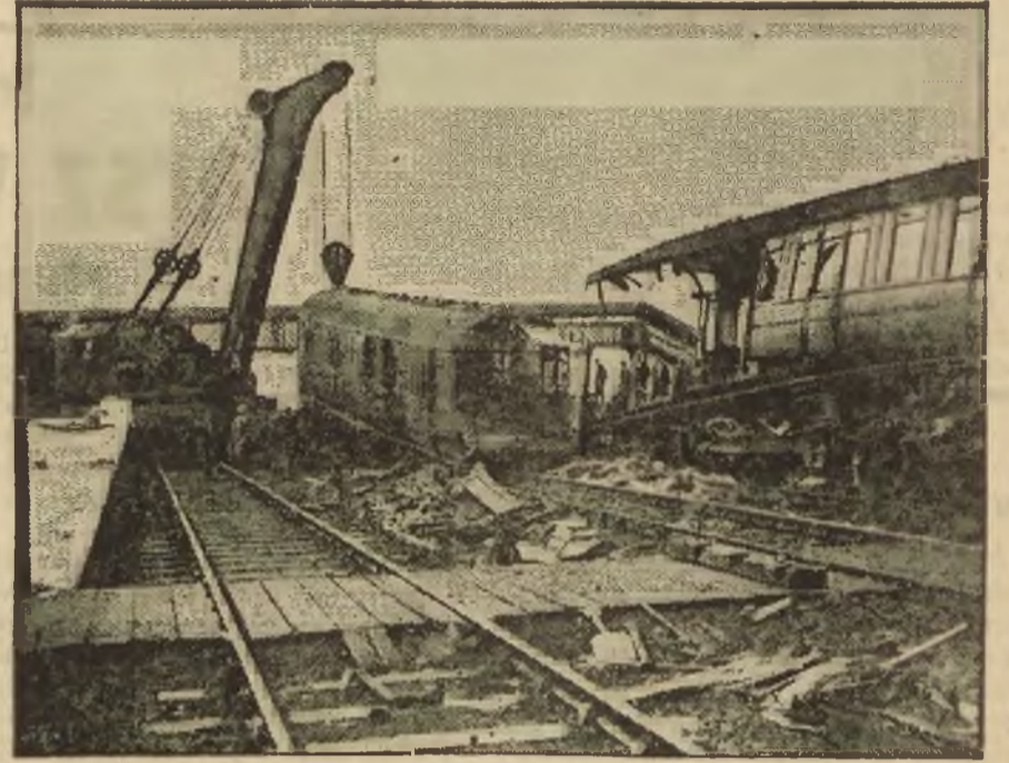
Po największej katastrofie kolejowej w Anglii. Widok rozbitego expressu w Welwyn Garden City.