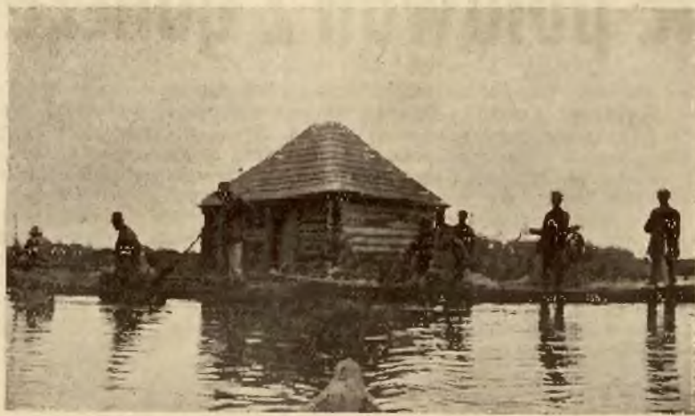
Kureń na Holocy

5) asygnować zł. 40 na ręce i do dyspozycji