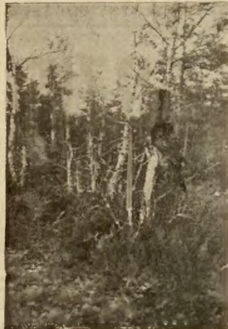
Głuszec ubiły na brzozie (okolice Kiemy)

re widocznie były przeznaczone na ścięcie, gdyż bobry od razu zabrały się do roboty i, przechyliwszy główki, nadgryzały drzewa, obchodząc je dokoła. Rozległ się charakterystyczny chróbot, podobny do szmeru wydawanego przez szczury, gryznie drzewa od strony wody. Po kulkunas gryzanie drzewa od strony wody. Po kulkunas tu minutach pracy bór zaszedł z przeciwnej strony, przysiadł na tylnych łapkach i ogonie, wyprostował się, oparł przednie łapy o drzewo i zwałił je do rzeki. Następnie bór zsunął się sam do rzeki, dogonił płynące już drzewo, uchwycił zębami za gałąź i, płynąc holował je w kierunku zatoki. Dotarłszy do niej, oparł gruby koniec pnia o brzeg tak, że wierzchołek, spychany prądem, znalazł się tuż przy pomoście. Wówczas bór wylazł z wody, chwycił drzewo zębami za koniec i, cofając się, wciągnął czwartą część drzewa na ląd; poczem stojąc na pomoście, powpychał gałęzie pomiędzy pnie. W tym czasie drugi bór ścinał grubsze drzewo. Nie mogliśmy zaobserwować dalszej ich pracy, gdyż, spłoszone jakimś szelestem, umknęły. Sie-