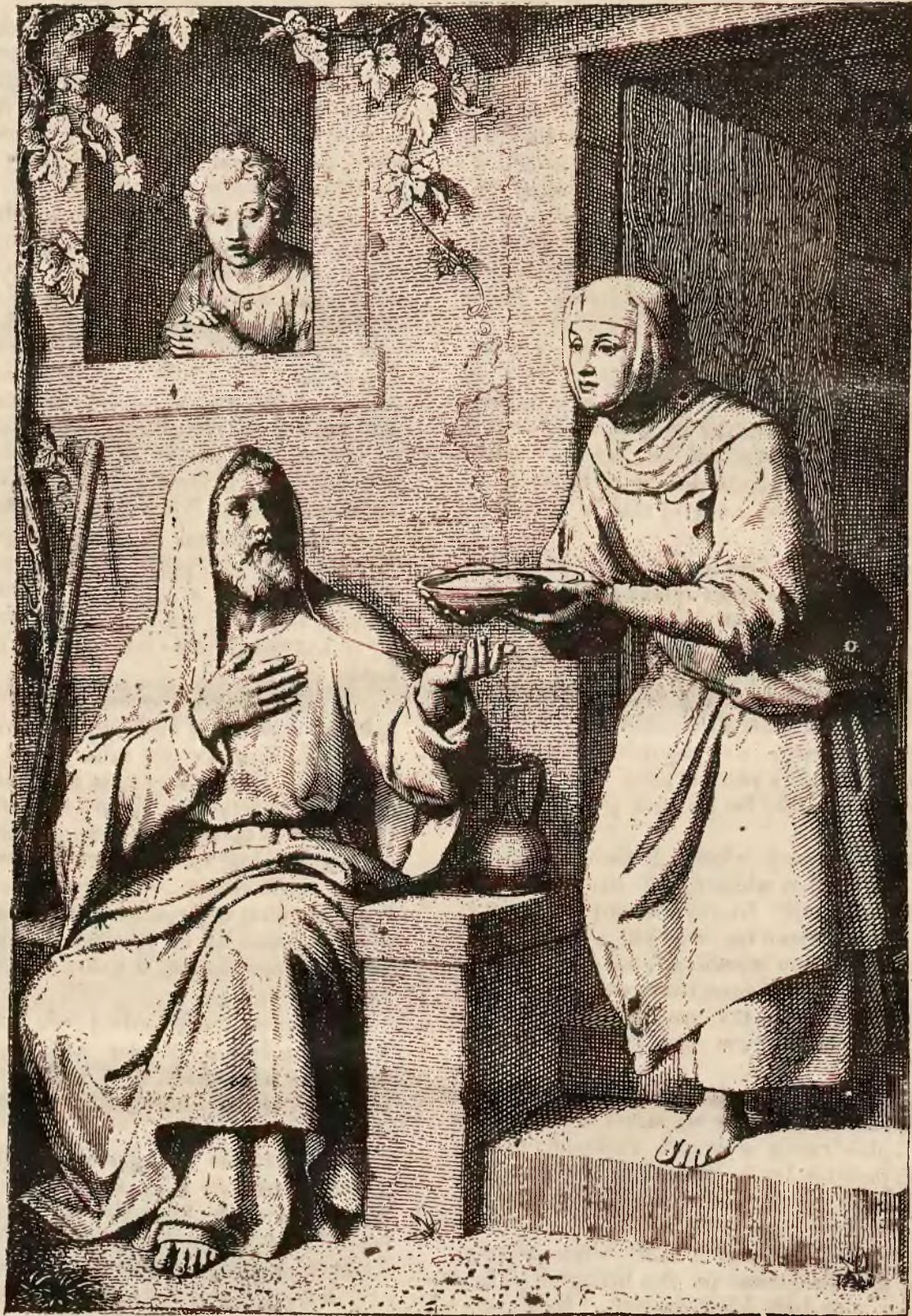
PROROK ELIASZ U WDOWY SAREPTY.