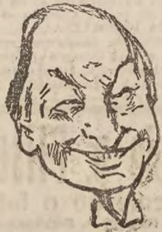
1) Na pierwszym posiedzeniu („Anglja górą!”)