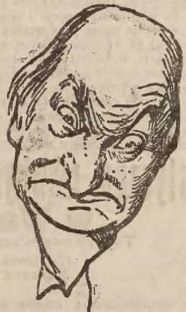
3) Na ostatnim posiedzeniu („Kłapa! Turcy nie chcą podpisać traktatu pokojowego!”)