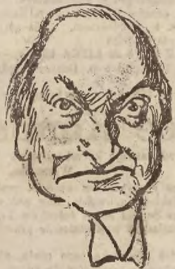
2) Na 29 posiedzeniu („Coś się psuje...”)