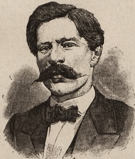
Z fotografii w Irkucku 1870 r.