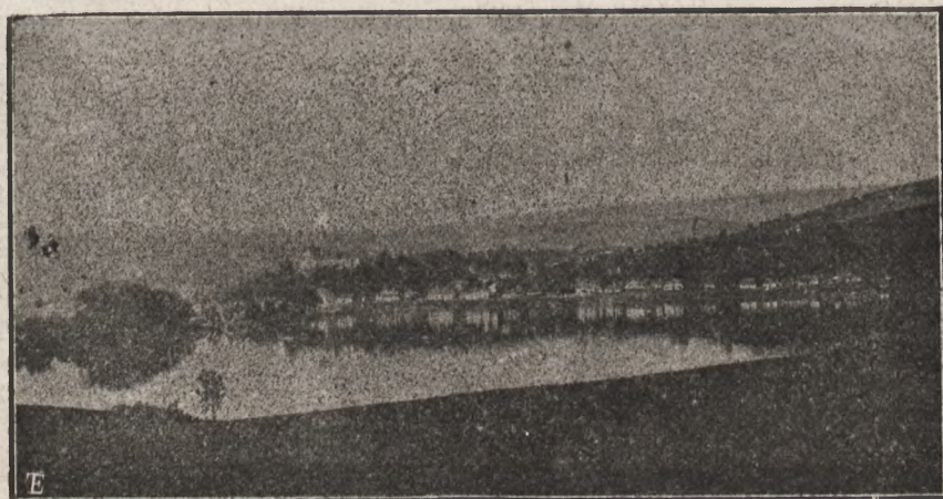
BRZEŻANY: WIDOK NA KLASZTOR BERNARDYNÓW OD STRONY STAWU.