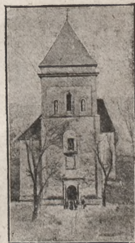
KOŚCIÓŁ W BUSZCZU OBOK BRZEŻAN.