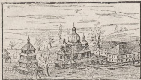
MONASTER W KRASNOPUSZCZY OBOK BRZEŻAN.

W szacie ozdobnej, upstrzonej pięknymi ilustracjami, wyszła wreszcie na świat Boży monografia miasta Brzeżan. Czas był najwyższy, bo nigdzie