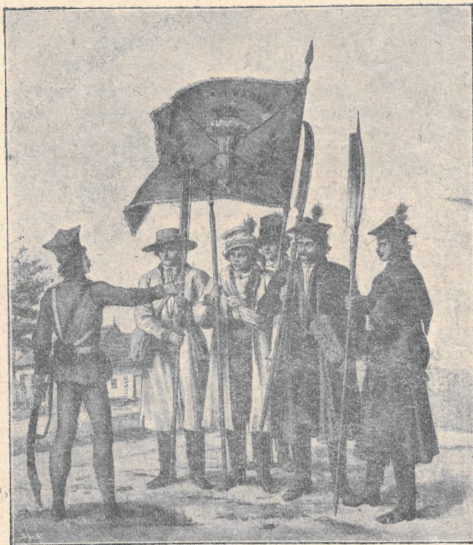
POLSKA W SYMBOLACH:

Aliści dnia pewnego w całym mieście od samego rana zapanowało poruszenie niezwykłe: nie-