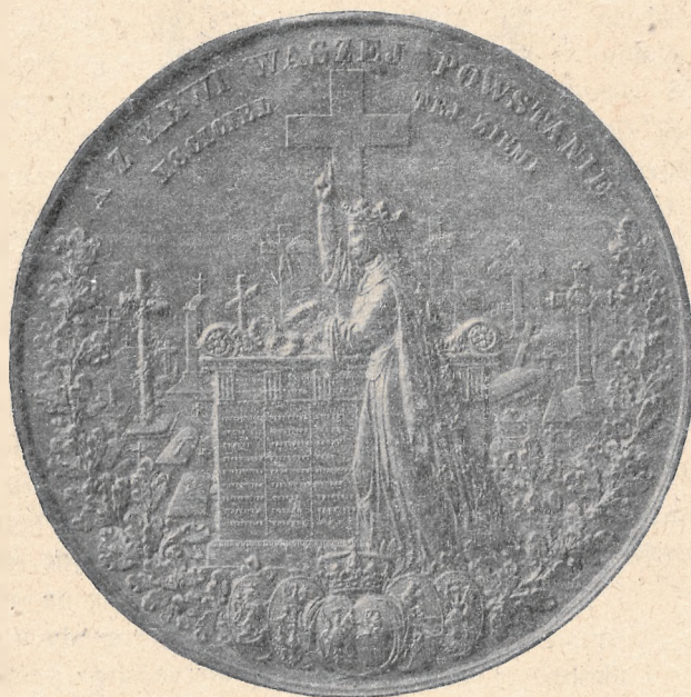
MEDAL na pamiątkę ofiar z lutego i kwietnia r. 1861 w Warszawie.

branych z różnorodnych pomników narodowego życia*). Nikt ich dotychczas nie zbierał, nikt żadnej całości nie złożył. I wiązanka niniejsza całością nie jest — bo z pośród symbolów typowych niesie ich