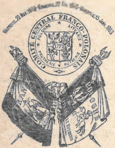
Z odezwy Komitetu polsko-francuskiego.

„Niechaj prawdziwy legion podchorążych otoczy ten święty sztandar, a wtedy dopiero będziemy śmieli powrócić na pole zbrojnego targu