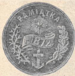
MEDAL na pamiątkę setnej rocznicy pierwszego rozbioru Polski.

na początku niniejszego artykułu, medalu: „z krwi waszej powstanie mściciel tej ziemi“.