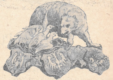
Alegoria z dzieła Kolumny: Pamiątka dla rodzin polskich.

śmierci bezbronnych i rozmodlonych tłumów na ulicach Warszawy. Godłem społeczeństwa polskiego stał się krzyż złamany, jakby wspomnieniem gwałtów, których się dopuszczali najeźdźcy w kościołach, serce przebite mieczem, a gorejące ofiarą i tą miłością, która ogarniała wszystkich żyjących na ziemi polskiej i stała się bujnym plonem styczniowych bojów — nadzieją wreszcie w kowicy i w tem samym przekonaniu, co na opisanym