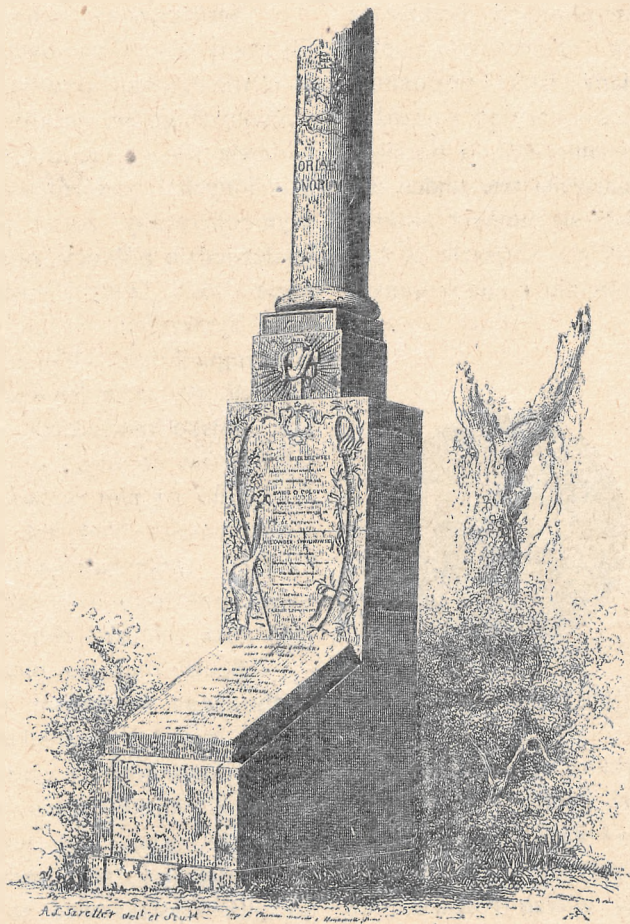
Pomnik zmarłych na obczyźnie. (Według rysunku Cyprjana Norwida).

miał ów pomnik, znajduje się już wyraz nastroju, który doprowadził do, żałoby narodowej i wybu-