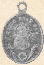
MEDALIK z r. 1861.