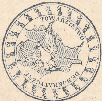
Pieczęć Towarzystwa demokratycznego.

z wrogiem o wydartą nam ziemię“ — czytamy w jednej z odezw Towarzystwa demokratycznego. Jakoż kładło ono podwaliny rozwoju i bytu narodowego, nie rezygnując z praw naszych nieprzedawnionych i ogarniając skrzydłami Orła polskiego całą ziemię polską, tak jak to wyrażono na pieczęci Towarzystwa, będącej jednym z najbardziej świa-