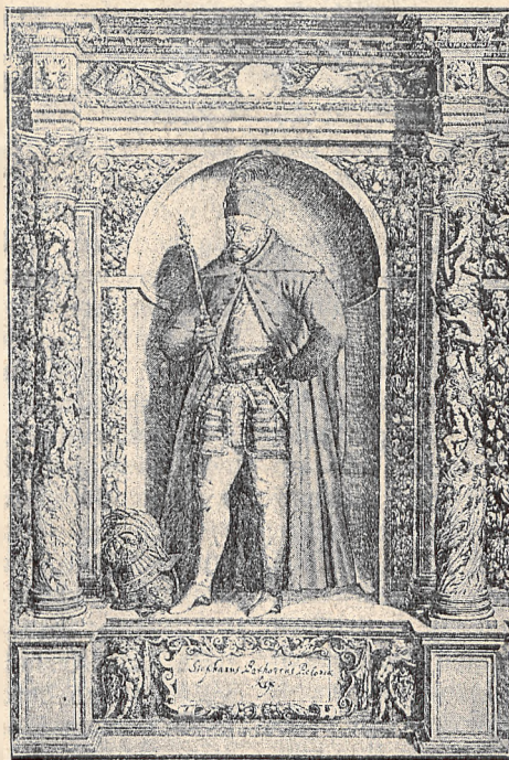
STEFAN BATORY (według sztychu Dominika Custosa.)

Arcydzieła te sztycharstwa są równocześnie