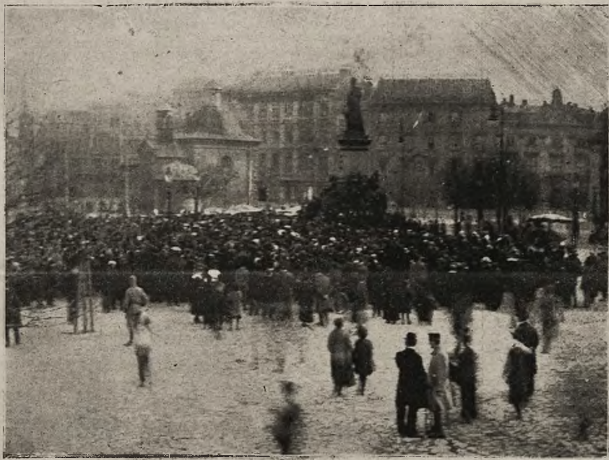
Manifestacje pokojowe w dniu 1. maja: Zgromadzenie pod pomnikiem Mickiewicza na Rynku w Krakowie