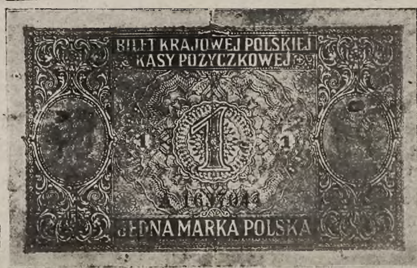
Banknoty Królestwa Polskiego. Marka polska.