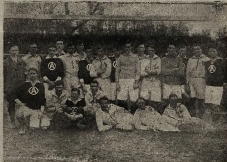
Sport w Legionach: Drużyna 5. p. p. Legionów polskich (biali) z reprezentacją akademików warszawskich (czarni). Na lewo sędzia z Warszawy, p. H. Jeziorowski, znany sportsman.