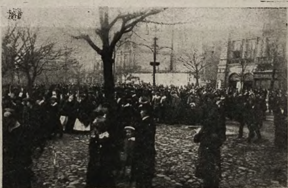
Manifestacje pokojowe w dniu 1. maja.