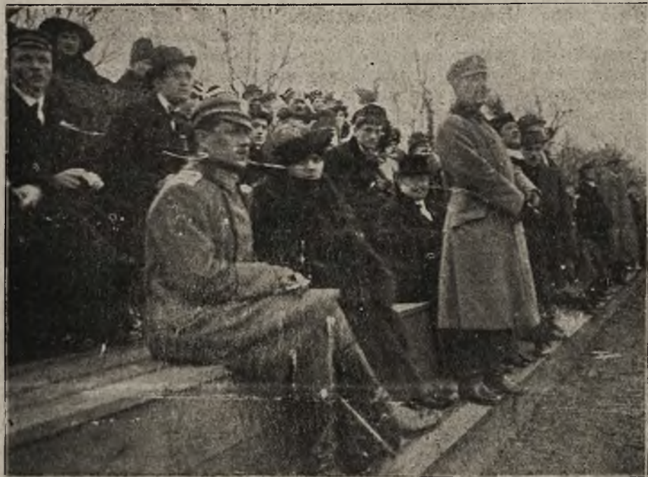
Widzowie na mat-hu footballowym Legionistów i akademików warszawskich. (X: Brygadyer Piłsudski.)