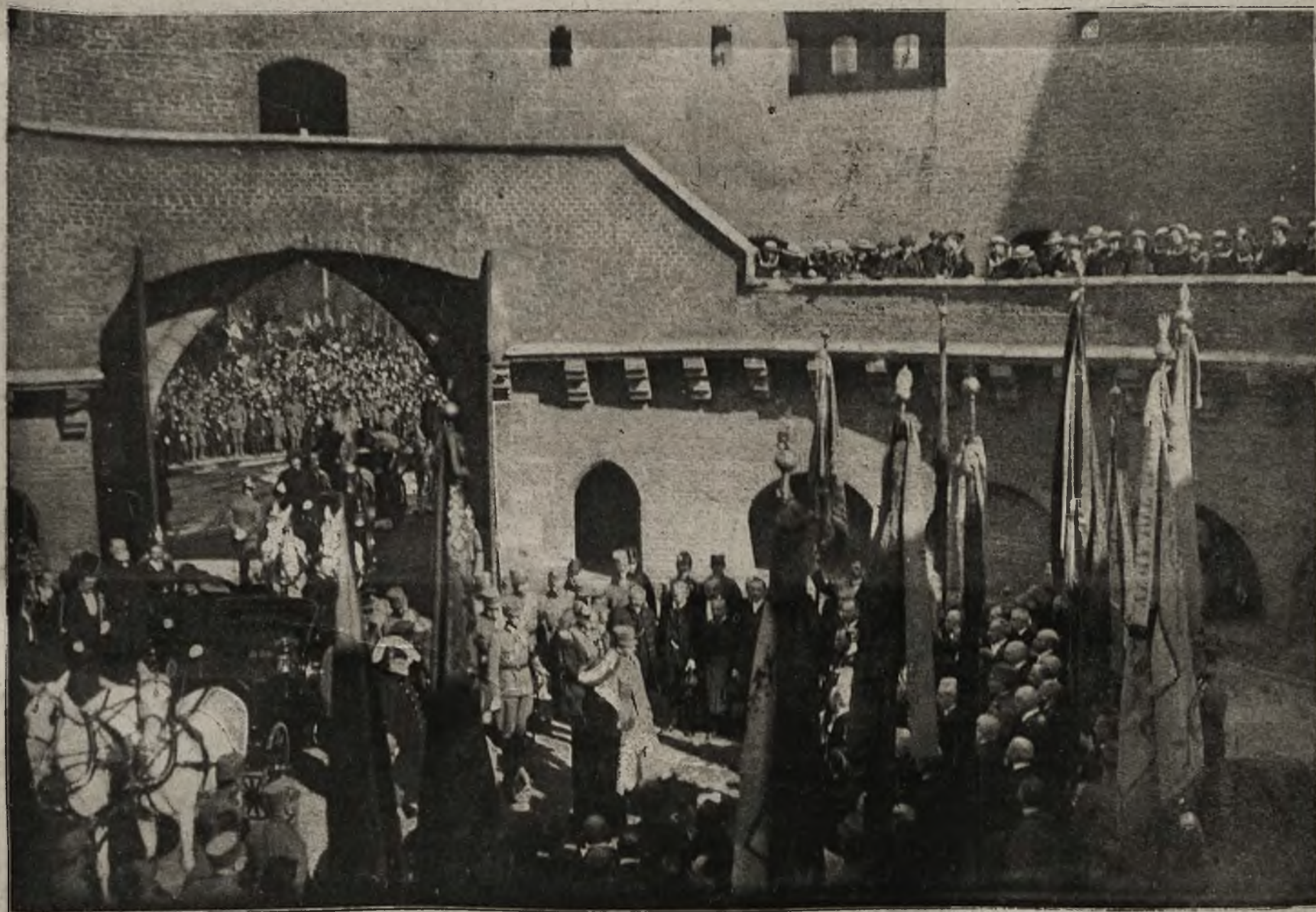
Powitanie pary cesarskiej w barbakanie.