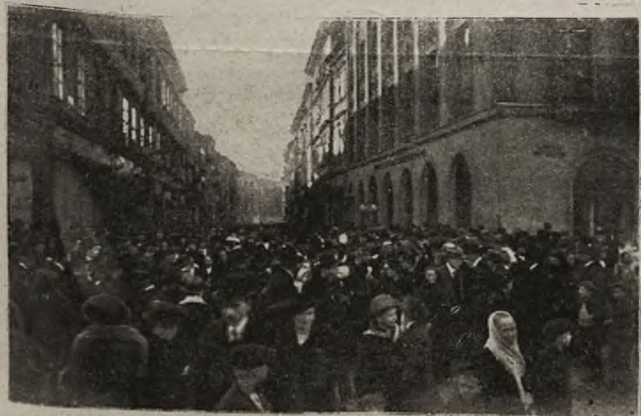
Pochód w ulicy Szewskiej w Krakowie.

Warunkiem zbratania i trwałą podstawą pokoju może być tylko wolność narodów, oparta na rządach