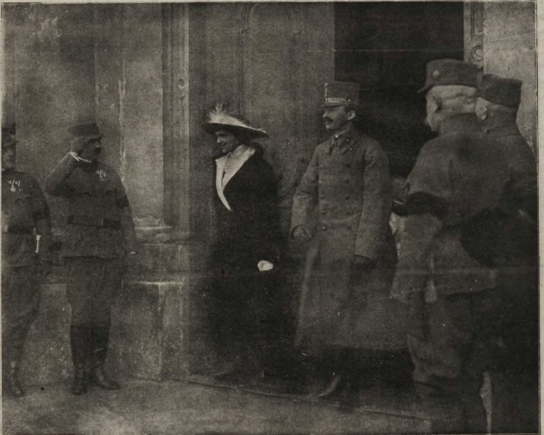
Para cesarska w Krakowie: Cesarz Karol i cesarzowa Zyta opuszczają kościół Maryacki.

Następnie, przez udekorowany salon restauracyjny pierwszej klasy udał się monarcha z małżonką na plac przed dworcem kolejowym, gdzie powitały ich niemiłkające okrzyki zebranej licznie młodzieży