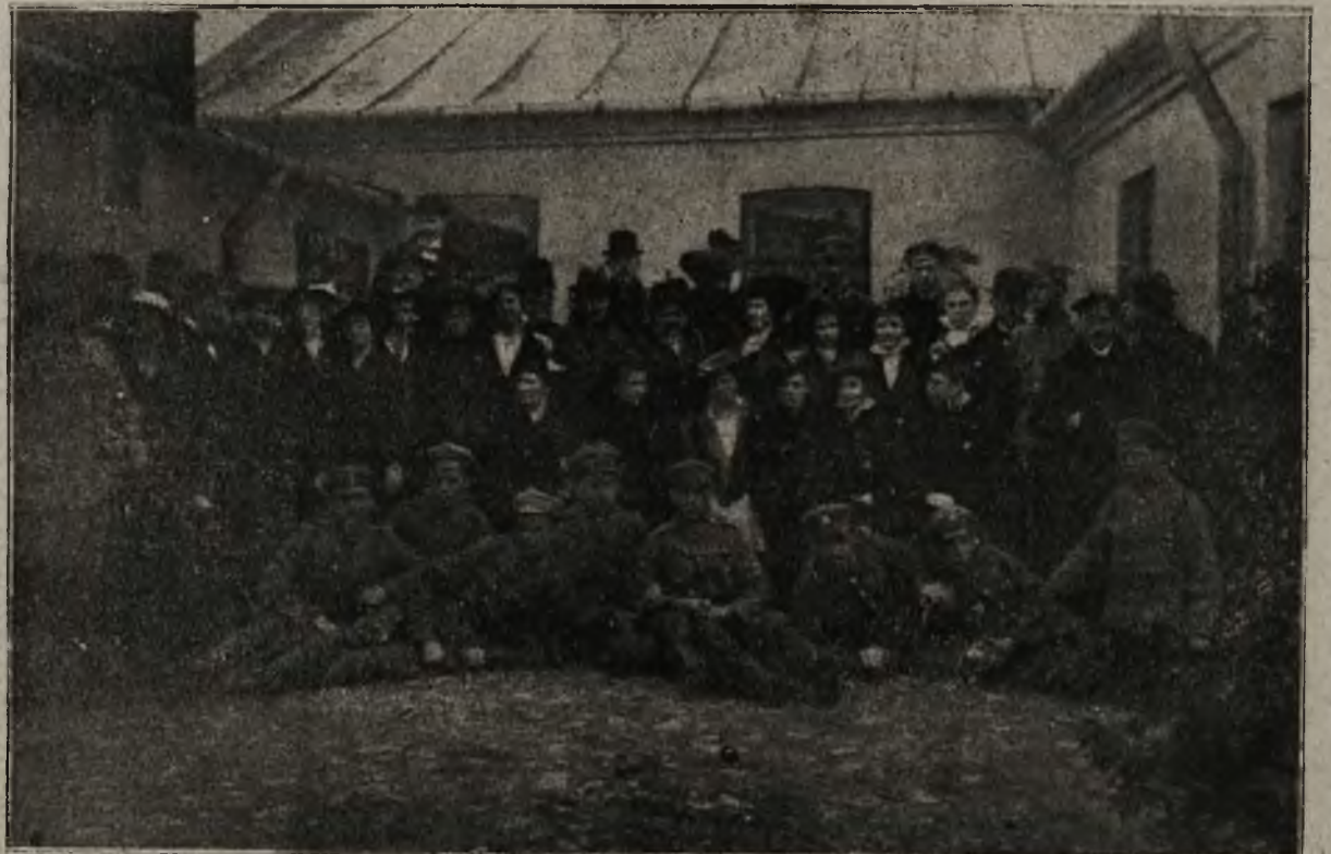
Z życia Legionów w Królestwie Polskiem: Poświęcenie gospody Legionistów w Końskich. Grupa uczestników uroczystości.