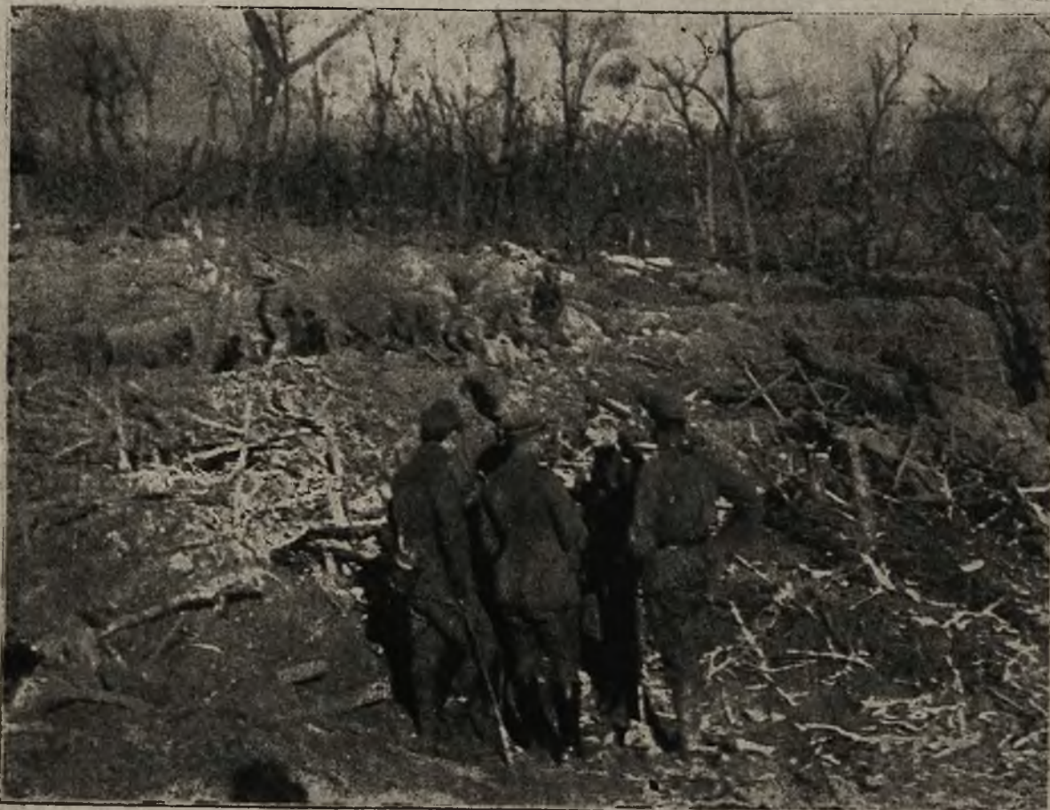
Wojska rosyjskie za pokojem: Wizyta rosyjskich oficerów.

„Teraz napiszę Wam w skróceniu, co się tu