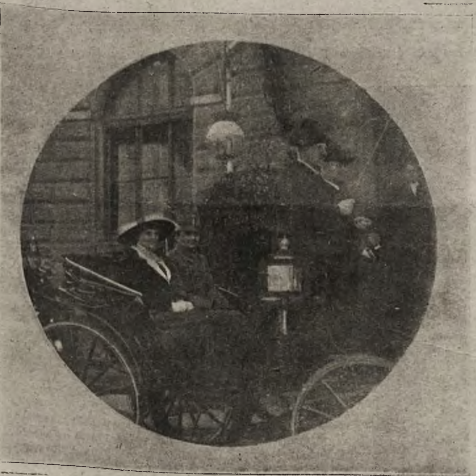
Odjazd pary cesarskiej z dworca kolejowego