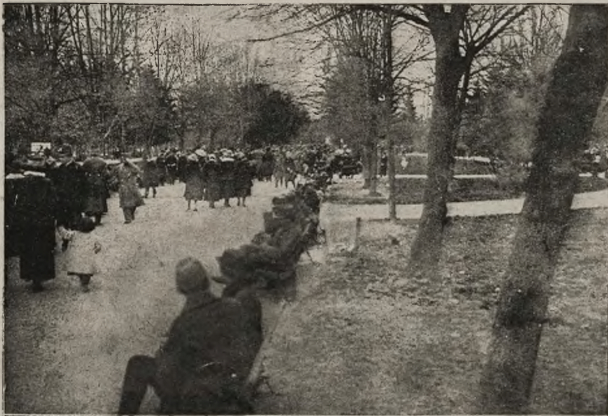
Trzeci maja w Krakowie: Festyn w parku Jordana.

„Z nadzwyczajną radością słyszę manifestację wypróbowanej uniżoności i przywiązania, które pan