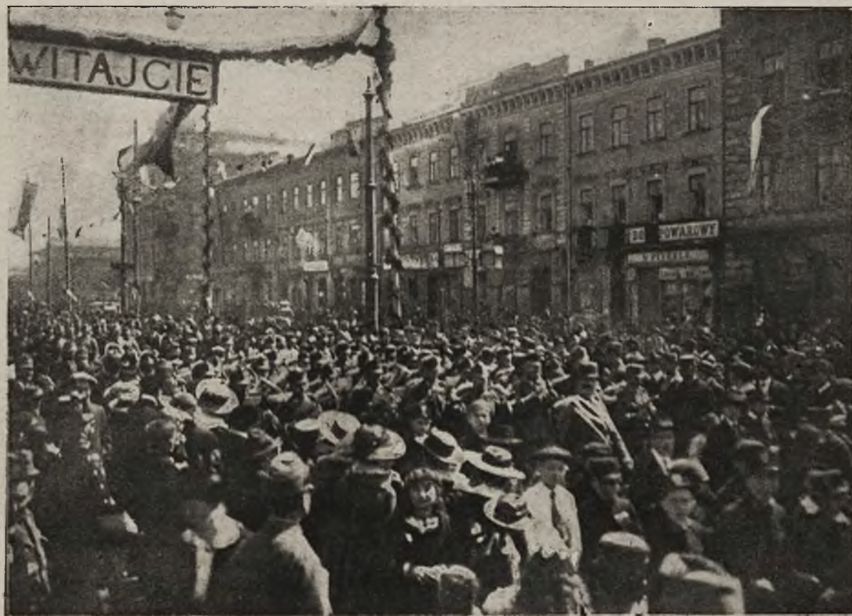
Para cesarska w Krakowie: Tłumy w ulicy Lubicz