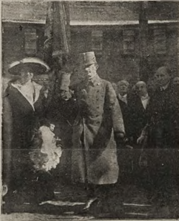
Para cesarska w Krakowie: Cesarz Karol i cesarzowa Zyta w barbakanie