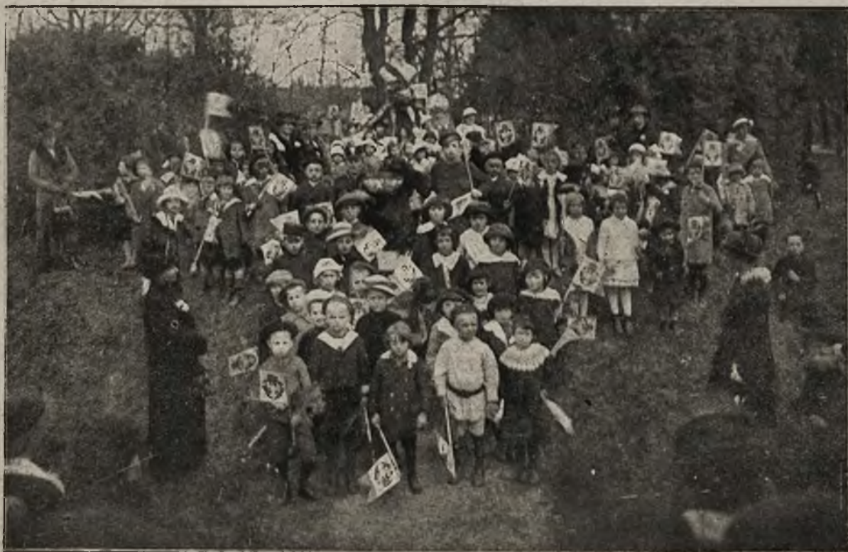
Trzeci maja w Krakowie: Pochód dziatwy pod pomniki twórców konstytucji na festynie w parku Jordana.

Po powrocie cesarzowej do gmachu starostwa, para cesarska pożegnała się z zebranymi, dziękując za serdeczne przyjęcie, poczem wśród grzmiących okrzyków odjechała przed godziną dwunastą w południe na dworzec.