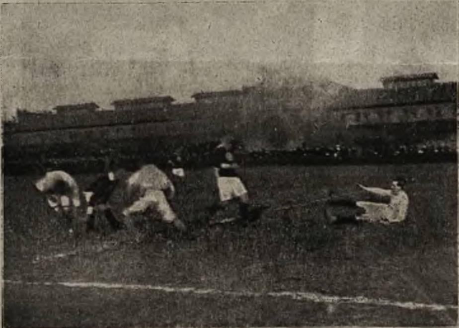
Match footballowy między drużyną sportową 5 p. p. a drużyną reprezentacyjną uniwersytetu i politechniki warszawskiej na boisku w „Agrikoli”.