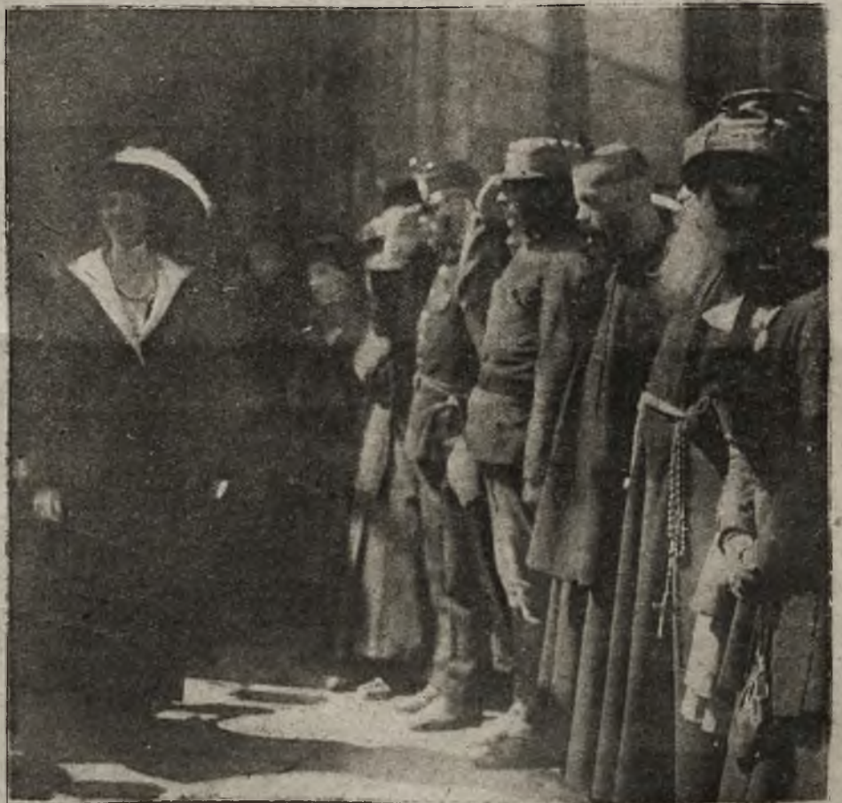
Para cesarska w Krakowie: