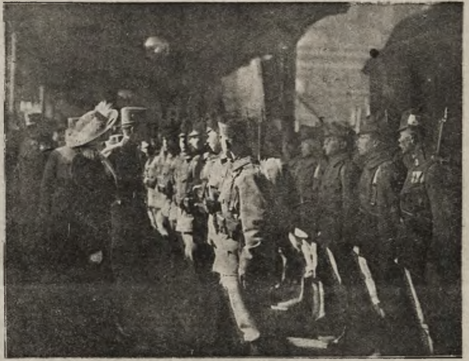
Arcyksiążę Karol Stefan (X) na dworcu, w oczekiwaniu na przyjazd pary cesarskiej.