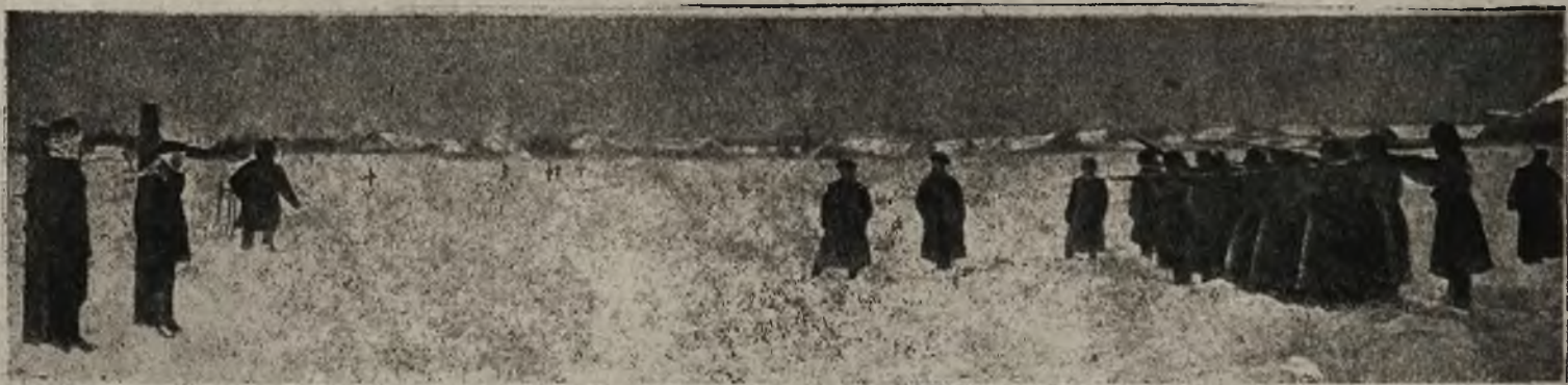
Echa gospodarki rosyjskiej w Galicji: Egzekucja skazanych na śmierć w sprawie o szpiegostwo

Szczególnie zażarta i uporczywa była w dniu 25. maja walka o wzgórze 652, które Włosi opanowali w godzinach wieczornych, ale w nocy, w walce wręcz, trwającej godzinami, zostali stamtąd z powrotem wyparci, pozostawiając setki zwłok.