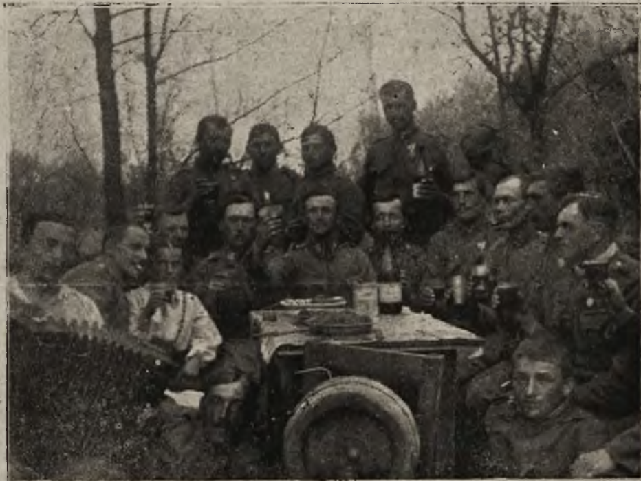
Z życia „krakowskich dzieci“ na froncie: