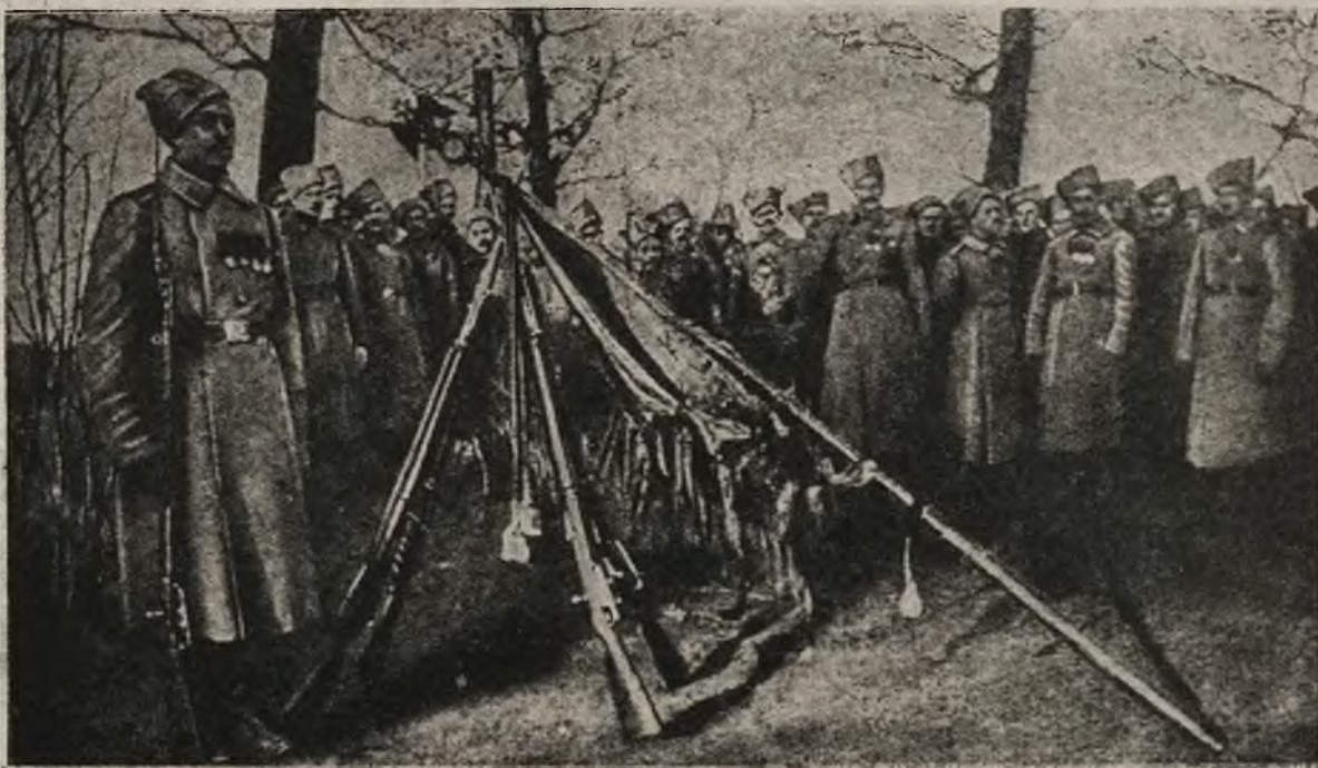
Rosja na przelomie: Gwardyjski pułk grenadierów składa przysięgę rewolucyjnemu rządowi.

Jeżeli subskrybujący zapłacił jedną, czy więcej