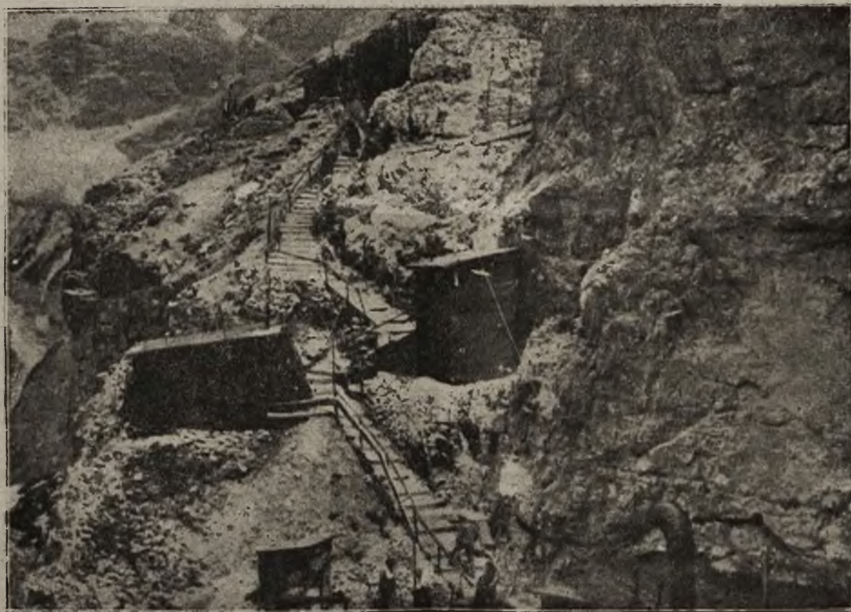
Nowa ofensywa włoska: Austriackie stanowisko na froncie południowo-zachodnim

Tuż przed północą, dnia 20 b. m. Poznańscy