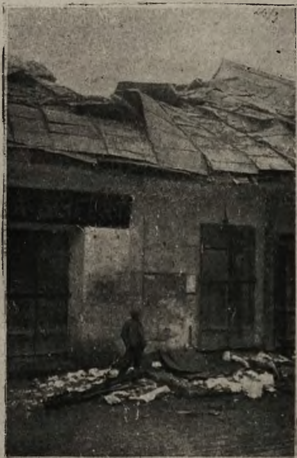
Z frontów bojowych: Uszkodzony pociskiem rosyjskim dom w Brzeżanach.