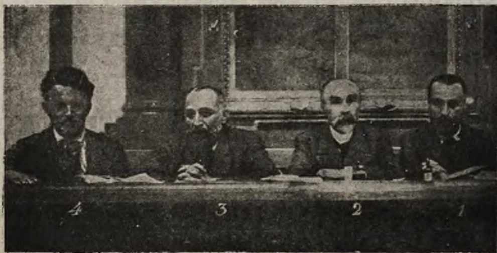
Rosja na przelomie: Prezydym Rady robotniczo-żołnierskiej. 1. Cereteki. 2. Plechanow. 3. Czheidze. 4. Skobie'ew.

W roku 1866 wybrany po raz pierwszy do Rady miasta Krakowa, pozostał jej członkiem aż do roku 1905. Pracował we wszystkich najważniejszych sekcjach i komisjach, jak restauracji Sukiennic i wodociągowej; teatr miejski i wodociągi zbudowano pod jego rządami. Był referentem komisji dla plan-