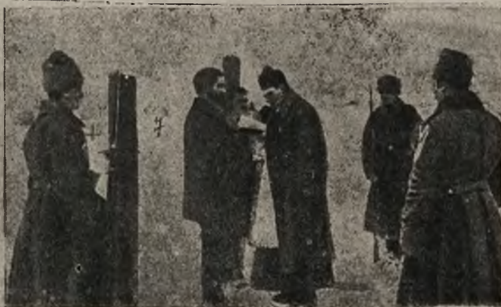
Echa gospodarki rosyjskiej w Galicji:

Odczytanie wyroku śmierci na miejscach kaźni.