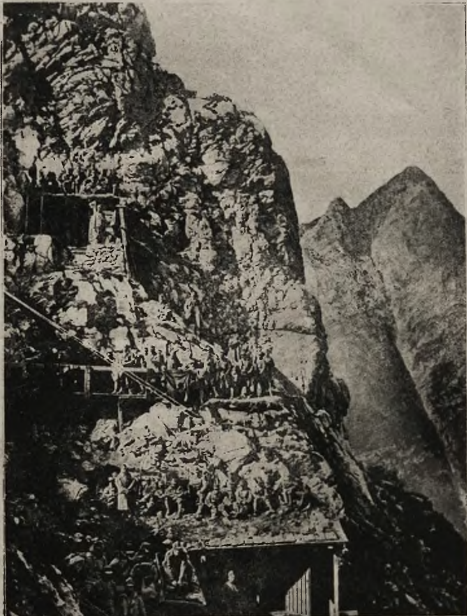
Schroniska wojsk austriackich na zboczu skalnym południowego frontu