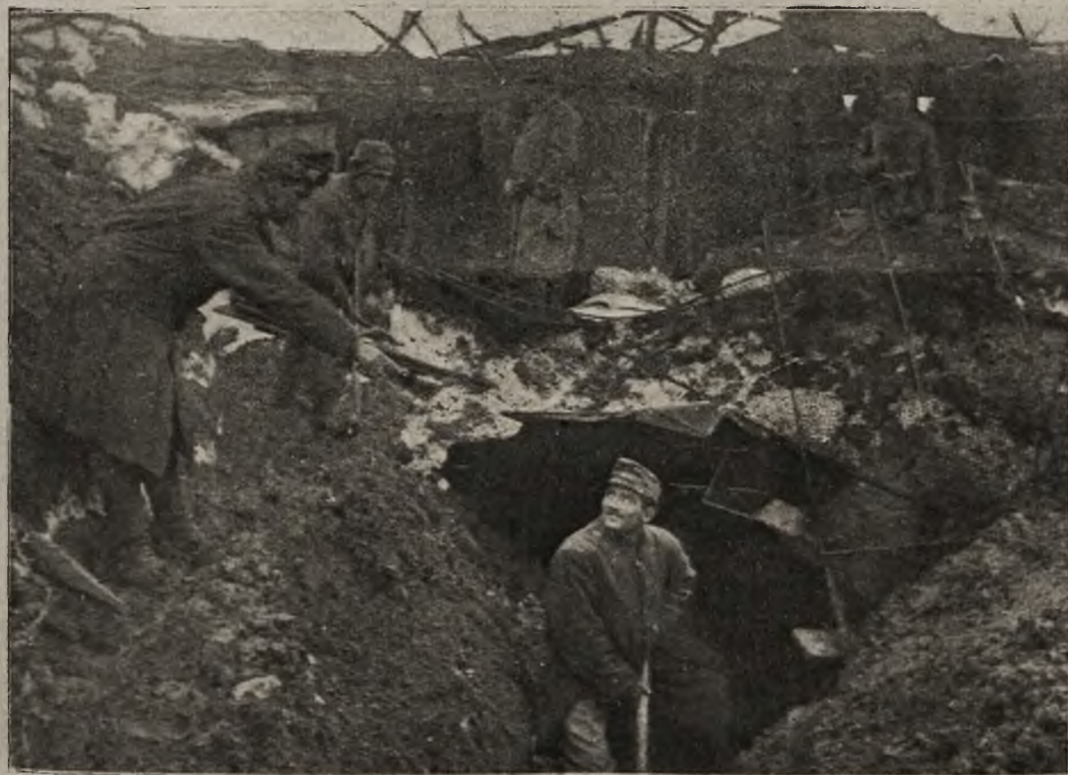
Z życia „krakowskich dniesci“ na froncie: „Trzynastacy“ przy pracy w okopach.