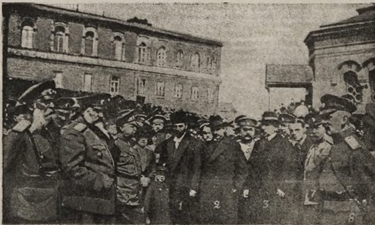
Rosja na przelomie: Uroczystość proklamowania nowego rządu w Tyflisie, w obecności przedstawicieli władz miejscowych i komendantów garnizonu.

Pierwszy rząd tymczasowy, reprezentujący w gabinecie, z wyjątkiem jednego Kierenskiego, wyłącznie burżuazję, musiał odejść po krótkim żywocie. Żywot ten wypełniony był przeważnie zmaganiem się z trudnościami, wytwarzanymi przez wystąpienia Rady robotniczo-żołnierskiej, znajdującej