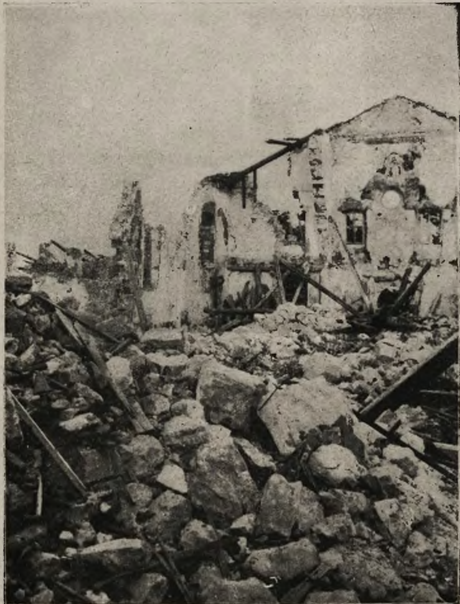
Rniny zniszczonego przez Włochów klasztoru na Monte Santo pod Gorycyą.

Te czynniki właśnie i żywiły, oczywiście w nowym rządzie nie reprezentowane, wywierały z zewnątrz nacisk na radę robotniczo-żołnierską, zmuszając ją do wystąpień, paraliżujących kroki dawnego rządu tymczasowego. Na czele jednej ich części stoi namiętny i ruchliwy agitator Lenin, gwałtowny i nie