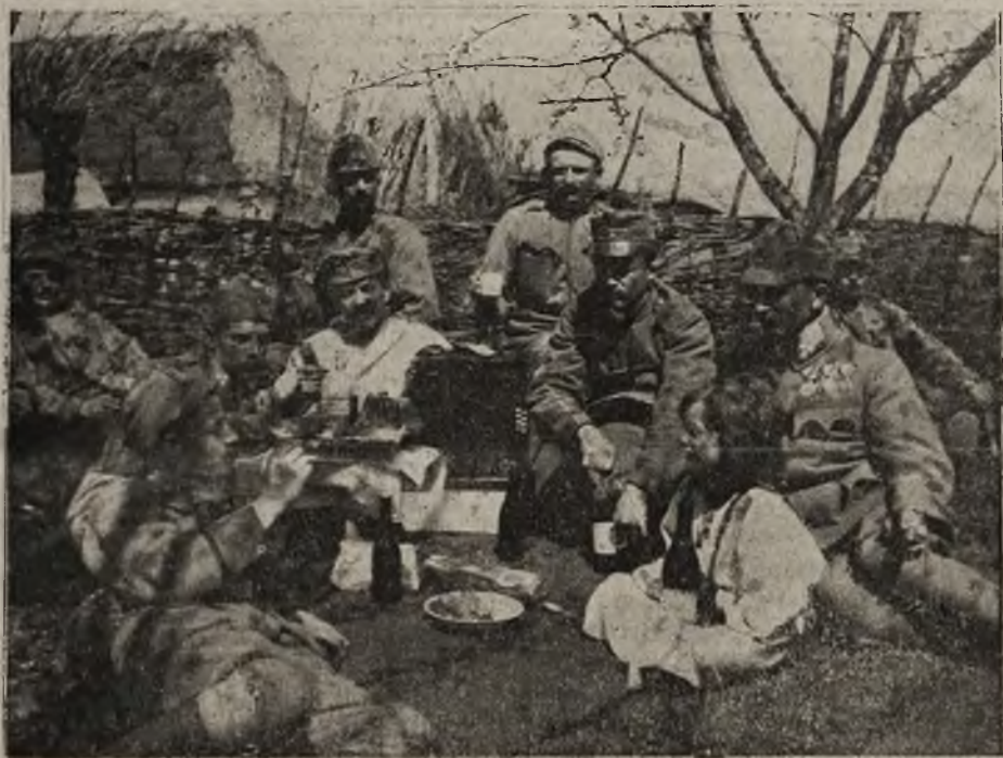
Mały gość na wizycie u „trzynastaków“.

do niewoli dwóch oficerów i czterdziestu trzech żołnierzy, jakoteż zagarnęli trzy karabiny maszynowe.