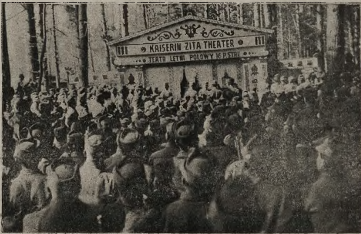
Z życia „krakowskich dzieci” na froncie: Widzowie na inauguracyjnym przedstawieniu w letnim Teatrze polowym 16 p. p. obrony krajowej.

Głośny już się stał „Teatr polowy” 16 pułku obrony krajowej na froncie, niewątpliwie jedyny w obecnej wojnie światowej... Poprzednie informacje i fotografie z tego teatru uzupełniane obecnie nowymi, które świadczą o ciągłym rozwoju tej niezwykłej sceny. Dwie zamieszczone fotografie przed stawiają mianowicie świeżo wzniesiony letni budynek teatru, którego poświęcenie odbyło się niedawno. Uroczystość tę widzimy właśnie na jednej fotografii. Na drugiej fotografii widzimy widzów na inaugura-