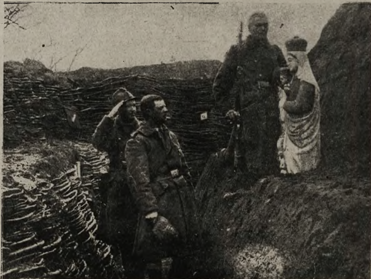
Nowa ofenzywa włoaka: Statua Matki Boskiej, słynąca cudami, w austriackim rowie strzeleckim na południowo-zachodnim froncie