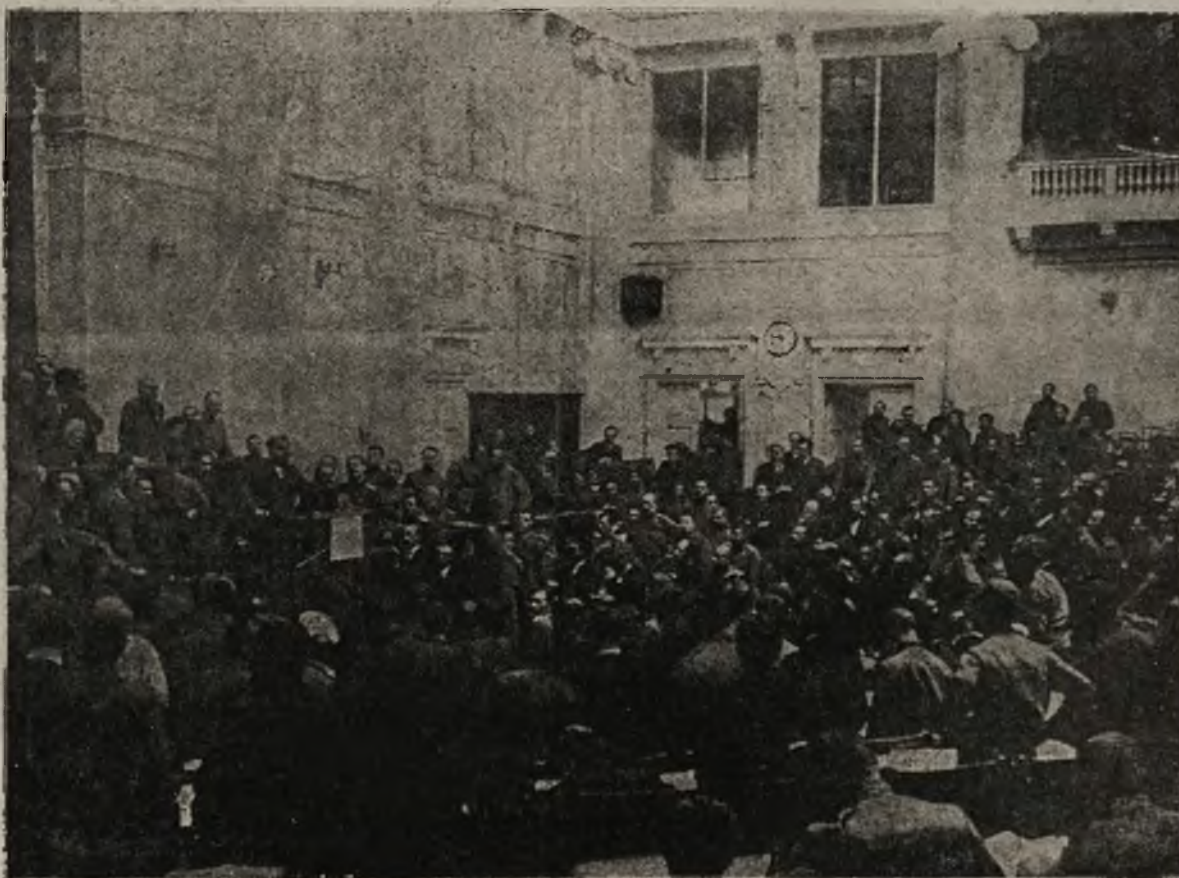
Rosja na przelomie: Posiedzenie Rady robotniczo-żołnierskiej w gmachu Dumy (w pałacu Tanzydskim).

Kto chce więc spełnić swój obowiązek, przytem oszczędności swe dobrze i pewnie umieścić, a swych najbliższych zaopatrzyć — niechaj natychmiast skorzysta z instytucji ubezpieczenia w pożyczce wojennej. — Zgłoszenia przyjmuje się we wszystkich c. k. Starostwach, c. k. Urzędach podatkowych, Urzędach gminnych i parafialnych, jakoteż w Filii krajowej c. k. austr. wojsk. Funduszu wdów i sierót (dział ubezpieczeń) w Krakowie, ul. Floryańska 35, która też na żądanie udziela wyjaśnień i przesyła druki.