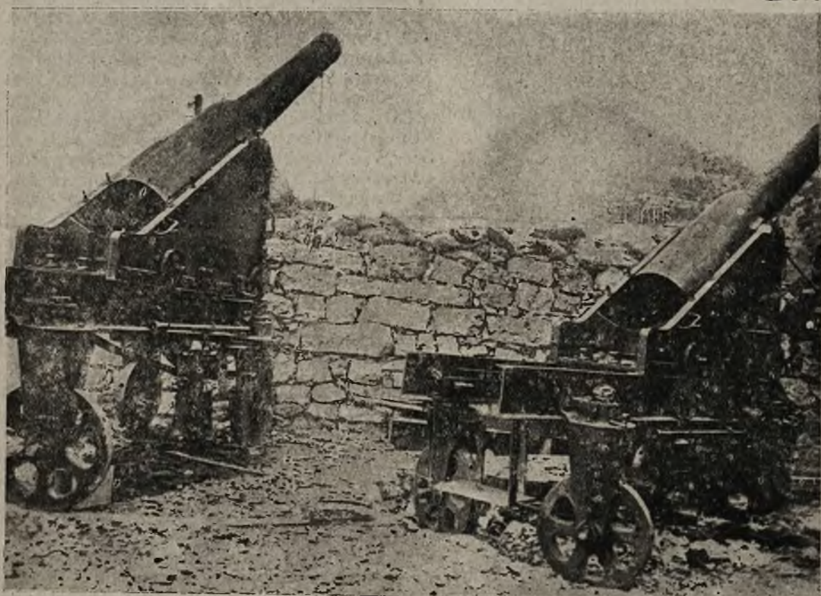
Nowa ofensywa włoska: Pozycja austriackiej artylerii w odcinku Isonza