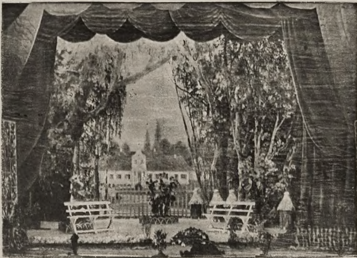
Ze sceny i estrady: Oryginalna dekoracja do „Pana Jowialskiego”, zbudowana na wglębinie orkiestrowej.

Zdaje się, że przed dojściem z Rosją do osta-