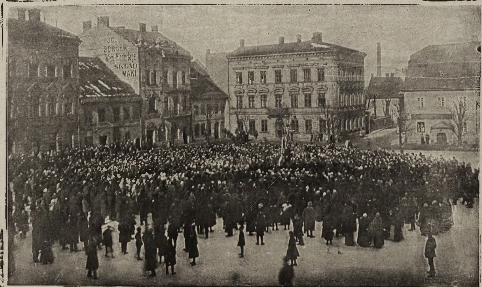
Protest Galicyj: Manifestacja w dniu 18 lutego w Białej.

Z tego ostatniego escapu Legionów polskich na froncie bukowińskim zamieszczamy w dzisiejszym numerze nadesłaną nam świeżo z wojennej kwatery prasowej fotografię, przedstawiającą przegląd Legionów przez cesarza Karola. Nadto podajemy podobizny przebywających przy karpackiej