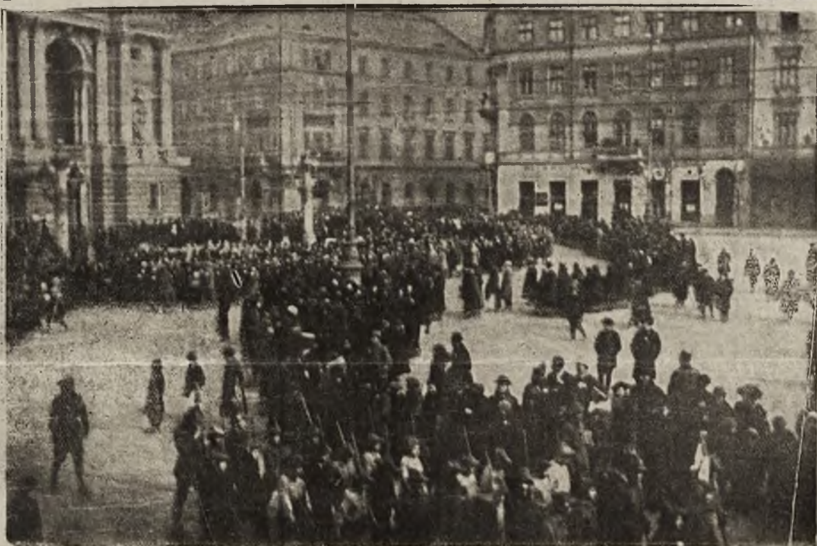
Protest Galicyi: Dzień protestu we Lwowie. Skautki i skautki w pochodzie przed teatrem miejskim.

Praca w warsztatach ustała, a ruch kolejowy wstrzymano. Na stacji kolejowej stały tylko próżne wozy. Już w pierwszych godzinach przedpołudniowych