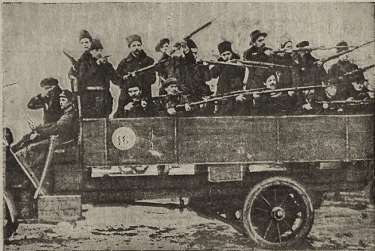
Rządy bolszewiokie w Finlandyi: Czerwona gwardya w walce na automobilu

narodów...“ Niestety i tu okazało się, jak daleko od pięknych słów do rzeczywistości. Rząd bolszewicki zgodził się wprawdzie w teorii na samodzielność Finlandyi, rozumie ją jednak po swojemu, t. j. że ta samodzielność ma być konieczną bolszewicką anarchią. A ponieważ Finlandya nie posiada własnej siły zbrojnej, więc rosyjskie bandy bolszewickie mogły tam bezkarnie rozpocząć gospodarkę, naturalnie pod hasłem „wolności“... Zorganizowano tam miejscową czerwoną gwardję, która przy pomocy oddanych bolszewikom wojsk rosyjskich, wypędziła rząd fiński.