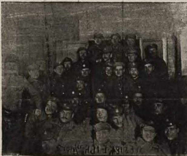
Legiony na Bukewinie: Grupa internowanych Legionistów w Kolomyi.