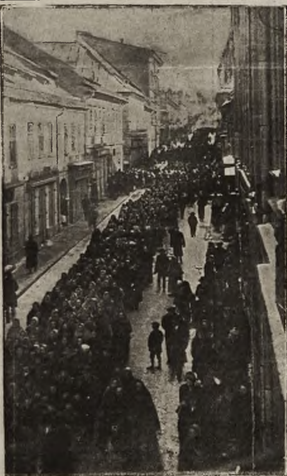
Protest Galicyi: Fragment pochodu manifestacyjnego w Białej

O godzinie 5 tej przed południem poczęły na-