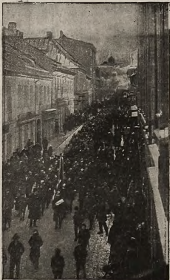
Protest Galicyi: Pochód manifestacyjny w d 18 Intero w Białej.

Wzywamy wszystkich Polaków do spokoju, rozważli, cierpliwości postępowania solidarnego; potępiamy natomiast wszelkie lżenie, a szkodliwe przedsięwzięcia, które mogą być wywołane na naszą niekorzyść przez prowokatorów“.