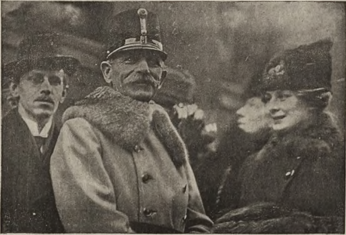
Powrót obrońcy Przemysła: Powitanie gen. Kusmanka na dworcu w Wiedniu.