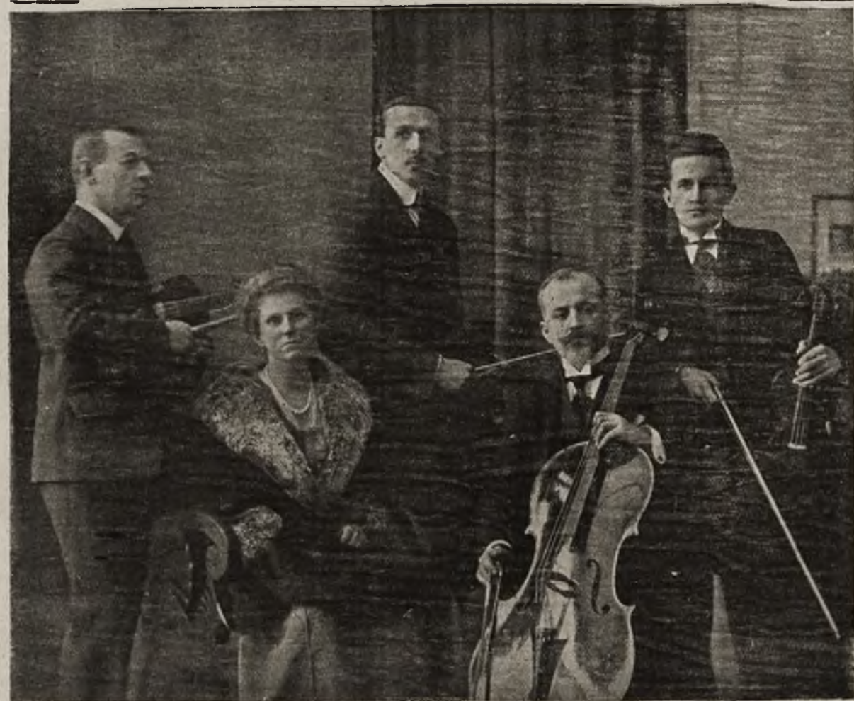
Ze sceny i estrady: Krakowski zespół kameralny.