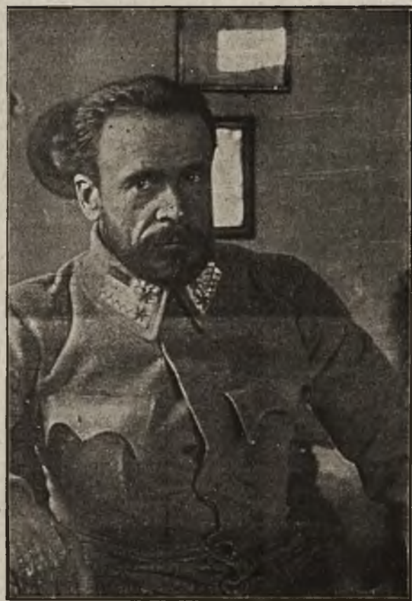
Legiony na Bukowinie: Brygadyer Józef Haller.

Po trzyletniej przeszło kampanii bojowej przyszyły niedawno Legiony na poprzednie szlaki swych bohaterskich zapasów z wrogiem — na front bukowiński, tak świetnie zapisany w dziejach polskiego oręża.. Zmienne koleje losu zmniejszyły znacznie ich liczbę. Część Legionistów pozostała w Król. Polkiem, część wstąpiła do c. k. armii, znalazła się jednak na Bukowinie wytrwała „karpacka brygada“, złożona z dwóch pułków piechoty (2 i 3),