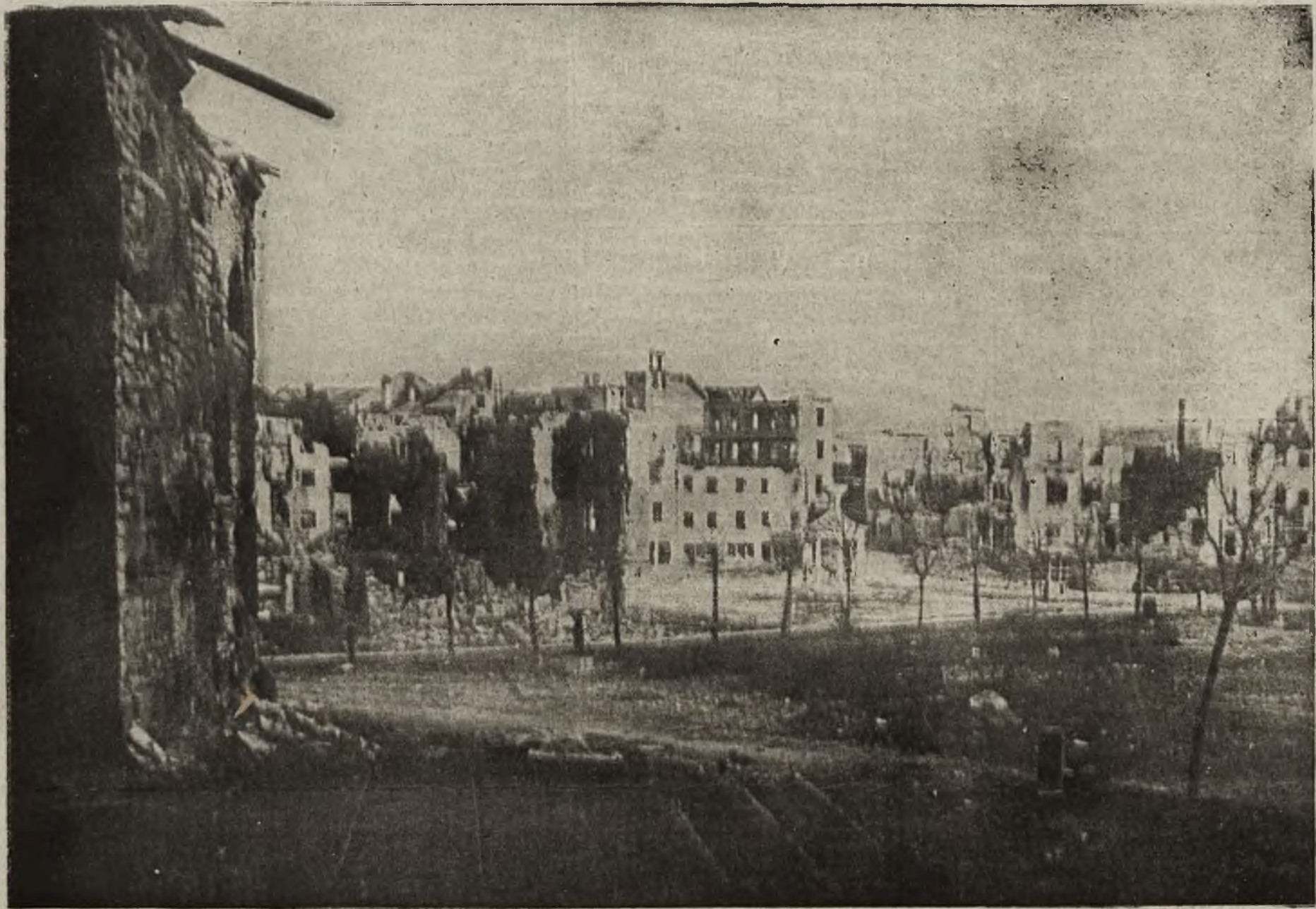
Z frontów bojowych: Ogólny widok zniszczonej miejscowości Asiago w północnych Włoszech.

to ogonek ziemniaczany. Jak widzimy więc, ogonki wojenne w swym zwyczajnym pochodzie zawędrowały nawet do Londynu, co pozwala przypuszczać, że zdobyły już one prawo obywatelstwa we wszystkich państwach prowadzących wojnę. W ten sposób odniosły zwycięstwo po obu stronach frontu.