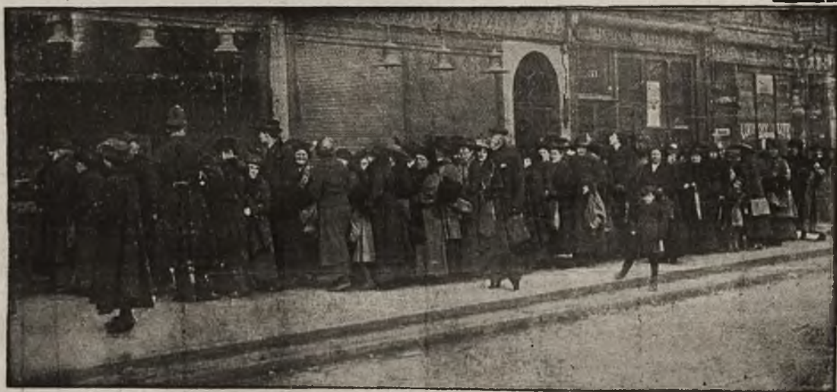
Tak, jak i u nas: Ogonek ziemniaczany w Londynie.