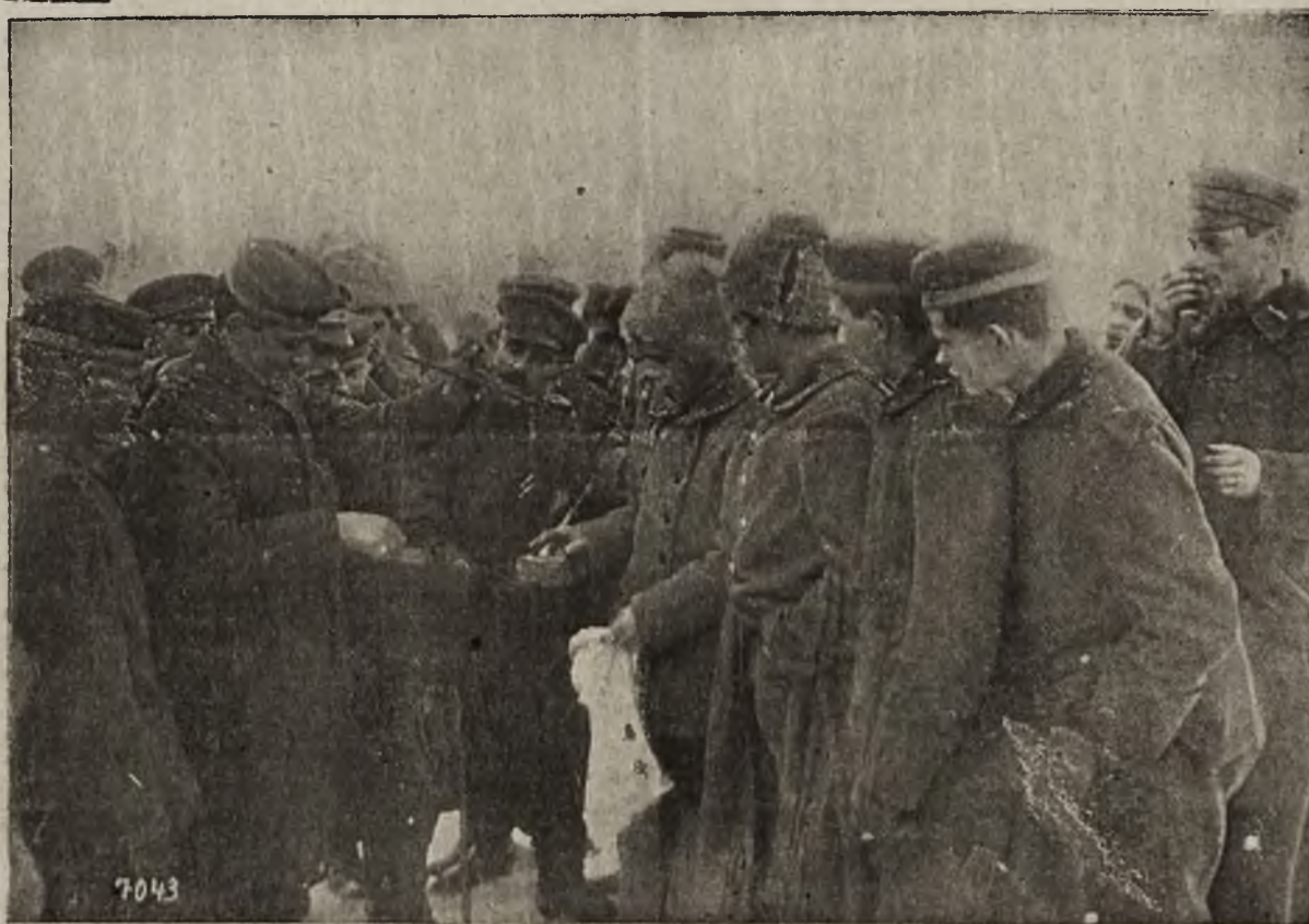
Kapitulacja bolszewików: Niegroźne spotkanie nieprzyjaciół (zamienny handel w czasie zawieszenia broni)

Zastrzeżenie to jest tembardziej zrozumiałe, że rząd niemiecki postanowił wystąpić z nowymi żądaniem, domagającym się o różnienia przez Rosję Kurlandyi i Estonii, oświadczając jednocześnie, że do póki pokój nie zostanie zawarty — nie powstrzyma kroków wojennych. P mimo więc zupełnej kapitulacji bolszewików, skńczyły się tak miedzywojsk bolszewickich wywczas i zabawy na froncie. Gdy wewnątrz państwa wojska te muszą staczać ciągle walki z „wewnętrznyimi wrogami“ — w rowach strzeleckich, w obliczu nieprzyjaciela, najlepiej im się działa... Nic też dziwnego że bolszewicy nie mają bynajmniej ochoty do walki i cofają się przed postępującą armią niemiecką bez oporu — czekając niewątpliwie z upragnieniem chwili, gdy znowu będą mogli spotkać się z nieprzyjacielem, naturalnie nie z bronią w rękę, ale w tak miłej, pokojowej zgodzie, jak to widzimy na naszych fotografiach.