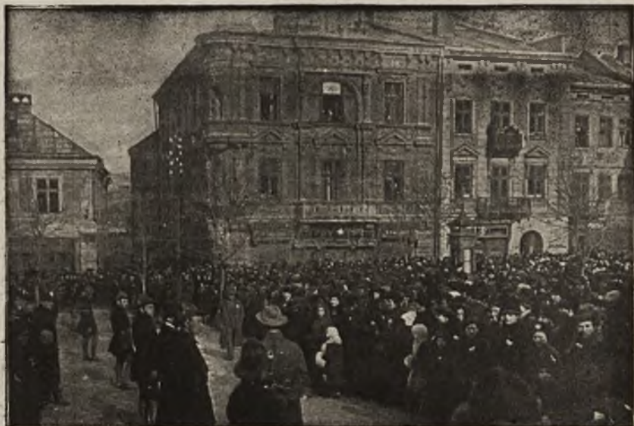
Protest Galicyi: Dzień protestu w Przemyślu.

Wszędzie uchwalono równobrzmiące rezolucje protestujące.