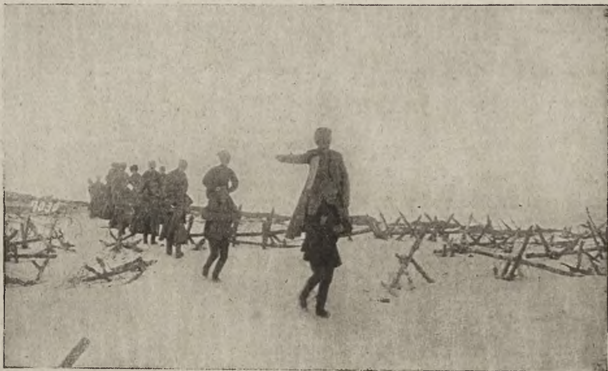
Kapitałowa bolszewików: „Kawalery“ bolszewicka na pozycjach pod Dźwinskiem

Zdawało się, że po upadku caratu wyswobodzona od czynowników Finlandya stanie się naprawdę krajem wolnym, w myśl głoszonego przez obecny rząd rosyjski hasła o „samopostanawianiu