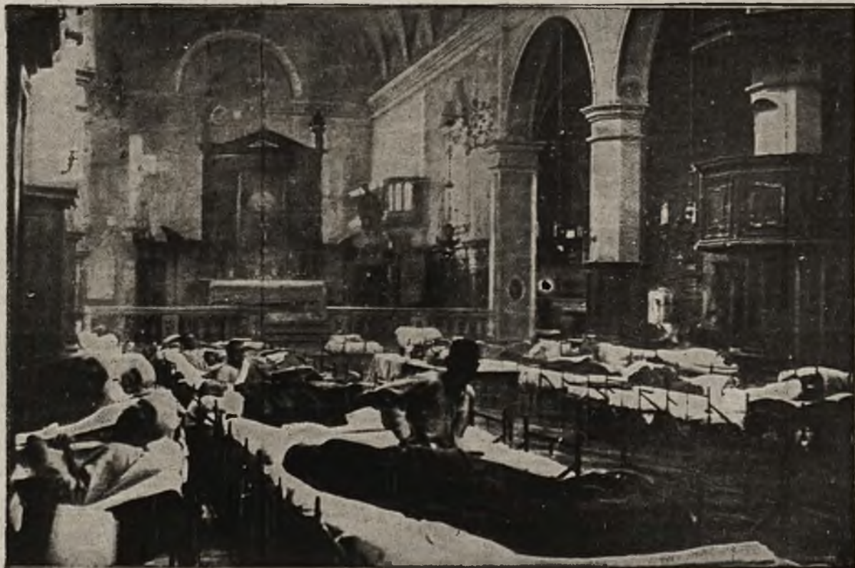
Z frontów bojowych: Austriacki szpital w jednym z kościołów włoskich.