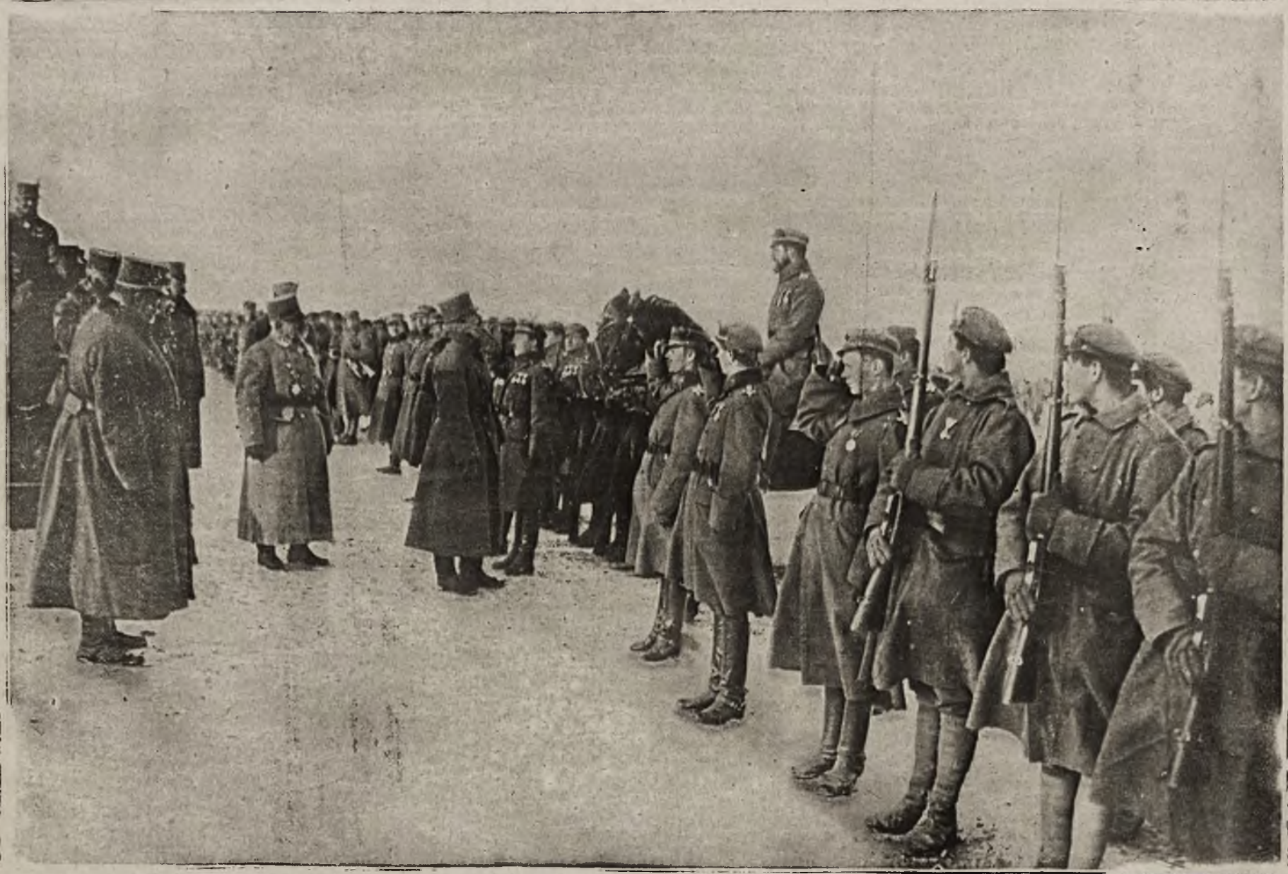
przeгляд Legionów przez cesarza Karola.