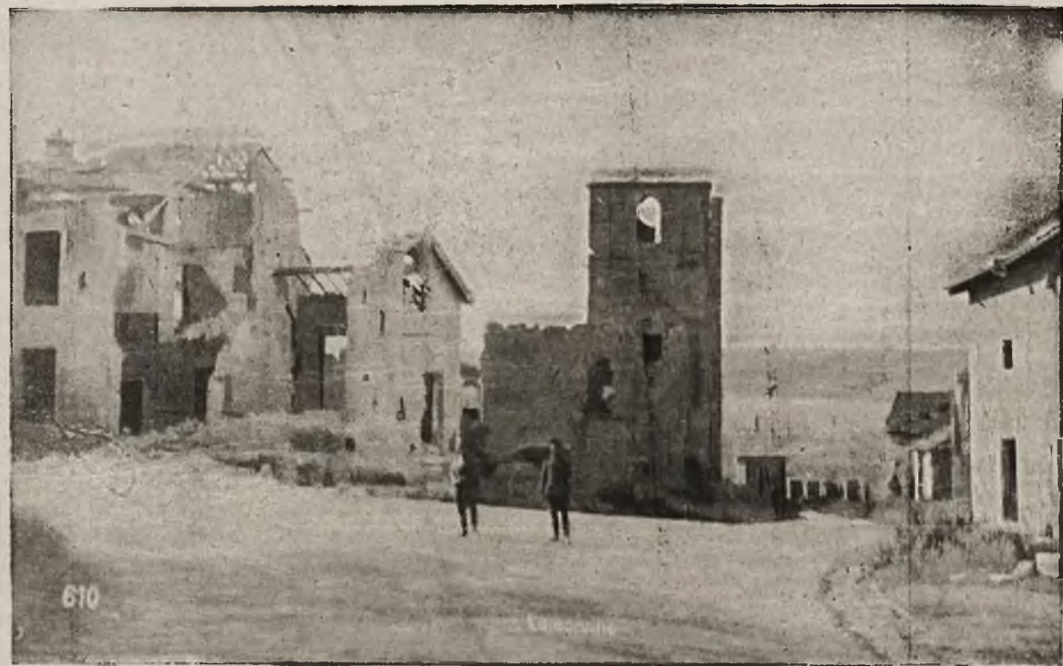
Z frontów bojowych: Ruiny miejscowości Lamerville obok St. Mihiel na zachodnim froncie.