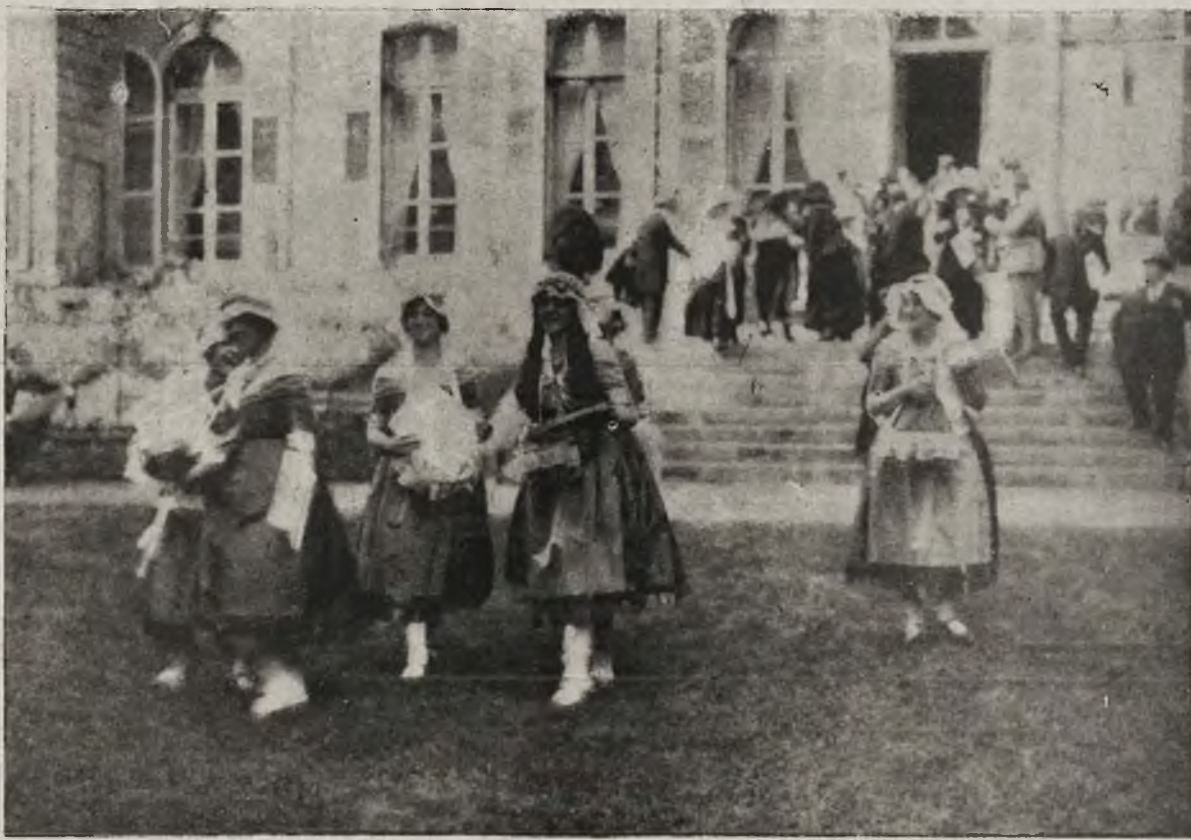
Dzień polski w Paryżu: Kolekta na Polski Czerwony Krzyż w ogrodzie księżnej Dondeauville.

Poczem szeroką falą popłynęła pieśń przysięgi: „Nie rzucim ziemi...“