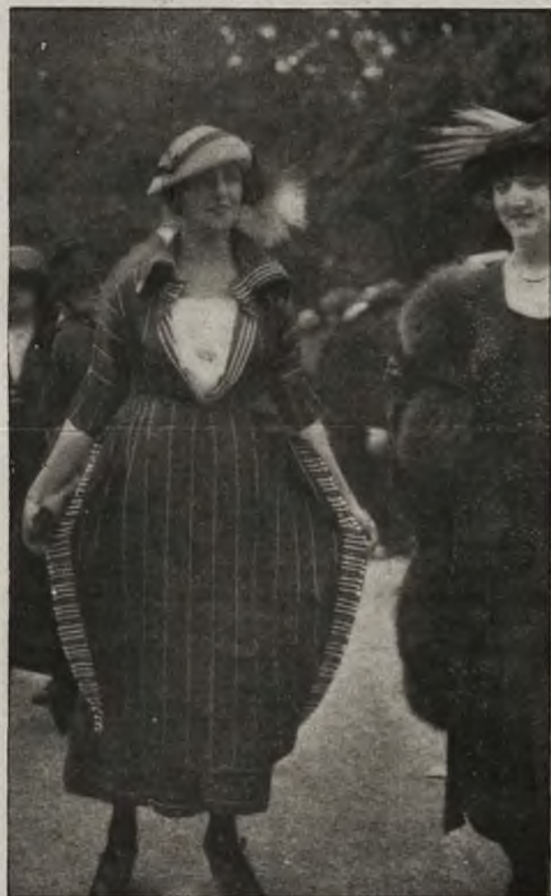
Mody paryskie: Najnowszy model sukni.