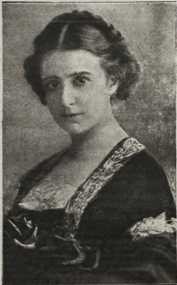
Rita Sacchetto, światowa tancerka.

W poniedziałek 28. b. m. wystąpi w teatrze powszechnym w Krakowie rozgłośna tancerka Rita