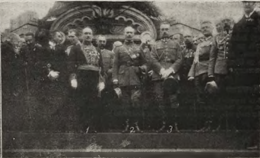
Minister wojny gen. Leśniewski odbiera raport od oficera francuskiego. Vive la France! U stóp pomnika. 1) Ambasador Fracon, 2) gen. Henrys, 3) gen. Sosnkowski.

stopnia najbardziej prymitywnego pojęcia. Fakta powoli się gromadzą i mają w niedalekiej przyszłości stanowić materiał do rozstrzygnięcia spornej kwestyi na wschodzie. Dziś jednak o tem musi się chwilowo nie myśleć, ale należy cieszyć, że wreszcie stajemy na linii Zbrucza, dzięki waleczności i zdrowemu duchowi naszego wojska, które tyle