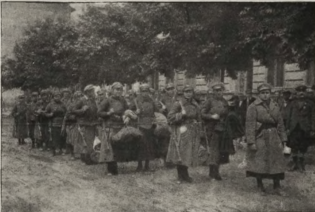
Stanisławowska ochotnicza legia kobieca.

trudów położyło, aby znękanej Galicyi wschodniej dać wolność. Szybkie tempo ofensywy świadczy do wrodnie o zrozumieniu ważności sprawy i dobrem przeświadczeniu, że ta ziemia, którą się obecnie broni, stanowi bezwarunkowo dla naszego intensywnego życia wielkiej wagi placówką, której za żadną cenę oddać nie możemy i niewolno nam. Zresztą decyzya już się szybko zbliża, oczekujemy