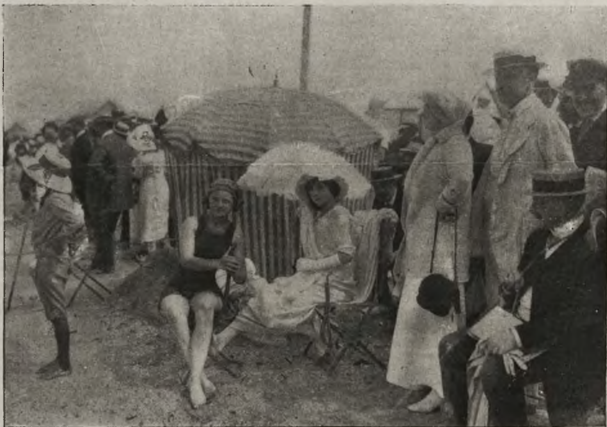
Mody paryskie: Stroje kąpielowe w Biarritz.

Uczucie, które przepełniało wszystkich widzów w obliczu tej rewii, da się streścić w słowach: Cześć żołnierzowi polskiemu!