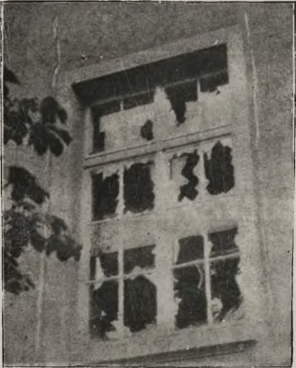
Jedno z wielu rozbitych okien w budynku sądowym.

Dnia 13-go czerwca b. r. przyszło w Zurychu do krwawych zaburzeń przed budynkiem sądu okręgowego. Tam uzbrojony w broń i granaty wdarł się do wnętrza budynku i zdemolował go.