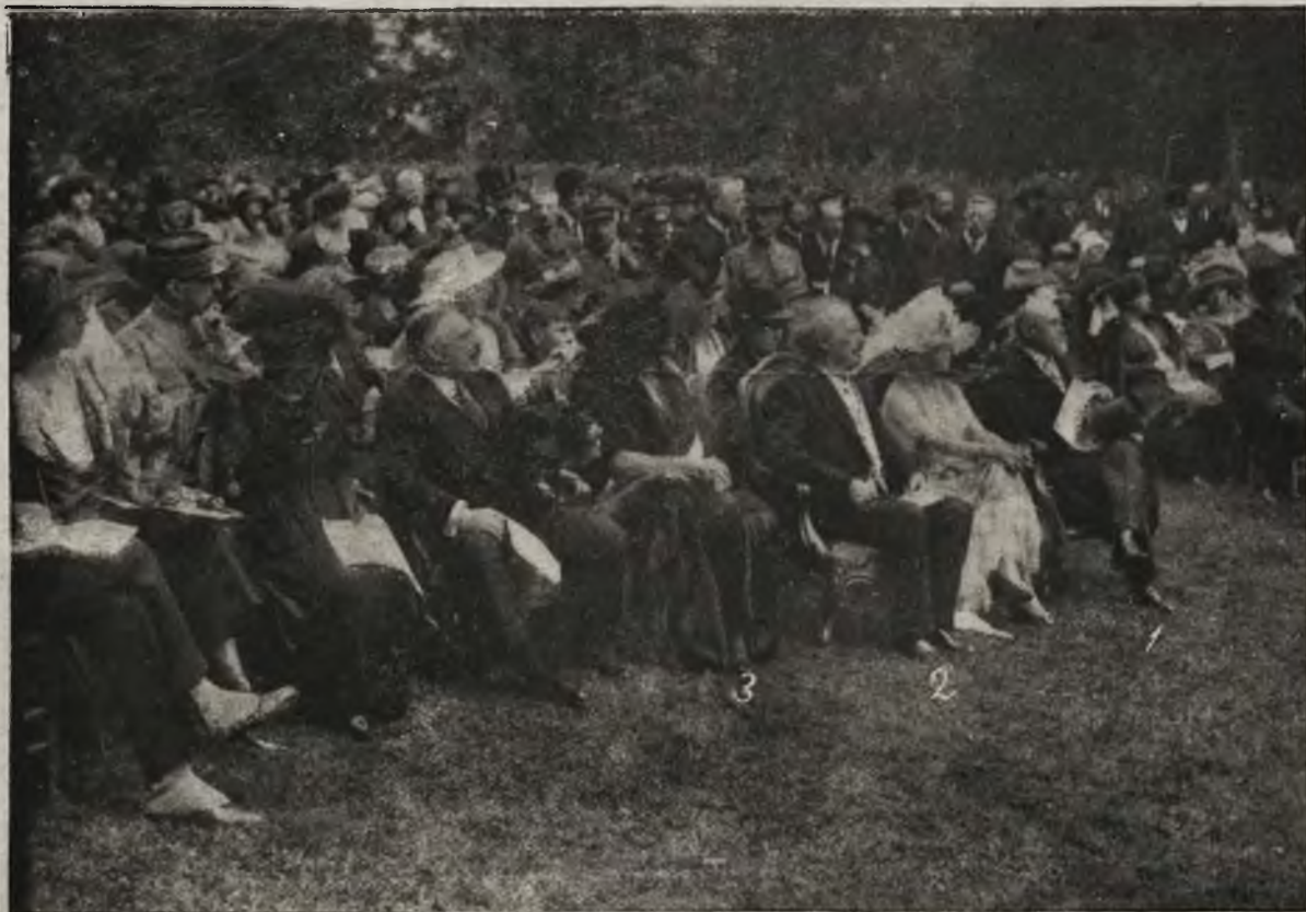
Dzień polski w Paryżu: Przedstawienie w pałacu księżnej Dondeauville na rzecz dnia polskiego.

Po długich miesiącach męczeńskiej doli wreszcie cała Galicya staje się państwowo ziemią polską, po miesiącach ciężkich walk i ciężkich zmagani, które pozostaną dla naszej historii smutną i krwawą przeszłością, a z drugiej strony ciężkim dokumentem ukraińskiej kultury, niedorastającej nawet do