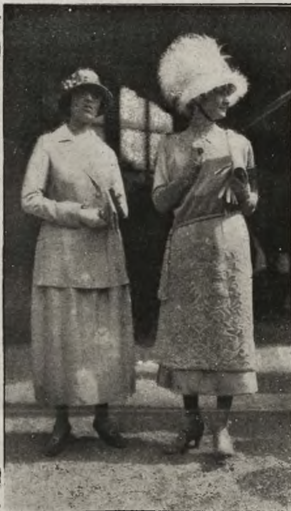
Mody paryskie: Kapelusz, który osiągnął duży sukces.

Na plac ćwiczeń przybył gen. Haller w otoczeniu sztabu, generałów i oficerów francuskich i włoskich, a odebrawszy raport, odbył przegląd stoją-