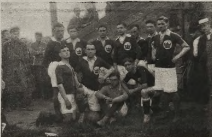
Warszawska drużyna „Kerona“.

Bohaterska obrona Łwowa kazała iść w bój i kobiecie polskiej, o czem dziś już mówi się bez żadnego zdziwienia, ale jako o rzeczy najzwyczaj-