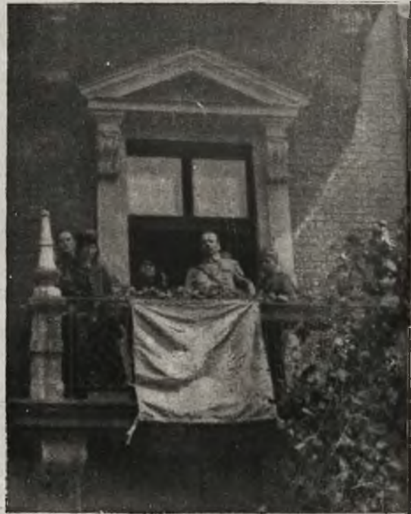
W Grunwaldską rocznicę: Gen. Haller na balkonie