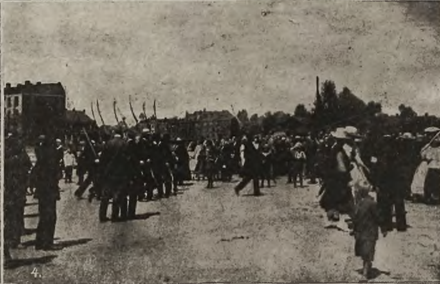
Grom górnośląski: 1) Przed kwaterą sztabu. 2) Barykady na ulicach Katowic. 3) Oddział powstańców przed wymarszem na front z miejsca postoju. 4) Oddział kosynierów w marszu.