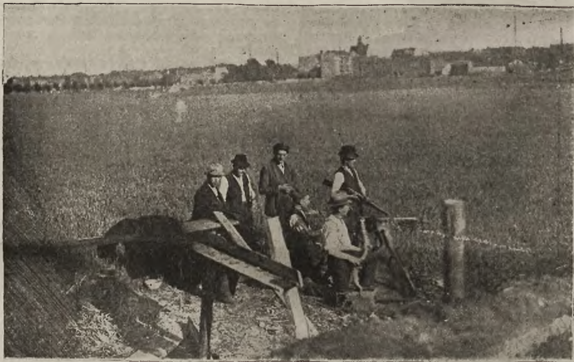
Grom górnośląski: Karabin maszynowy na pozycji pod Katowicami.

Ostatecznie gdy władze powstańcze wysłały ce-