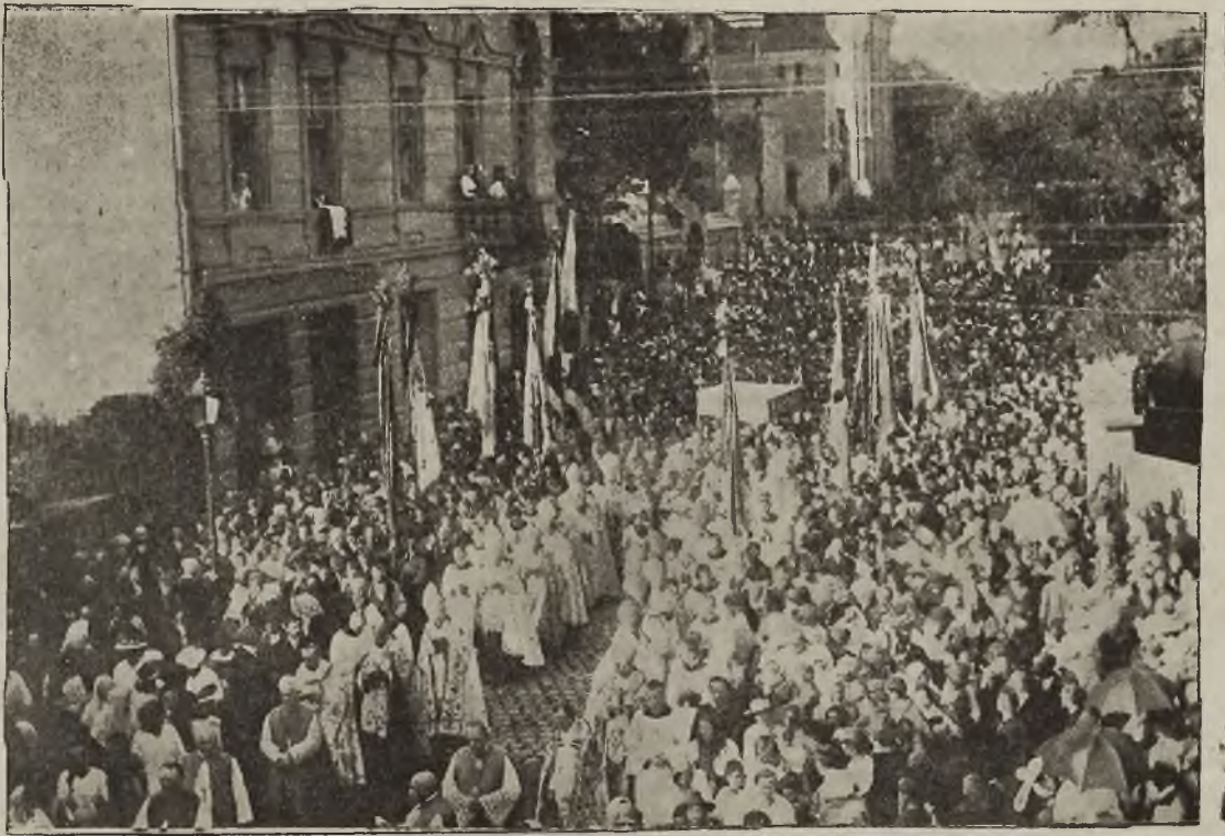
Zjazd Episkopatu polskiego w Krakowie: Biskupi w procesji ku czci Serca Jezusowego w dniu 3 czerwca b. r., prowadzonej przez Prymasa, kardynała Dalbora.