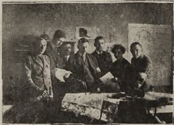
Grom górnośląski: W kwaterze Naczelnego dowództwa.

się o północy ze snu, dzwony wszystkich kościołów były ku niebu radością, księża śpiewali „Te Deum“, lud w uroczystych pochodach z biało-czerwonemi chorągwiemi urządził o godzinie 4 tej rano pochody. Naród cieszył się. Ale się mylił. To nie przemawia wcale do interesu panów dyplomatów. Tak objawia się tylko wola ludu — a oni uznają tylko swój interes.