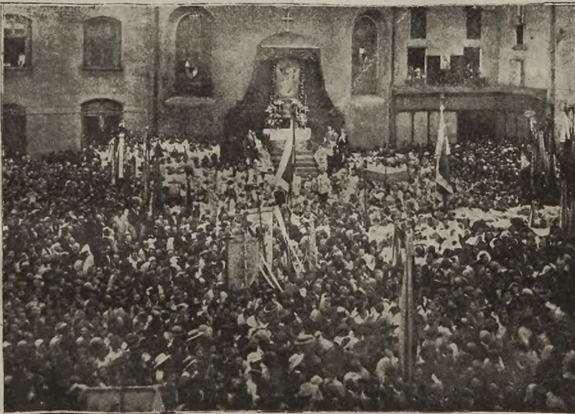
Zjazd Episkopatu polskiego w Krakowie: Mały Rynek w dniu 3 czerwca b. r. podczas kazania ks. biskupa Fulmana.

Procesja postępowała ulicami: Kopernika, Andrzeja Potockiego, Sienną i weszła na Mały Rynek, gdzie na tle kościoła św. Barbary ustawiono oltarz pięknie ozdobiony kwiatami. Z prawej strony oltarza