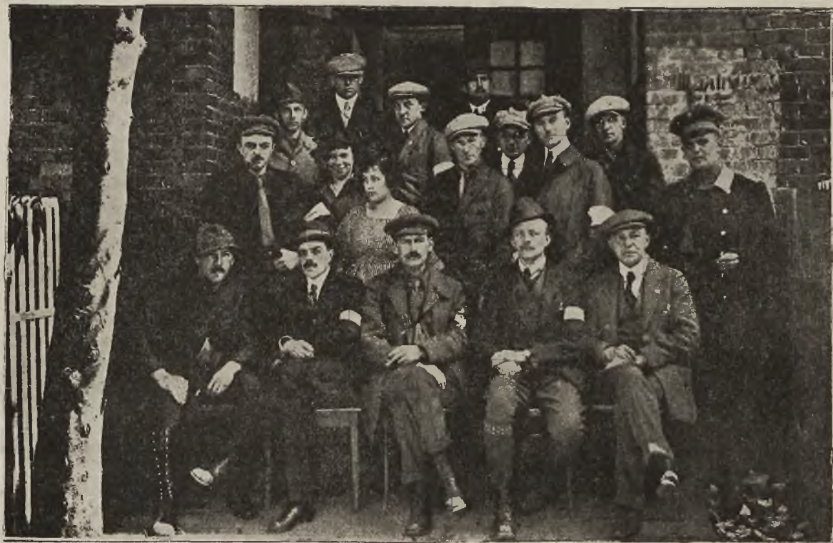
Grom górnośląski: Sztab Naczelnego Dowództwa.

padła na G. Śląsk jak grom wiadomość, że wnioski komisji międzysojuszniczej przyznają G. Śląsk Niemcom i pozostawiają polski lud w niewoli, — ruszył się robotnik i rolnik górnośląski samorzutnie, bez najmniejszej agitacji do walki, zajął zaraz w pierwszym dniu cały okręg przemysłowy, wszystkie sporne miasta, stanął zbrojnie nad Odrą i okazał światu polską siłę w tym kraju. Warto było widzieć radość tych ludzi w dzień, w którym ogłaszano linię demarkacyjną. Mężczyźni, kobiety i dzieci zerwały