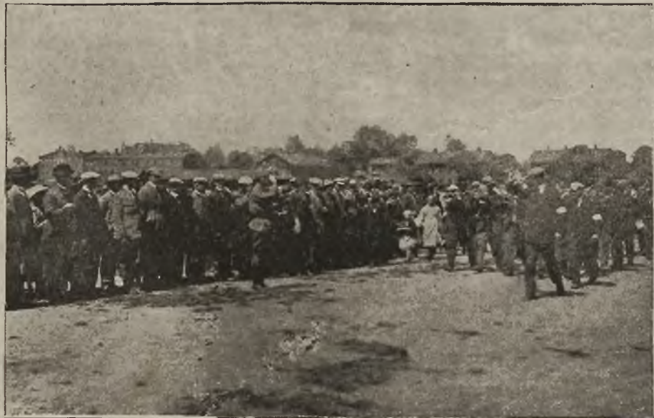
Defilada wojsk powstańczych przed Naczelnym Dowództwem.

Na specjalną uwagę zasługuje fakt, że Niemcy wywożą jeńców do Wrocławia. Nienawiść niemieckiej ludności cywilnej wywołana jest tendencyjnymi głosami prasy niemieckiej, która poprostu prowokuje wybuchy nienawiści opisami okrucieństw, rzekomo przez powstańców popełnianych.