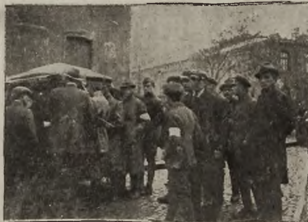
Grom górnośląski: Przed pierwszą ofensywą na Katowice w dniu 3. maja b. r.

Jeden z członków komisji, mającej za zadanie zbadanie identyczności pomordowanych przez Niemców mieszkańców wsi Stare Koźle i Brzeźce, opowiada, że czynności tejsze na miejscu, gdzie zwłoki zamordowanych pochowano, trwały z górą trzy godziny, każda z ofiar była bowiem zmasakrowana w tak bestyalski sposób, że powierzchowne tylko stwierdzenie uszkodzeń zajęło sporo czasu. Zbadano zaledwie pięć trupów, szósty również ze Starego Koźła, okazywał mniej znaczne obrażenia cielesne.