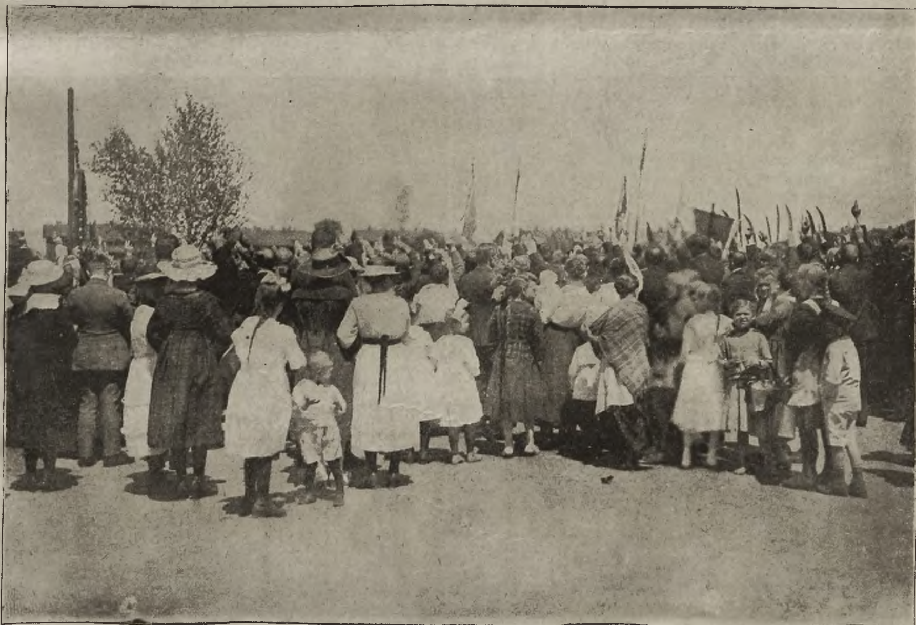
Przysięga kosynierów w jednej z górnośląskich miejscowości.

TRESC: Grom górnośląski — Zjazd Episkopatu polskiego w Krakowie — Straszne okrucieństwa Niemców na Górnym Śląsku — Sport w naszej armii.