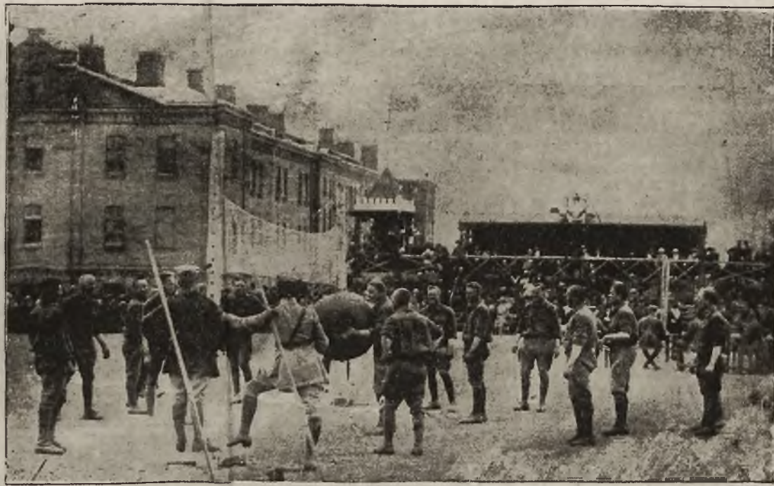
Sport w naszej armii: Zawody lekkoatletyczne załogi lubelskiej, odbyte w dniu 15 maja b. r. Gra „piłką olbrzymem“.

W ślad za wojskowością i cywilna ludność Lublina baczniejszą uwagę zaczyna zwracać na wychowawcze znaczenie zabaw i gier ruchowych. Inicytywę w tam kierunku podjął tamtejszy „Sokół“, a zabiegi jego nie pozostały bez skutku. Szeregi miłośników sportu rosną w Lublinie z każdym dniem, coraz częściej garną się do nich nawet i ci, którzy dotąd nie przyznawali temu kierunkowi wychowania takiego znaczenia na jakie w samej rzeczy zasługuje.