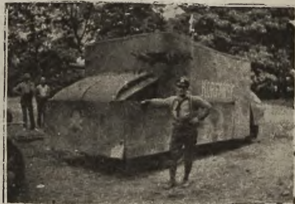
Grom górnośląski: Samochód pancerny „Korfanty“.