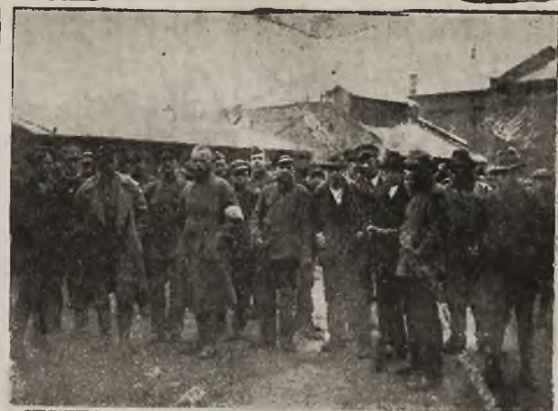
Grom górnośląski: Grupa powstańców.

władzę sprawując; ustawy nasze niech będą świętego prawa Twego odbiciem; wo sko nasze niech pod Twym znakiem strzeże granic Ojczyzny; wiedza od Twojej prawdy światła zapożycza i Ciebie publicznie niech wyznaje; życie nasze całe społeczne i rodzinne niech Twym duchem się napoi i na zasadach Twych się oprze. Dziś oddajemy Ci cały nasz naród w zupełne i niepodzielne władanie, oddajemy Ci i poświęcamy jego miasta i wioski, jego prawa i zwyczaje, jego prace i trudy, jego potrzeby i je-