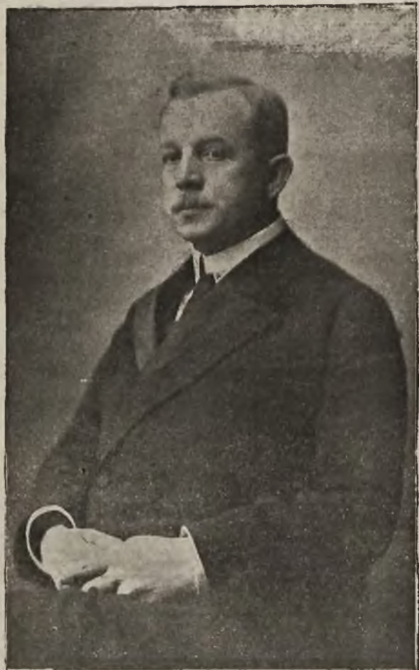
Grom górnośląski: Dyktator górnośląski Wojciech Korfanty.

I p. Lloyd George nie pomylił się. Anglia ma wielkie zrozumienie dla światowych spraw gospodarczych, wobec których kwestya granic i równo-