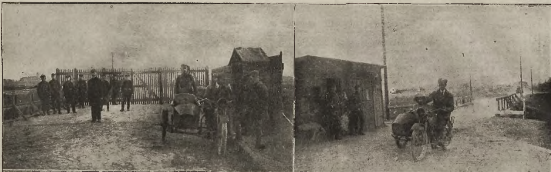
Grom górnośląski: Na granicy Polski i Górnego Śląska. Na lewo: zamknięta ściśle granica polska, na prawo: granica górnośląska z posterunkiem „Zielonej Policji“.

robiące wrażenie ran od przyoczenia (cygarem). Lewa ręka między palcem 3 a 5 przebita, trudno stwierdzić czy od kuli, czy też od gwoźdźcia. Na lewej stronie płuc, poniżej łopatki, rana 6 cm. długa, 4 szeroka. Rana głęboka wyglądająca na ranę od bagnetu czy noża. Prócz tego widać na plecach liczne pręgi od uderzeń kijem lub grubą gumą.