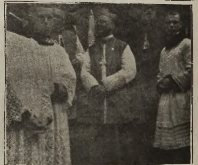
Zjazd Episkopatu polskiego w Krakowie: Książęta Kościoła opuszczają Katedrę po uroczystym „Veni Creator”.

Po dokonanej konsekracji kościoła na Wesolej ks. Prymas Dalbor oraz cały Episkopat przyjmowali w gmachu OO. Jezuitów delegację górali pod-