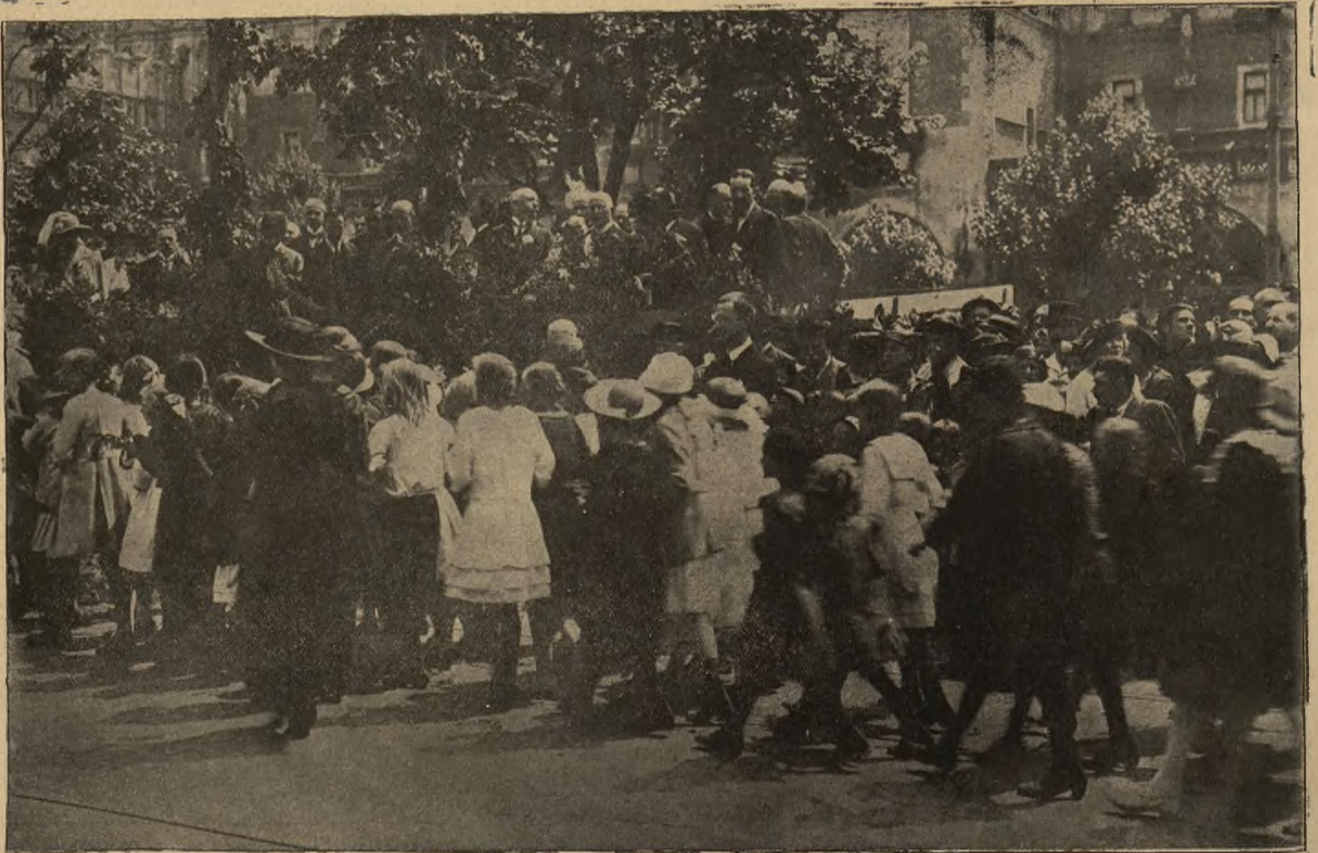
Hołd krakowskiej dziatwy Ameryce: Defilada dziatwy przed przedstawicielami P. K. P. D. w dniu 26 czerwca b. r. na Rynku krakowskim.

mi i barwami Polski, Krakowa i Ameryki. Na trybunie zajęli miejsce przedstawiciele Ameryki, Członkowie Komitetu wykonawczego Polsko Amerykańskiego Dzieciom, reprezentanci władz i zaproszeni goście, u jej stóp przeciagnął, kierując się od wylotu ul. św. Anny, z górą dwie godziny trwający korowód