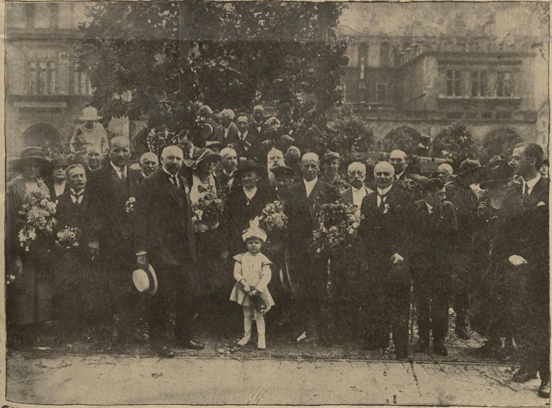
Komitet wykonawczy P. A. K. P. D. wraz z gośćmi po defiladzie.

TRESC NUMERU: Od Administracji. — Hołd krakowskiej dziatwy Ameryce. — Trzydziestolecie lwowskiego Koła Pań T. S. L. — Stanisław Przybyszewski w Bydgoszczy. — Zgon przyjaciela Polaków. — Poświęcenie sztandaru Ochotniczej Straży Pożarnej warsztatów kolejowych we Lwowie. — Tragiczny zgon polskiego pedagoga. — Przyszli artyści. — Zamordowanie niemieckiego ministra spraw zagranicznych. — Intronizacja Króla Kurkowego we Lwowie. — Zaślubiny króla Aleksandra Karageorgiewicza. — Zagadki. — i t. d.