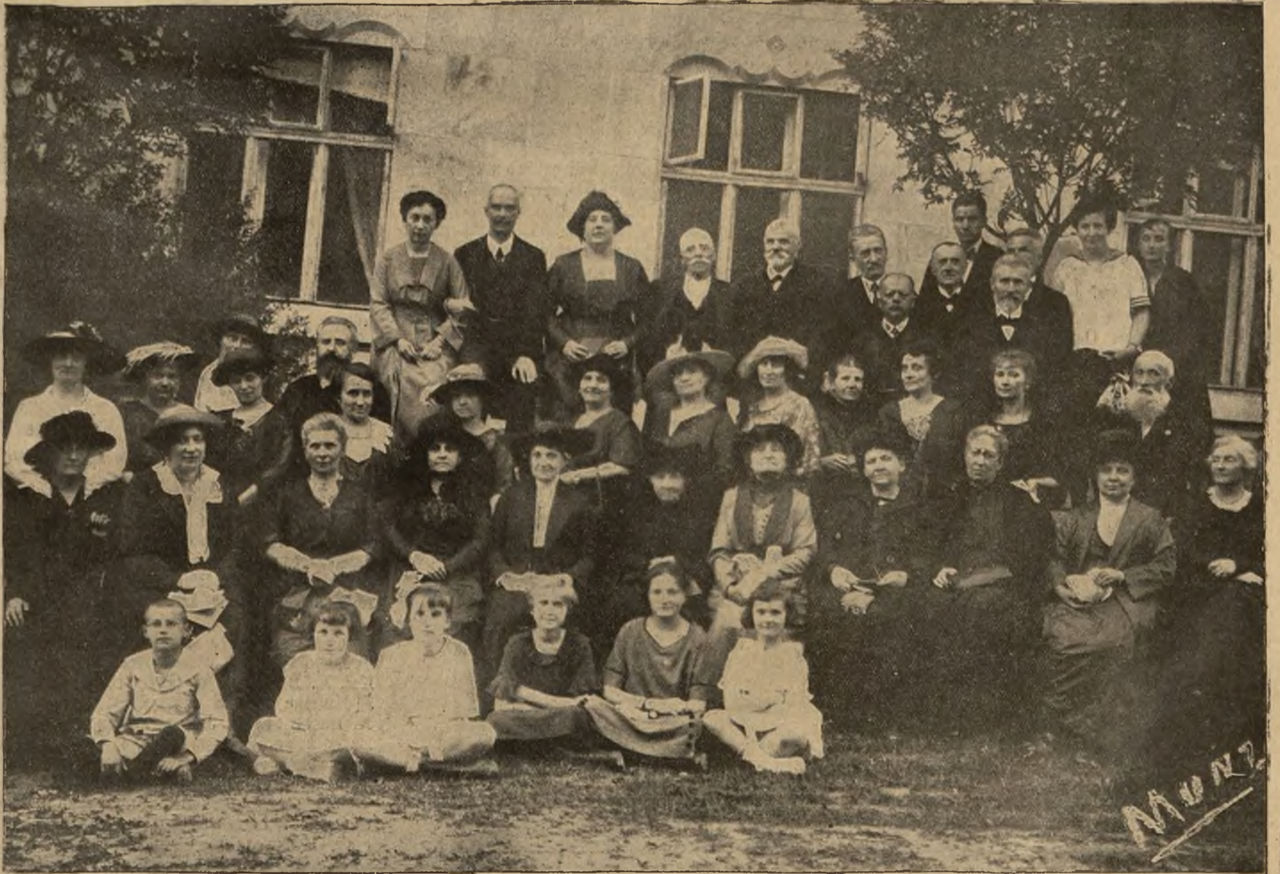
Trzydziestolecie lwowskiego Koła Pań T.S.L.: Zarząd i członkowie Koła.

Wzruszony serdecznie autor i jubilat podziękował ze sceny za okazane mu dowody czci i przywiązania,