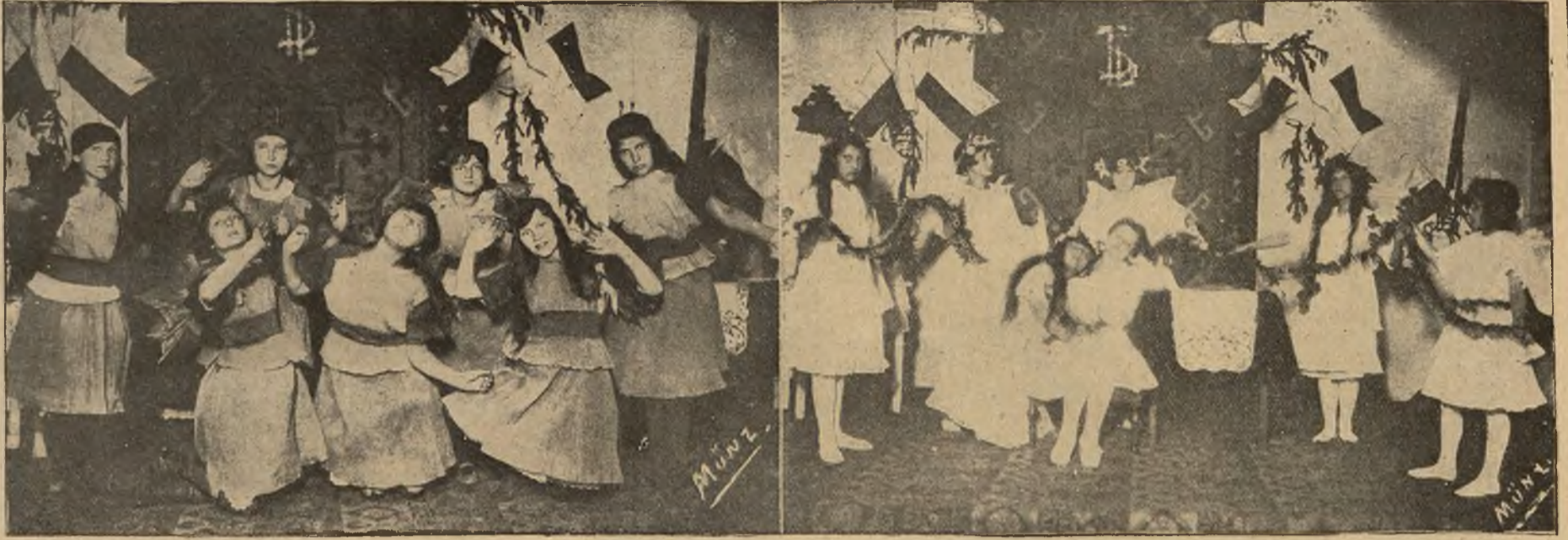
Trzydziestolecie lwowskiego Koła Pań T.S.L.: „Taniec pszczoł“ i „taniec kwiatów,“ wykonane przez dziewczęta podczas obchodu jubileuszowego.

Wieczorem w Teatrze Miejskim, przy szczelnie wypełnionej widowni odbyło się uroczyste przedstawienie „Topieli“ jednego z najznakomitszych dra-