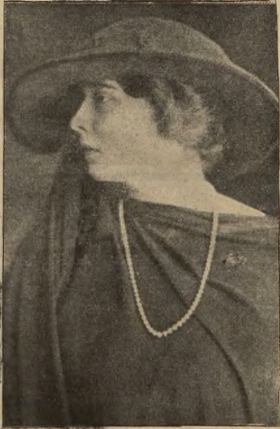
Zaślubiny króla Aleksandra Karageorgiewicza: Księżniczka Marya rumuńska, młodsza córka króla Ferdynanda.

Wśród żywiołowych wybuchów entuzjazmu i radości odbył się dn. 8 czerwca b. r. ślub króla z księżniczką Maryą w katedrze. Pałac królewski, na głównej ulicy Milana, na którym powiewały sztandary rumuński i serbski, świeżo dopiero został ukończony. Dołączono do niego bowiem nowe skrzydło i król Aleksander mieszkał w ostatnich czasach w skromnych pokojach w pobliżu. Do ślubu jechał on z królową rumuńską w otwartym powozie, a poprzedał go książę Yorku i księżę Arsen serbski. Za nim zaś jechała panna młoda z ojcem, przybrana w białą suknię z rzymskiego satynu. Piękną fryzurę miała owiniętą wiankiem z białych kwiatów, a na ramiona jej spływały długie, złociste welony. U wejścia do niewielkiej, barokowej katedry przyjął zastęp ten patriarchy, wręczył im egzemplarz biblij i dał im do pocałowania ikonę. Książę Yorku grał rolę głównego świadka ślubu czyli „kuma”, a stryj króla, książę Arsen, mistrza ceremonii, czyli „Stari Swat”, starego swata. Oni to trzymali świece i wieńce ślubne podczas ceremonii ślubu, którego udzielał siwowłosy patriarchy w asyście 4 biskupów. Po włożeniu pierścionków na palce pary młodej król, królowa i wszyscy najbliżsi uczestnicy obeszli trzykrotnie dookoła stołu, na którym spoczywały ikony i biblie.