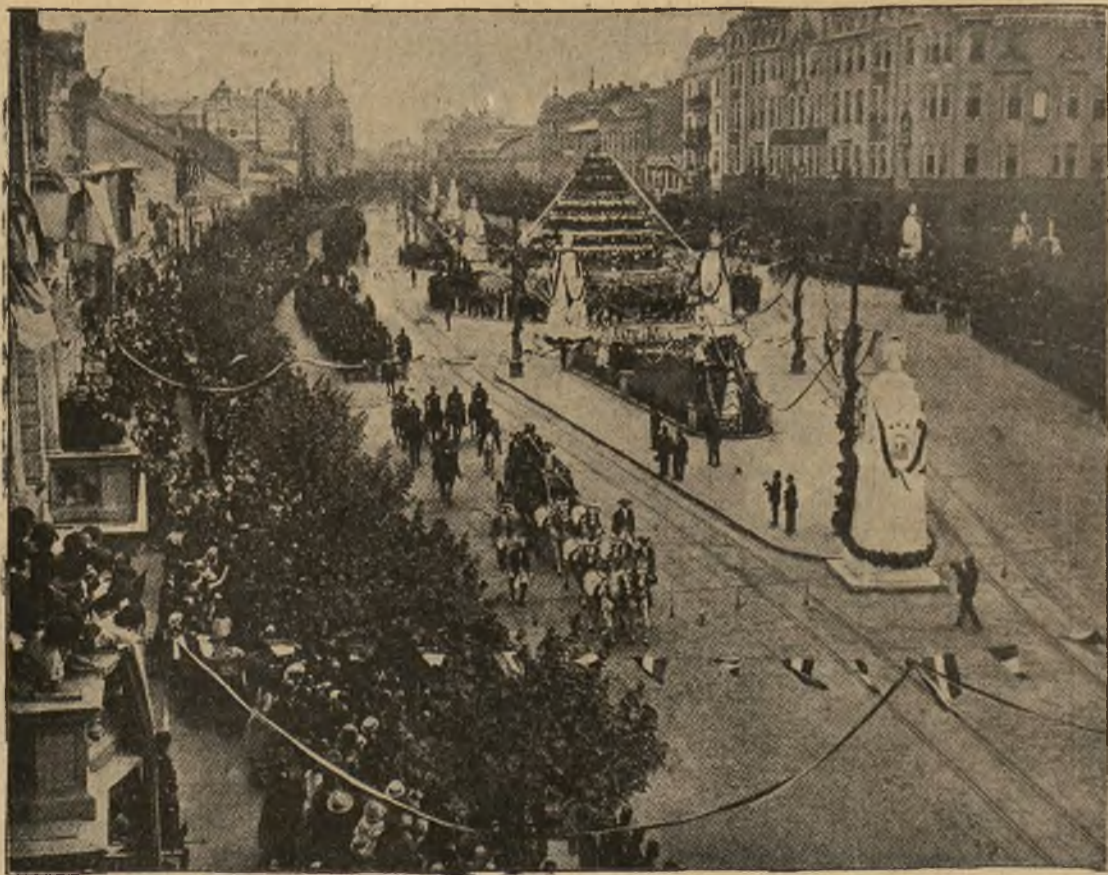
Zaślubiny króla Aleksandra Karageorgiewicza: Księżniczka Marya wraz z ojcem w drodze do katedry belgradzkiej.