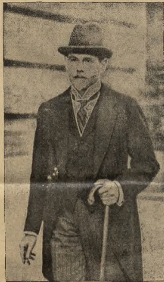
Zamordowanie niemieckiego ministra spraw zagranicznych: Walter Rathenau, niemiecki minister spraw zagranicznych.

Gdy wiadomość o śmierci Rathenaua doszła do parlamentu, dało to powód do gwałtownych manifestacji przeciw prawicy i okrzyków, wskazujących na niemieckich nacjonalistów, jako ra morderców. Kanclerz Dr. Wirth poświęcił zamordowanemu gorące wspomnienie, poczem posiedzenie na znak żałoby przerwano. Na radzie gabinetowej, zwołanej niezwłocznie przemawiał również dr. Wirth, podnosząc zasługi Rathenaua dla republiki niemieckiej, ze względu zaś na polityczny charakter morderstwa, aby uniknąć demonstracji i zaburzeń, uchwalono zaprowadzić w Niemczech stan wyjątkowy.