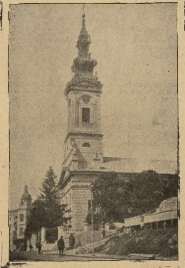
Zaślubiny króla Aleksandra Karageorgiewicza: Katedra w Belgradzie, w której pobłogosławiony został w dniu 8. czerwca b. r. związek małżeński króla Aleksandra z księżniczką Maryą rumuńską.

zek małżeński króla Aleksandra z księżniczką rumuńską Maryą. Fakt, na oko zwykły, dla polityki europejskiej mający jednak bardzo doniosłe znaczenie, zwrócił uwagę całego świata na Belgrad i Małą Ententę, mającą zapewnić pokój w środkowej i wschodniej Europie.