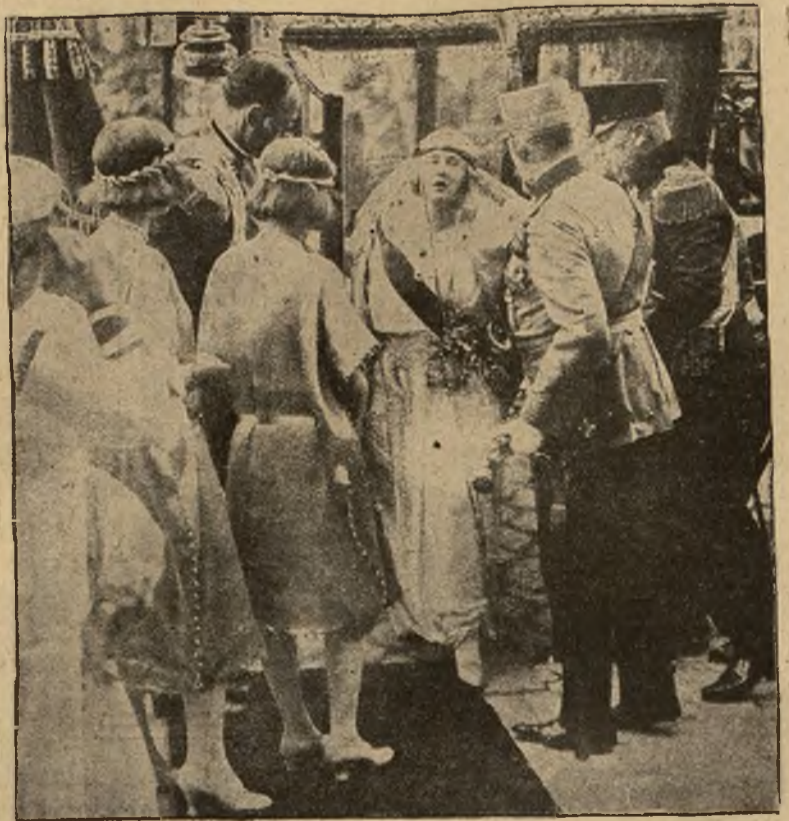
Zaślubiny króla Aleksandra Karageorgiewicza: I) Król Aleksander w towarzystwie królowej matki rumuńskiej. II) Księżniczka Marya wysiada z karety dworskiej przed katedrą belgradzką.