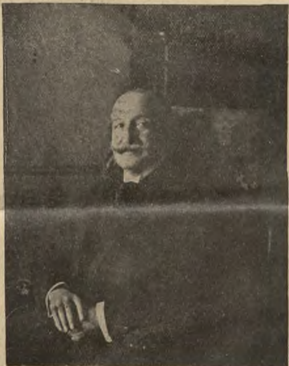
Zgon przyjaciela Polaków: Take Jonescu, b. rumuński przydynt gabinetu i minister spraw zagranicznych.

Przyjaciół serdeczny Venizelosa, był razem z nim autorem koncepcji sprzymierzenia ze sobą wszystkich małych państw środkowej Europy, które z wojny światowej wyszły zwycięsko. Koncepcję tę zaczął też wprowadzać w czyn, przystępując do przymierza czesko-jugosłowiańskiego i tworząc w ten sposób Małą Ententę, następnie zawierając przymierze rumuńsko-polskie. Pośrednictwo w sporze polsko-czeskim i stała pomoc dyplomatyczna jakiej