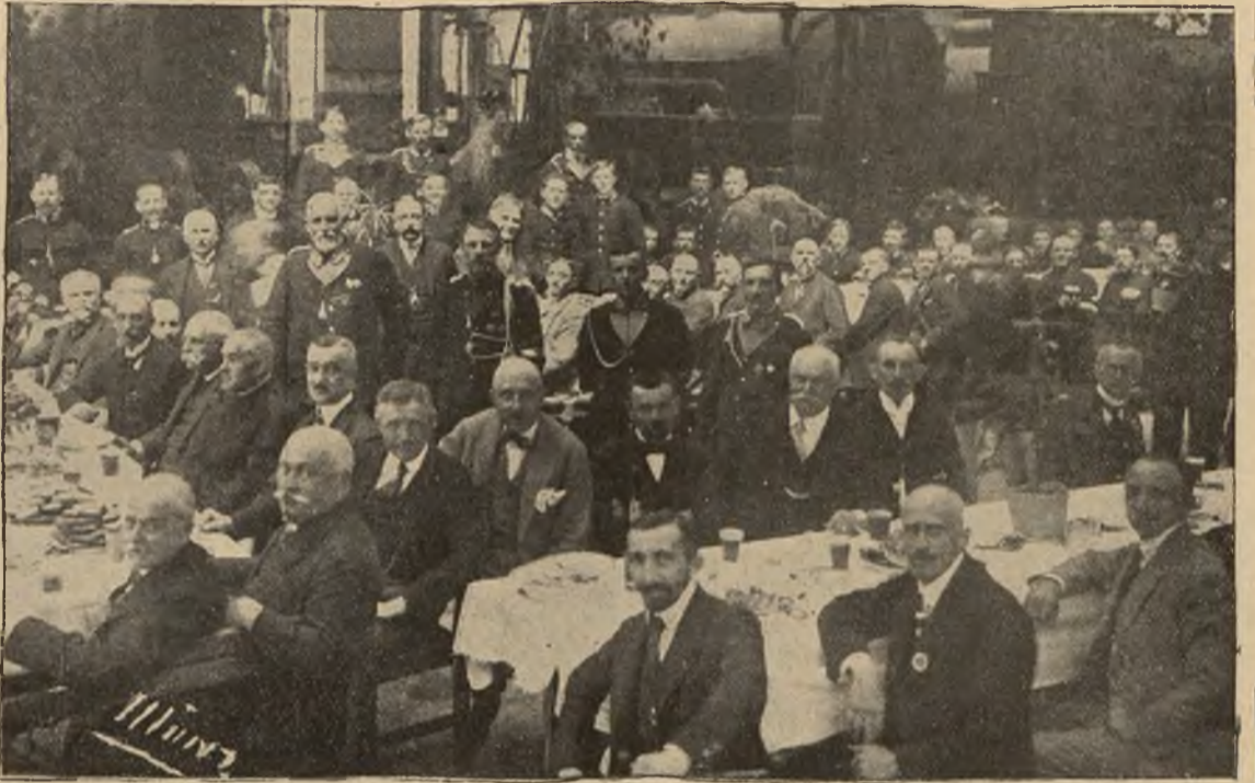
Poświęcenie sztandaru Ochotniczej Straży Pożarnej warsztatów kolejowych we Lwowie: Przyjęcie członków Straży i gości w hali montowania parowozów.

czym, jest ich kilkunasto), jakoteż wśród nauczycielstwa śpiewu i muzyki. Zasługi w tym względzie wielkie uznaje prasa codzienna i liczni zwolennicy, którzy na każdą produkcję uczniów cenionego mae-stra spieszą nawet z poza granic Krakowa. Ostatni popis, będący właściwie wspaniałym koncertem o starannie zestawionym programie, njętym w produkcję zespołową i chóralną, przedstawił parę talentów w różnych stadiach rozwoju, od początkujących do ukończonych, mogących już stanąć do pracy zawodowej. Taką jest w pierwszej linii p. Doleżanka (pod tym