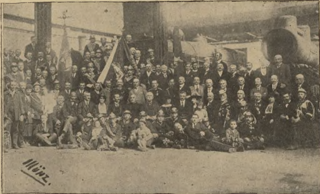
Poświęcenie sztandaru Ochotniczej Straży Pożarnej warsztatów kolejowych we Lwowie: Członkowie Straży, rodzice chrzestni i zaproszeni goście po akcie poświęcenia.