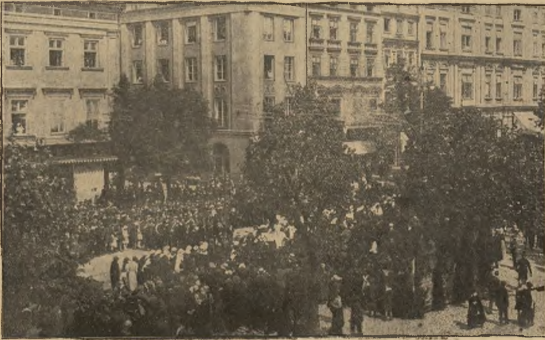
Hołd krakowskiej dziatwy Ameryce: Rynek krakowski podczas defilady dzieci w dnia 26. czerwca b. r.

Nad roztrząsaniem działalności Towarzystwa Szkoły Ludowej, zwłaszcza na kresach wschodnich, rozwodzić się nie potrzebujemy, każdy, kto kiedykolwiek miał sposobność odwiedzić była Galicyę Wschodnią, mógł się przekonać, jakie zasługi dla rozwoju polskości położyły jego placówki, najdalej na wschód wysunięte. Niespożytej energii i prawdziwie obywatelskiemu poświęceniu się członków T.S.L. zawdzięczać należy zwalczanie trudności, których nie brakło nie tylko ze strony wrogich nam żywiołów, ale także i z szeregów własnego społeczeństwa, niejednokrotnie zapoznającego lub niedoceniającego należycie znaczenia tej w całej pełni kulturalnej instytucji. Dziś, Bogu dzięki, otworzy się oczy, nawet