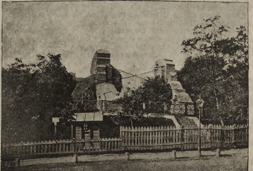
1) Zjazd Aleksandrowski prowadzący do przystani na Dnieprze — 2) Słynny monaster (ławra) Kijowo-Pieczerski — 3) Widok z lewej strony Dniepru na Kijów — 4) Obecny stan Złotej Bramy w Kijowie.

TRESC: Nowy szef sztabu D. O. G. w Krakowie — Zjazd Konserwatorów zabytków — Japoński gość w Krakowie — Pierwszy wojskowy kurs stenografii — Z życia obozu na Dąbiu koło Krakowa — Teatr polski na froncie podolskim — i t. d.