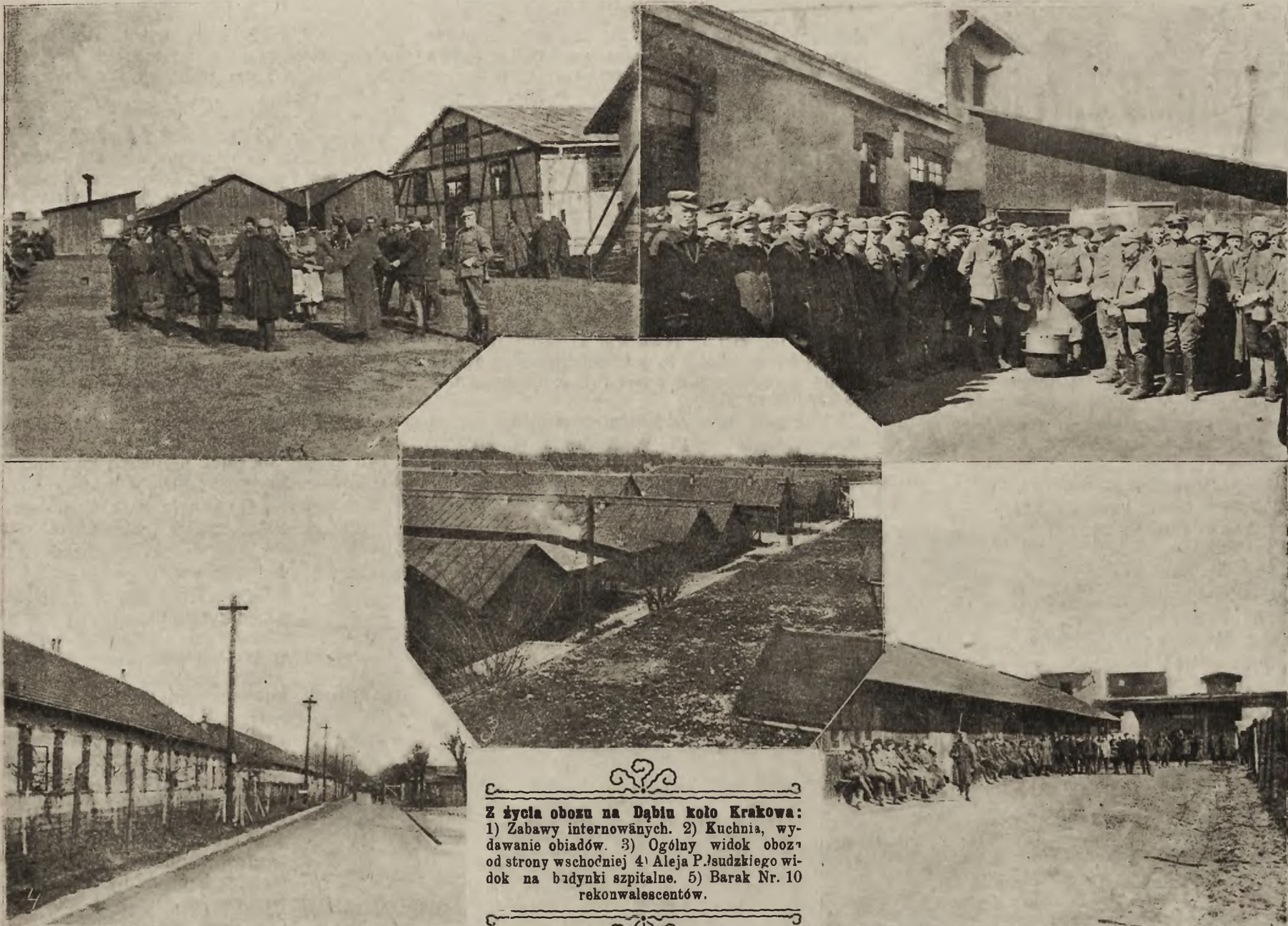
Z życia obozu na Dąbju koło Krakowa: 1) Zabawy internowanych. 2) Kuchnia, wydawanie obiadów. 3) Ogólny widok obozu od strony wschodniej 4) Aleja P. Sudzkiego widok na budynki szpitalne. 5) Barak Nr. 10 rekonwalescentów.