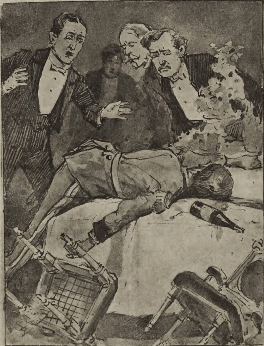
Na stole, zgięty naprzód, leżał kapitan Fraskopelly z rozstrzaskaną czaszką.

Czyż był to dowód dostateczny, że był on własnością jedyne go bogatego Amerykanina, który znajdował się w towarzystwie, Reginalda Farweth'a.