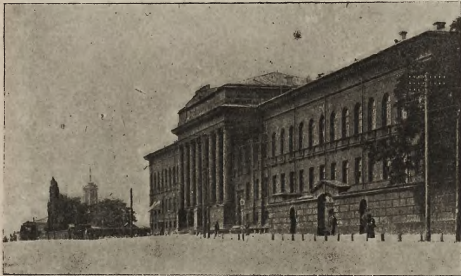
Polska tworzy niezależną Ukrainę Uniwersytet św Włodzimierza w Kijowie.