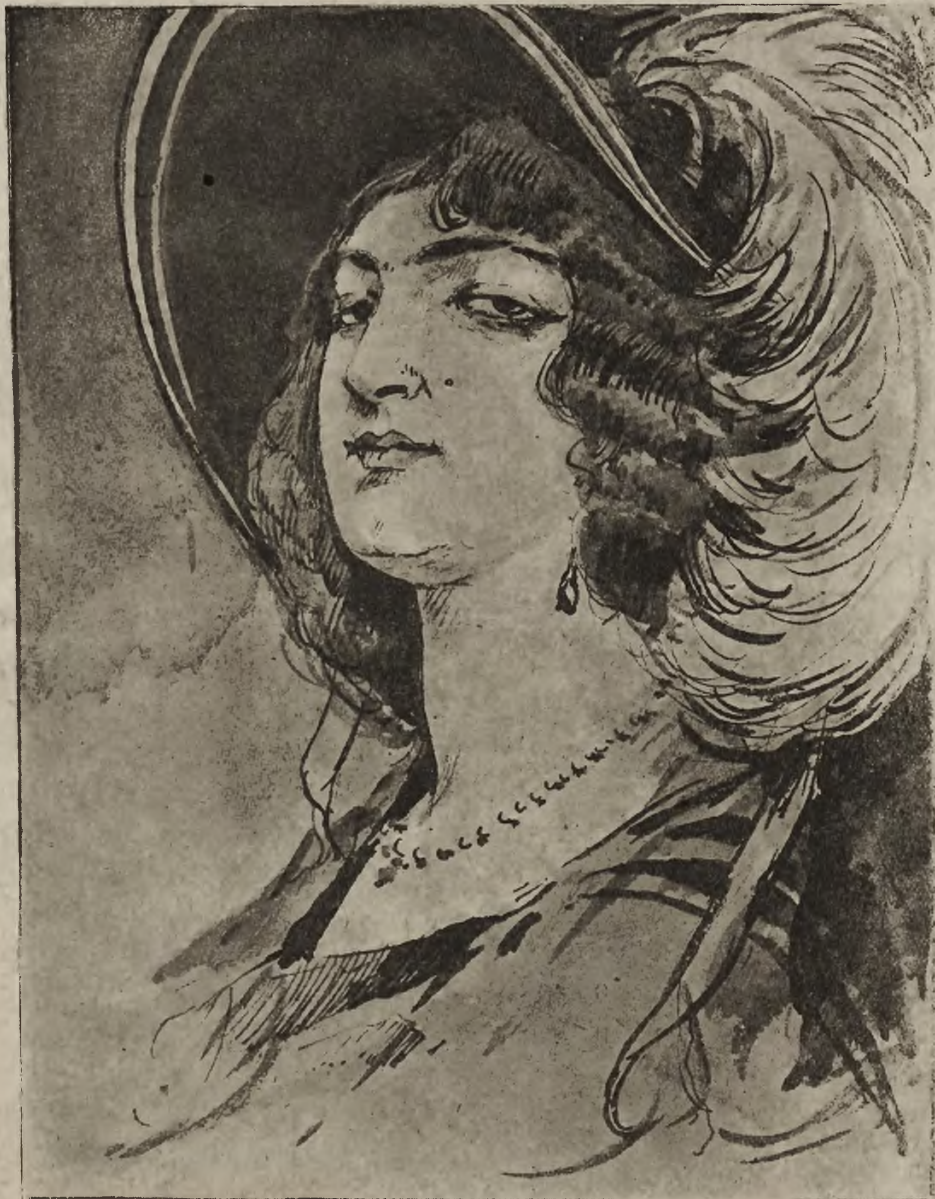
„Bella Donna” Mrs. Chepstow.

możliwe, sędzę, że to będzie najlepszym lekarstwem i nie widzę przyczyny, dla którejby pan nie dożył stu lat.