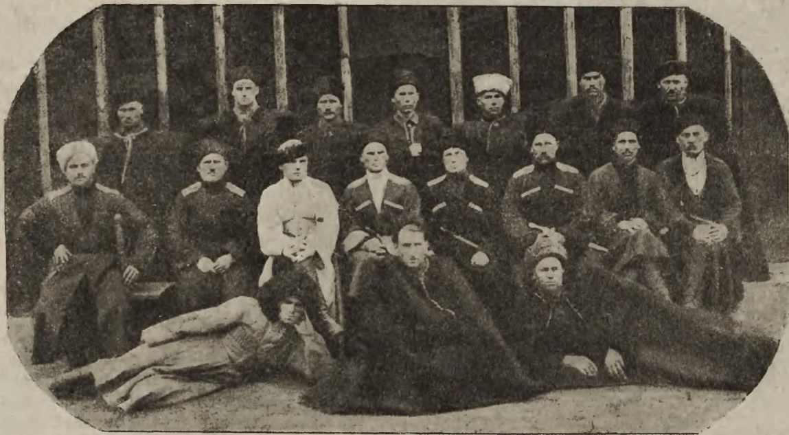
Z życia obozu na Dąbju koło Krakowa: Grupa kozaków z oficerami z armii Bredowa.