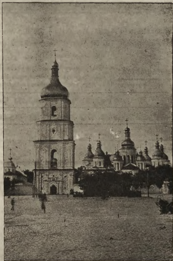
Polska tworzy niezależną Ukrainę: Sobór św. Zofii, najstarszy zabytek sztuki ruskiej wybudowany 1037 r.

Z zajętego Kijowa podajemy szereg ciekawych zdjęć przedstawiających często wspomniane w komunikatach punkty naddnieprzańskie grodu.