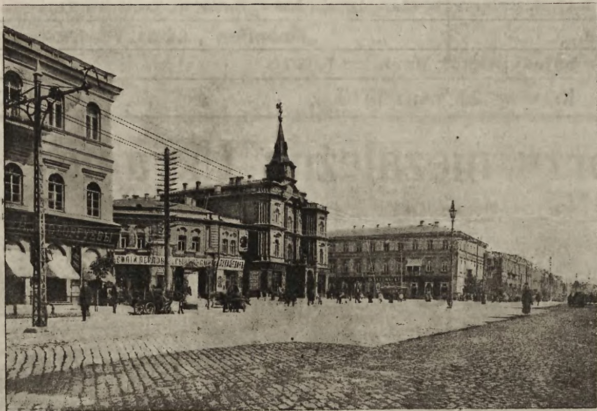
Polska tworzy niezależną Ukrainę: Rynek Kreszczatyka — najruchliwsza arteria miasta. Tu odbył się przed generałem Rydzem-Smigłym przegląd wojsk polskich wkraczających do Kijowa.