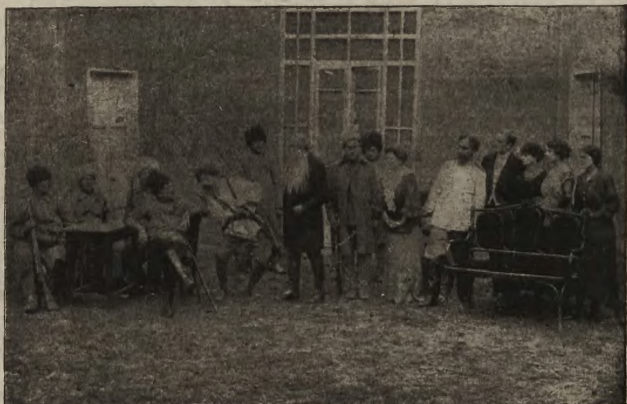
Teatr polski na froncie podolskim: Dwie sceny ze sztuki p. t. „Gubernator i Trocki”.