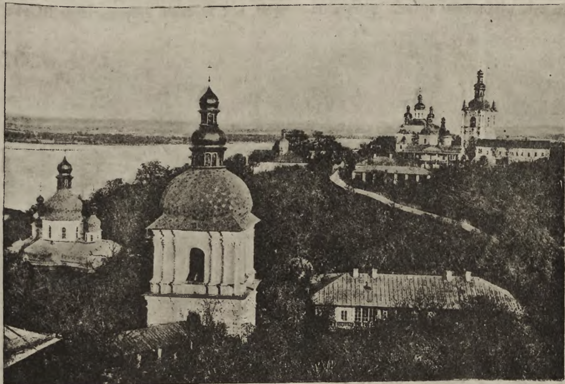
Polska tworzy niezależną Ukrainę: Grupa monasterów i cerkwi rosyjskich z widokiem na Dniepr.