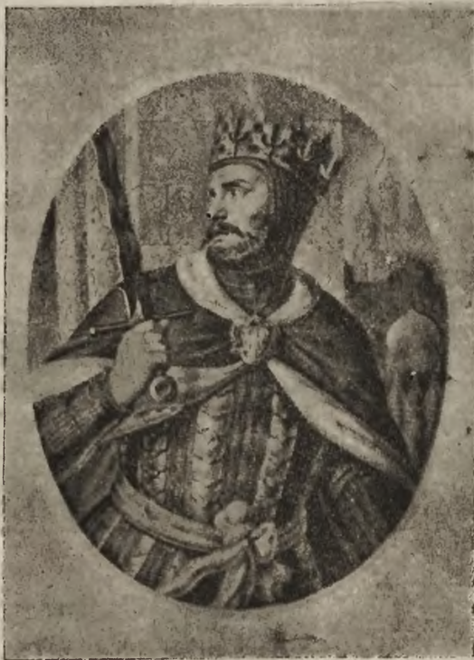
Polska tworzy niezależną Ukrainę: Bolesław Chrobry zdobywca Kijowa w 1017 r.

I dlatego, uprzedzając atak czerwonych armii na swe ziemie, posunęła się ku Wschodowi i to w granicach swych historycznych, zastrzegając się wyraźnie, że dyrektywą dla niej będzie wola lud-