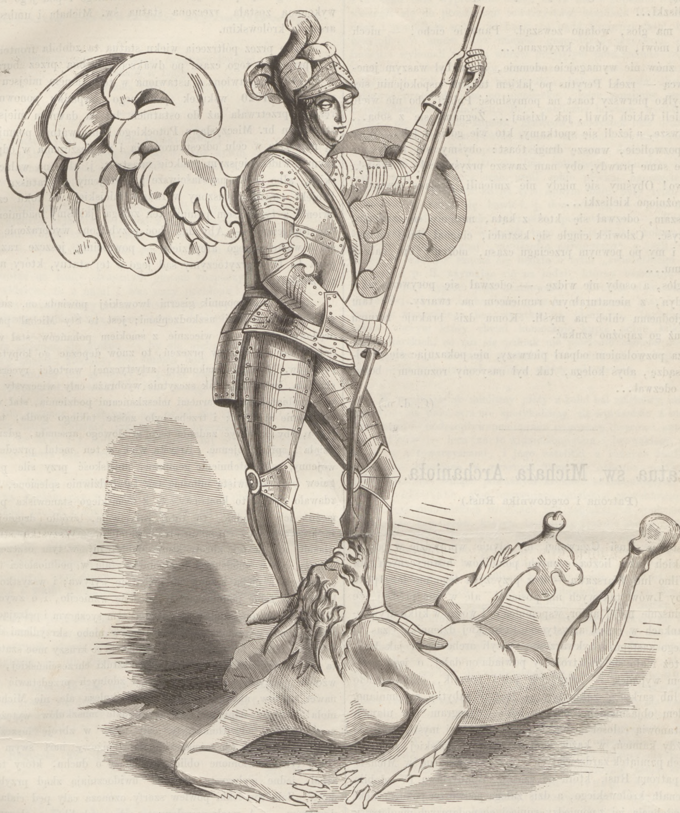
Michał Archanioł, orędownik i patron Rusi.

Nowo przybyły miał lat już trzydzieści parę, szatyn, z krótkimi i w górę podniesionymi włosami, cały zarosnięty. W całej fizjonomji panowało jakieś zaniedbanie. Oczy tylko czarne jaśniały męzkim ogniem, chociaż na całej twarzy rozlała się pewna zbolałość i cierpienie.