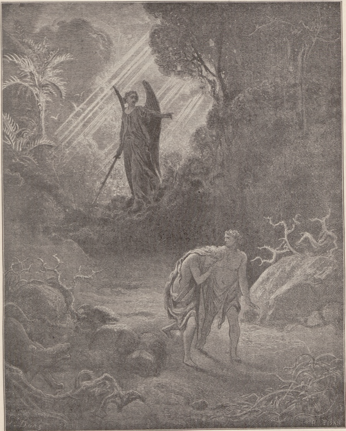
ADAM I EWA WYGNANI Z RAJU.