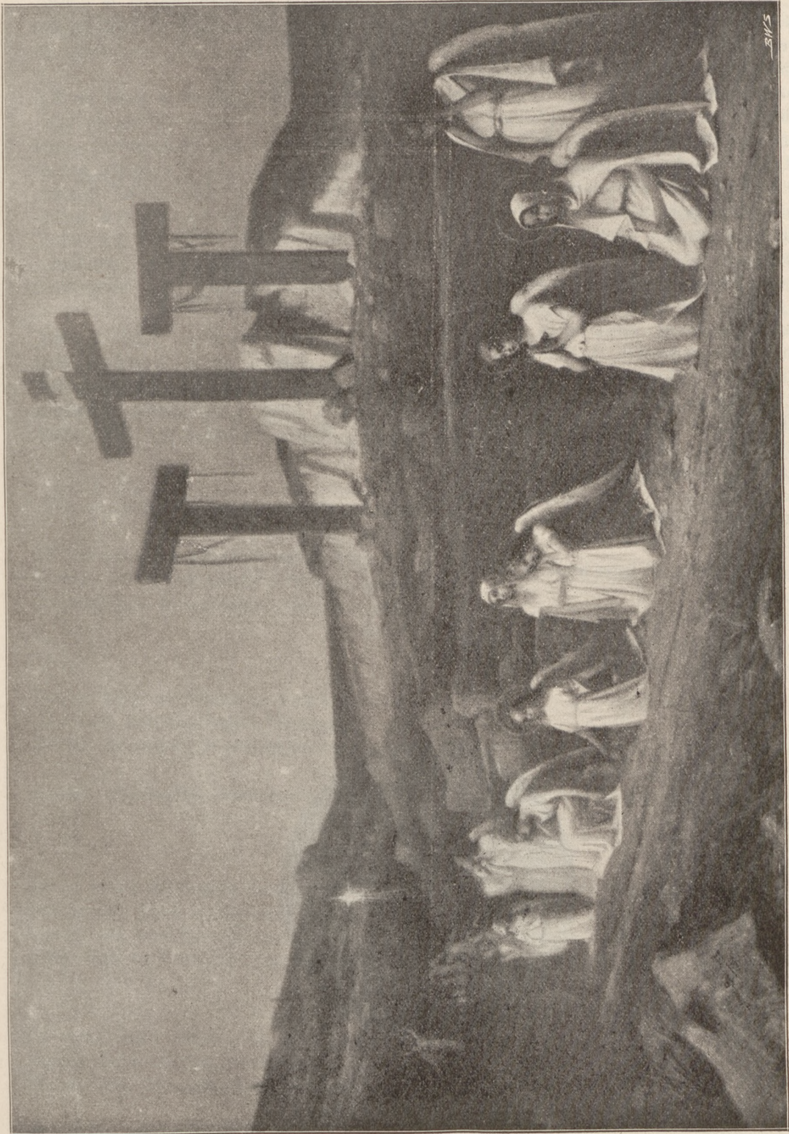
ANIOŁOWIE NA GOLGOCIE.